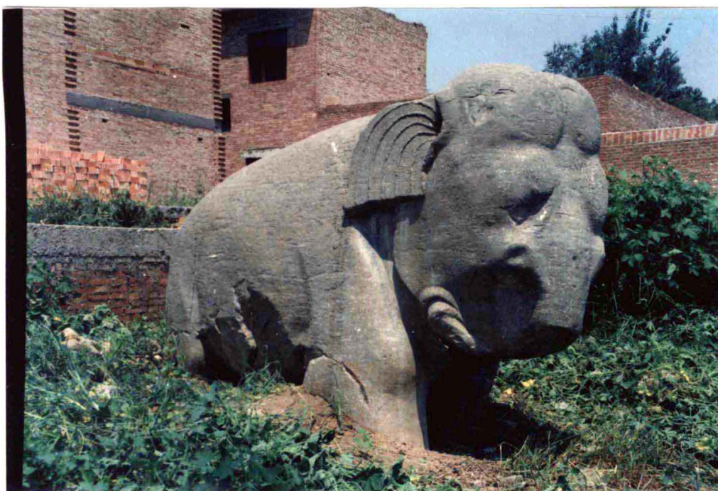
石象腹部风化掉块情况