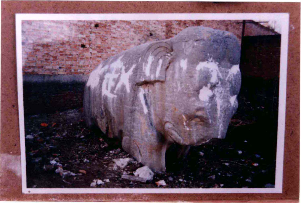
环境破坏及石象腿部埋没情况