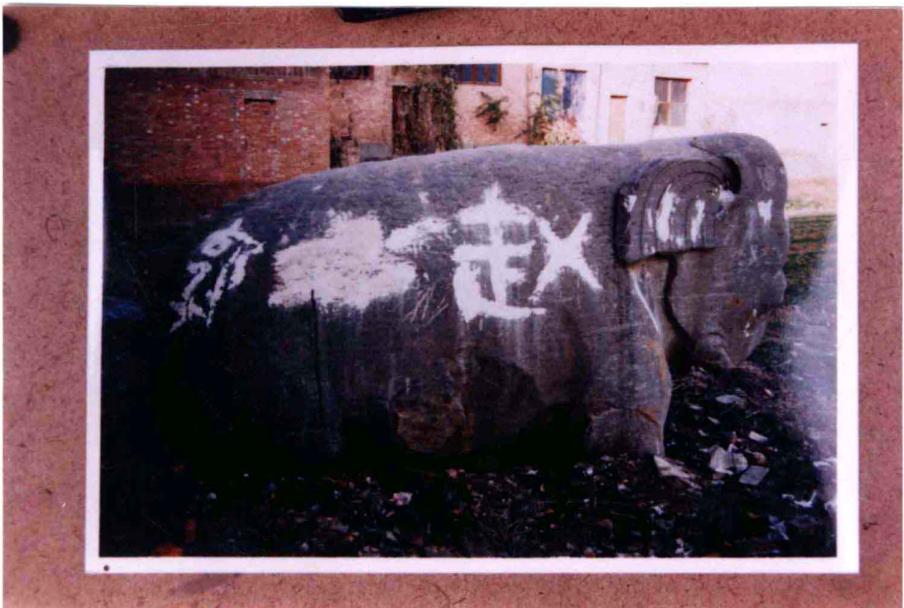
石象被人为刻划、涂抹情况