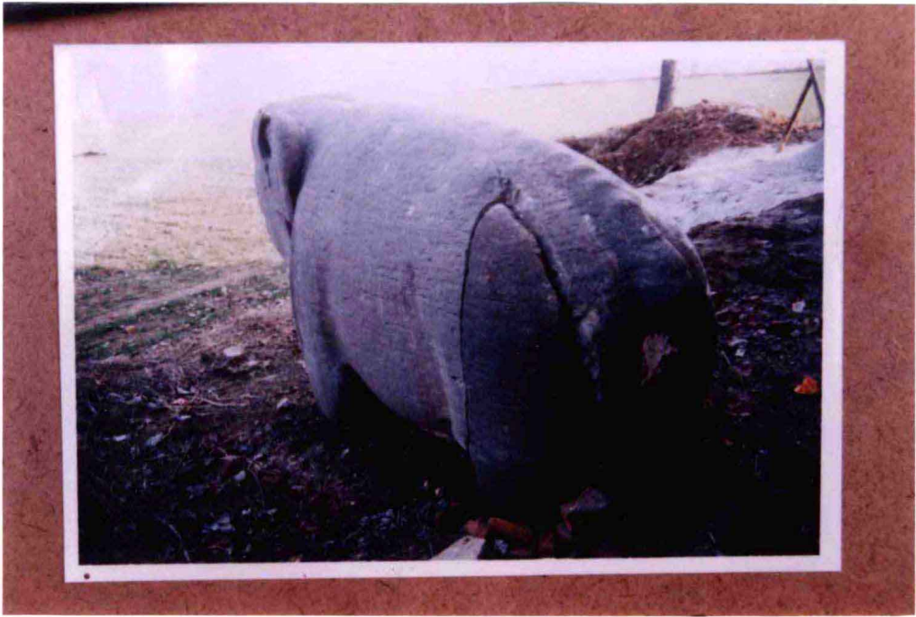
石象后腿部裂缝情况