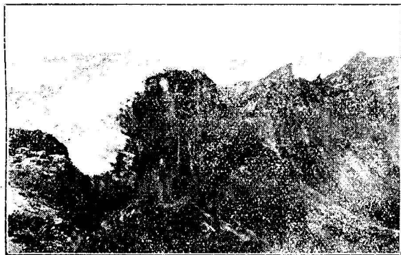
(白頭山)之火山口壁