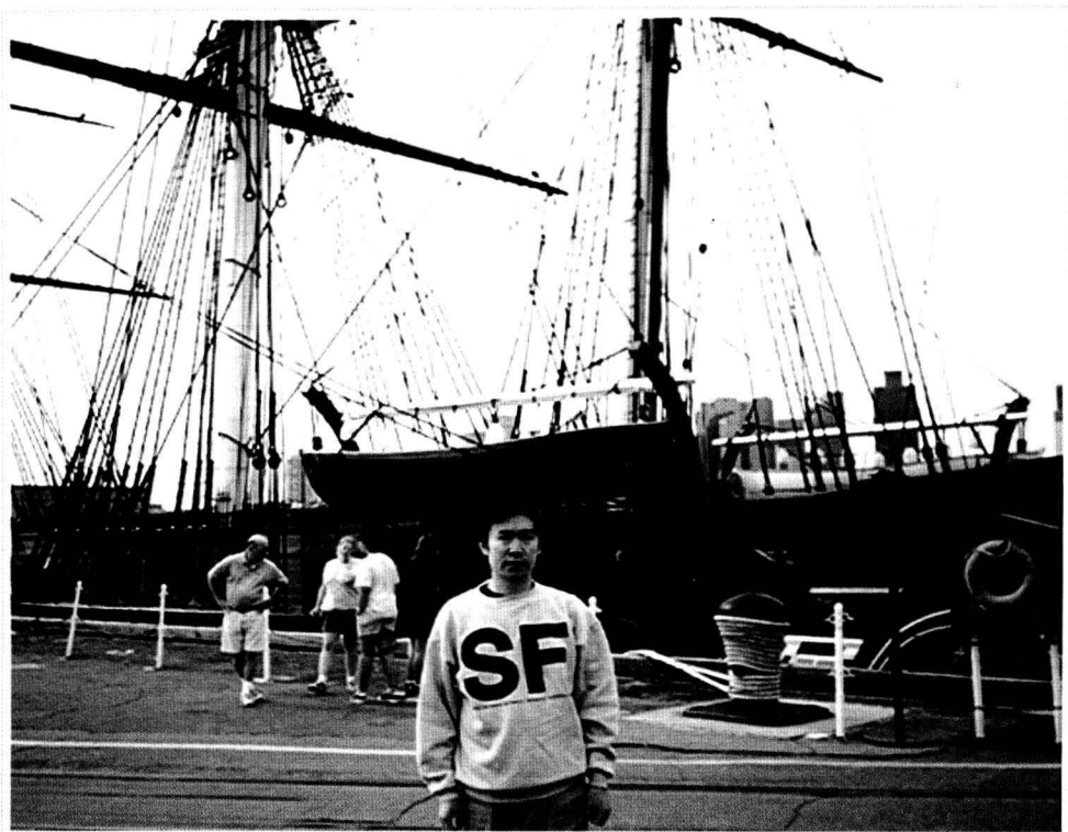
· 1996年，在美国费城 ·