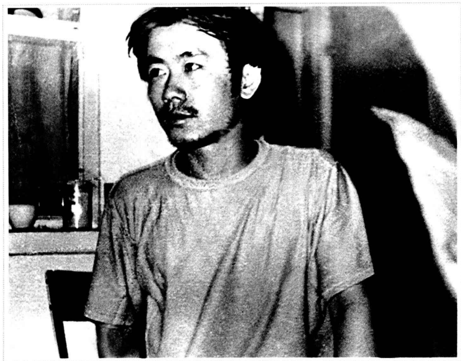
· 1983年，在胶东半岛 ·