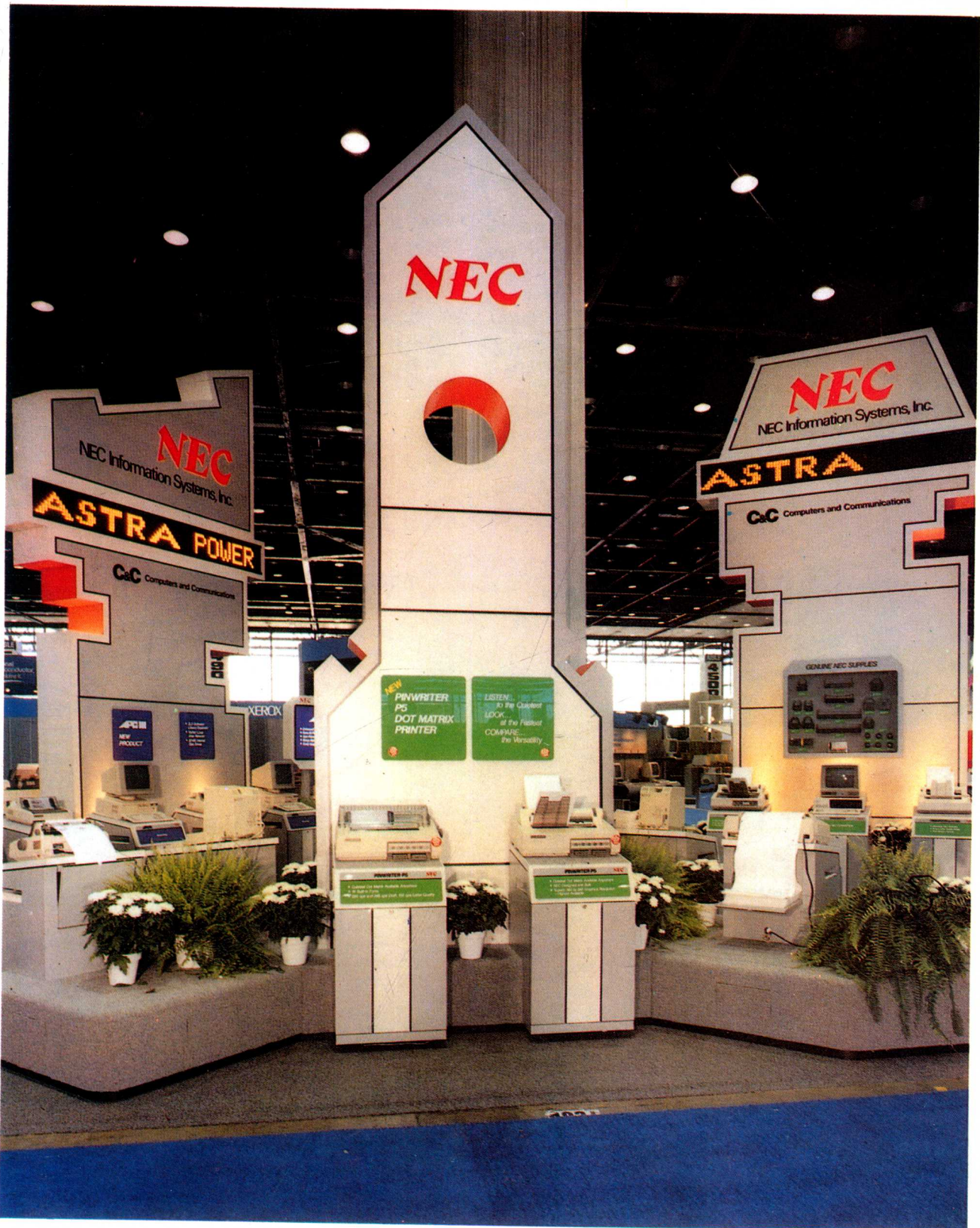
为吸引人们的注意，设计者采用了三个塔状展览牌。