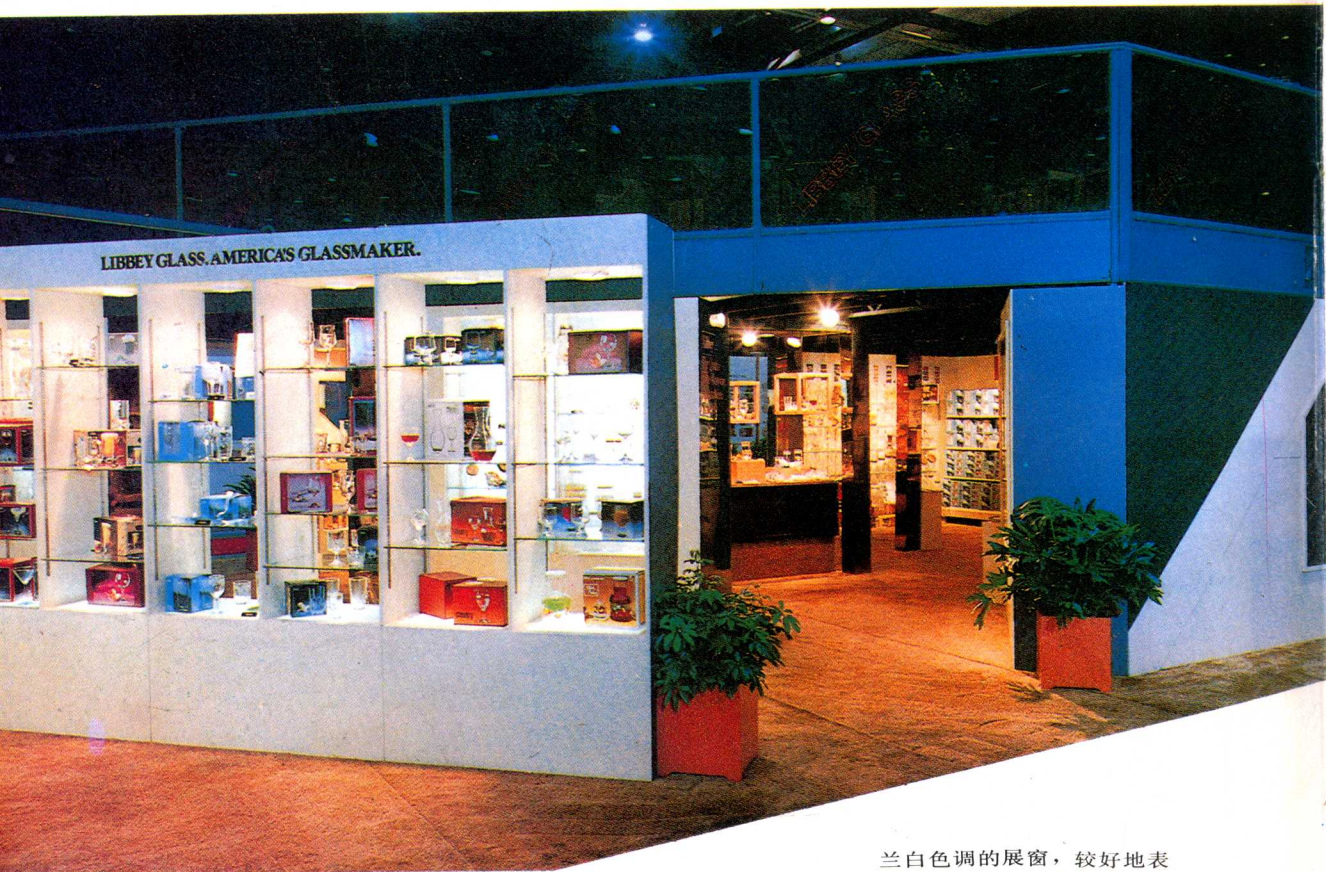
兰白色调的展窗，较好地表现了玻璃制品的纯洁透明感。