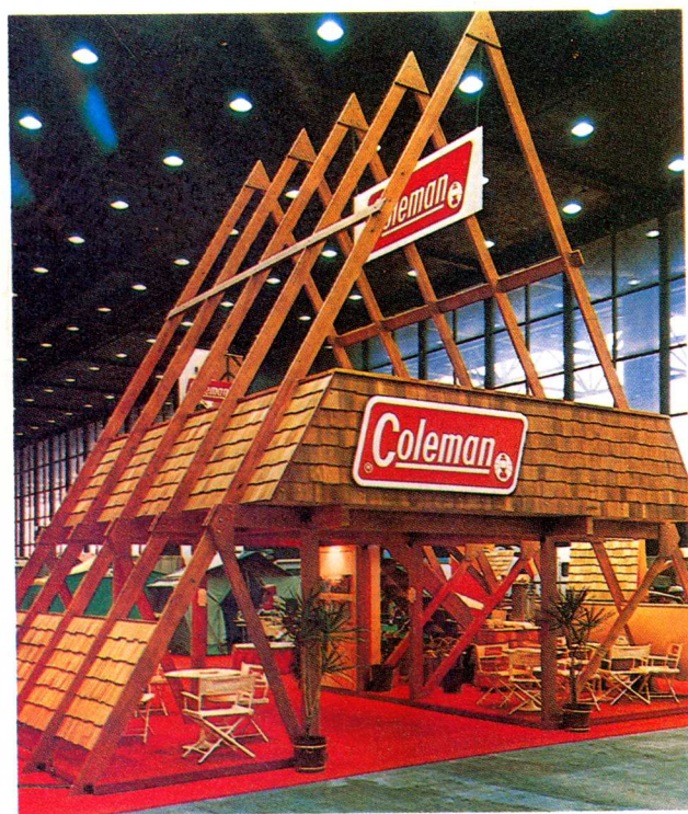
这一生动的室外展览，以地方乡土结构为特点，8米高，二层设有洽谈室。