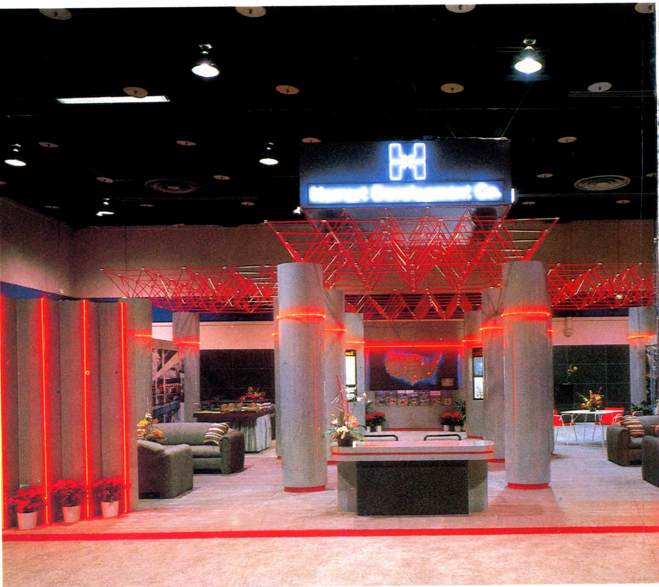
红色桁架、霓虹灯以及光亮华丽的兰灰色被组织在一起，产生了一个优美的高技术展览空间。