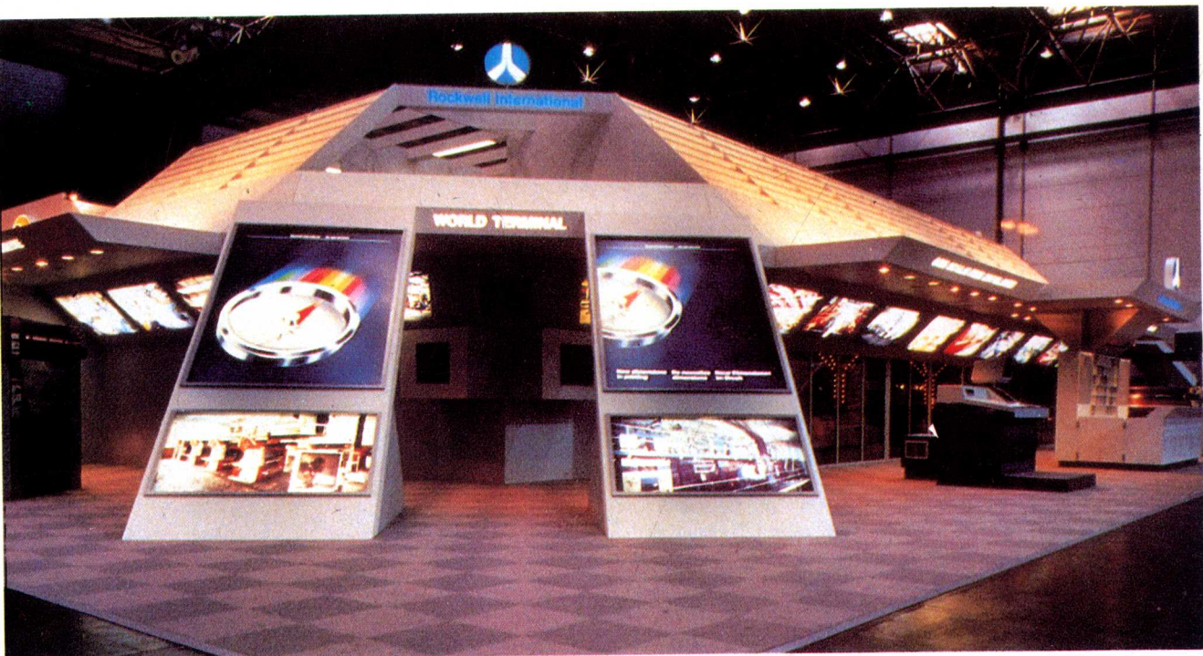
在这个形似UFO的构架中，Rockwell公司再次显示了技术先进的地位。