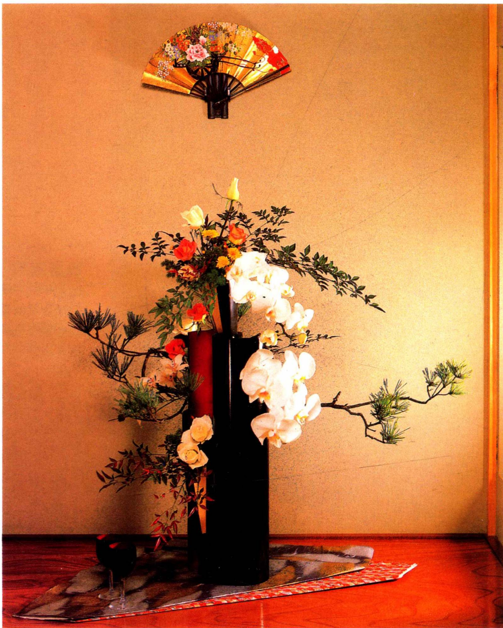
花材/蝴蝶蘭、松、南天竹 、雛菊

新年是不可缺少花的。黑色和橘紅色的格調高雅的花盒上，插豪華的蝴蝶蘭、南天竹、松樹，將整個新春的喜氣襯托出來。裝飾用的扇子或扇形小花器，則洋溢了喜氣感。