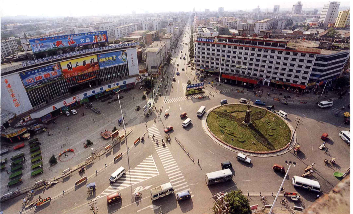
市区文化中心处交通广场