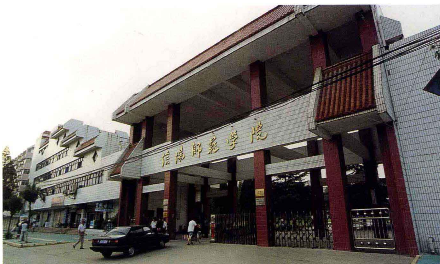
信阳师范学院外景