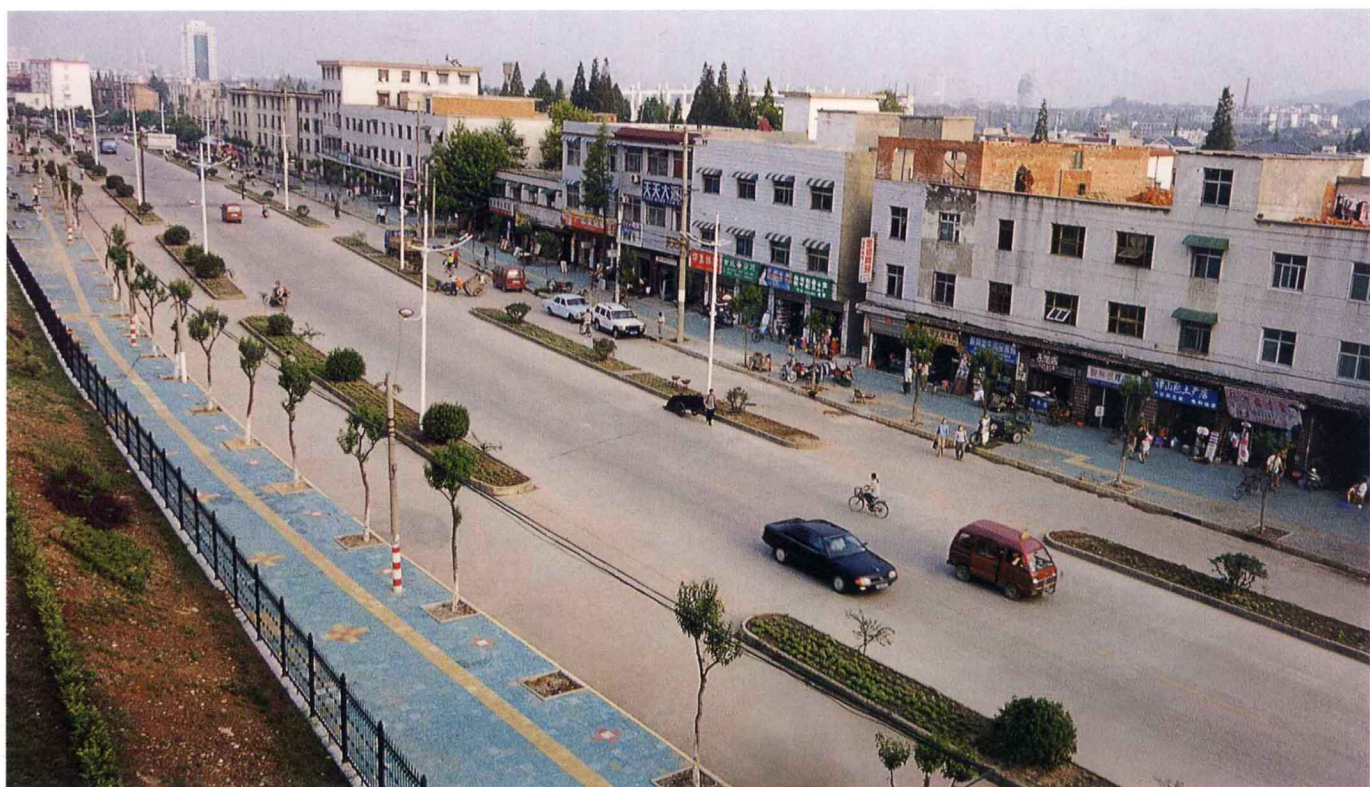
新拓宽的南湖路中段