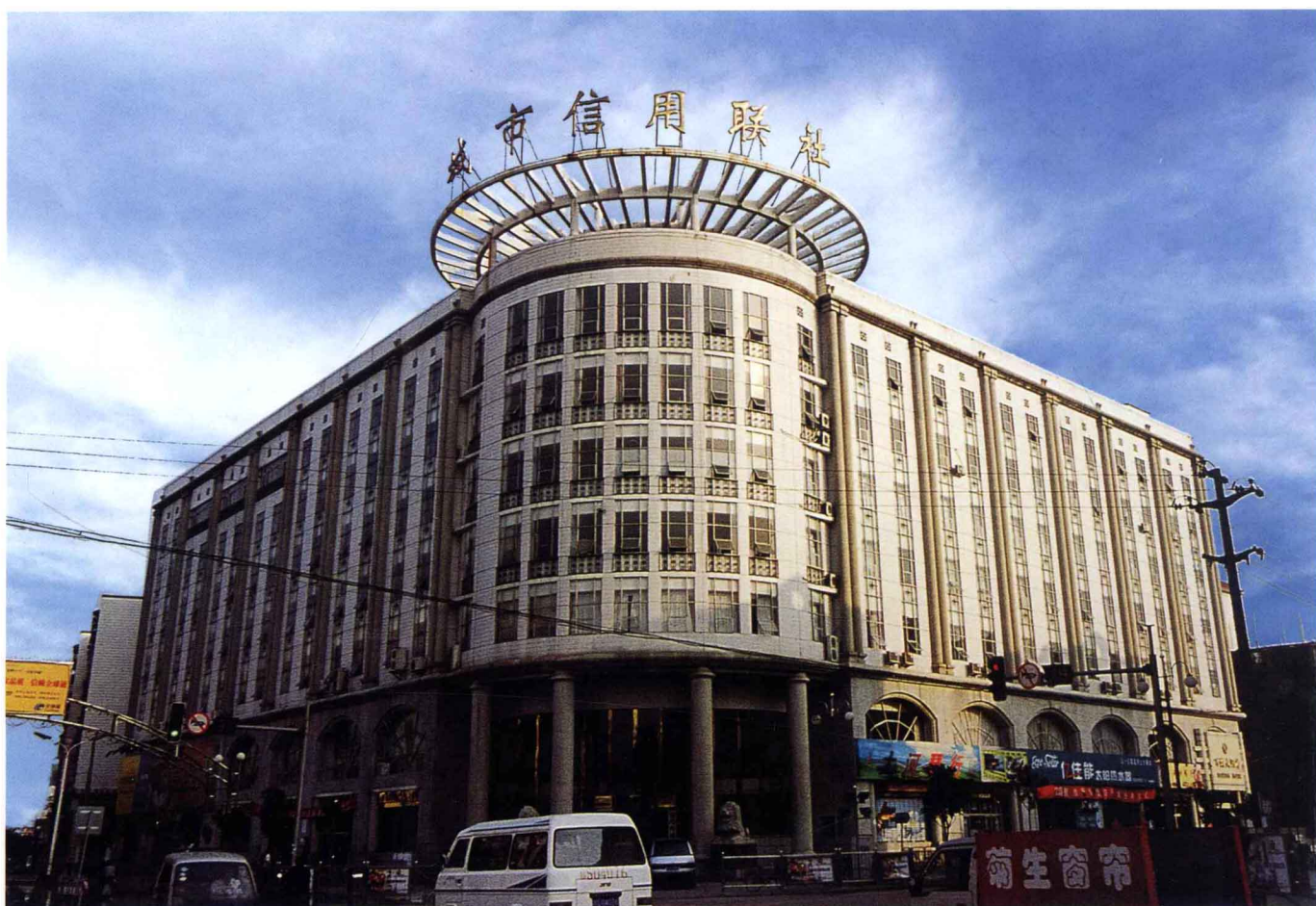
市城市信用联社大厦