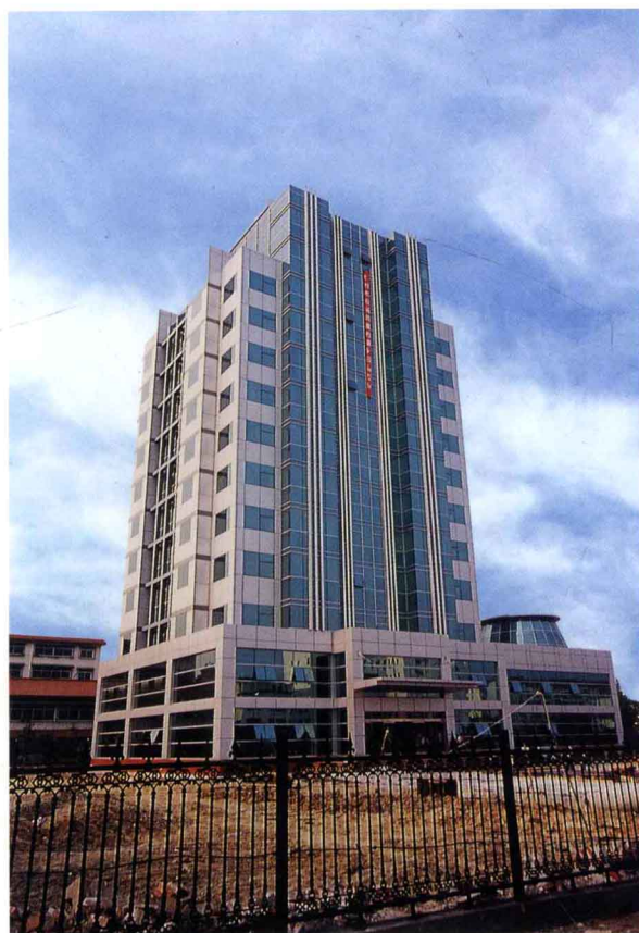
市公路管理局大厦