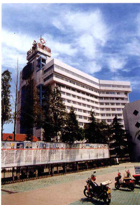
市中心人民医院大厦