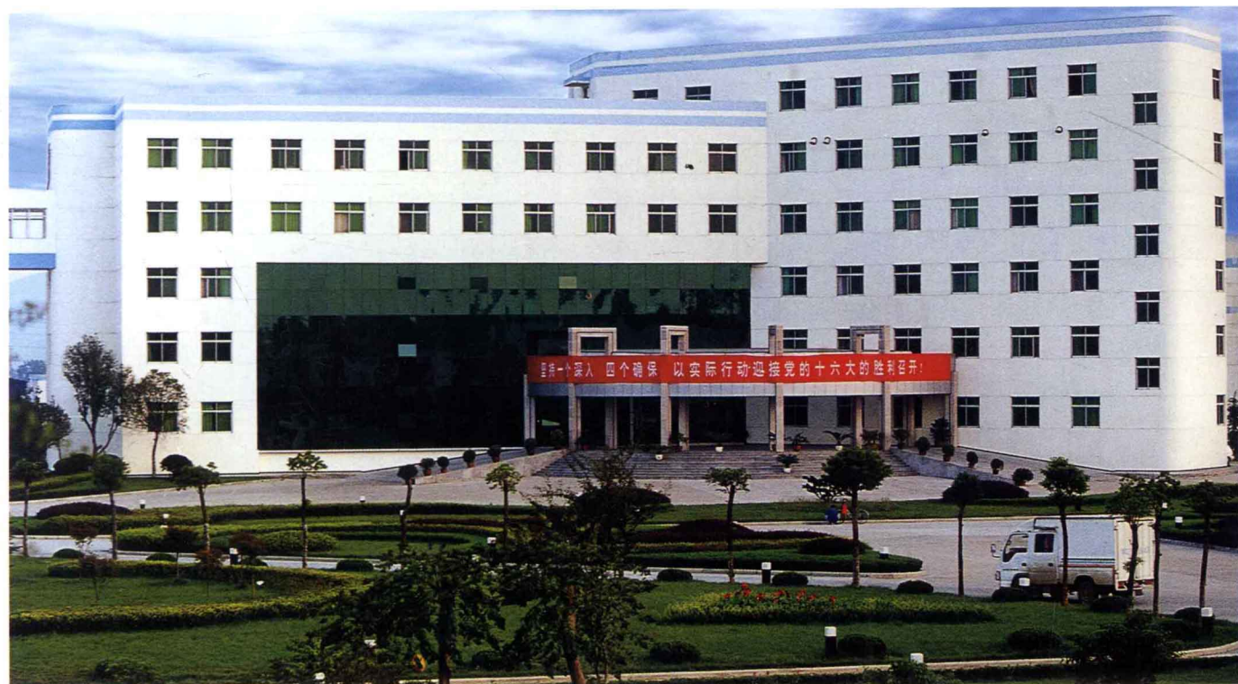
华豫电厂办公大楼