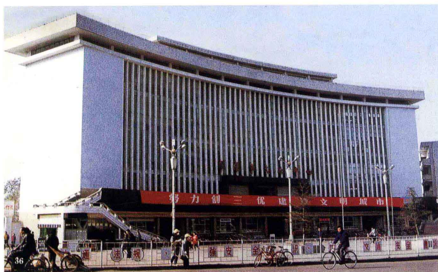
信阳市文化中心大厦