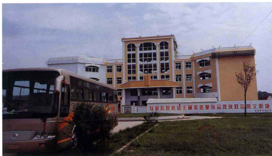
信阳职业高中新建的教学楼