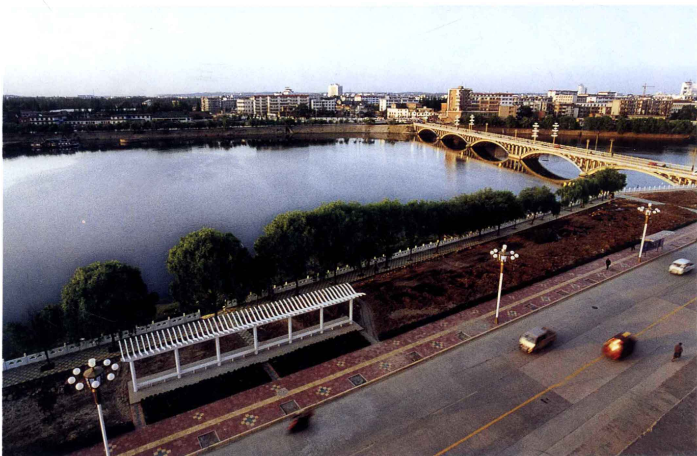
浉河南岸华夏路一角