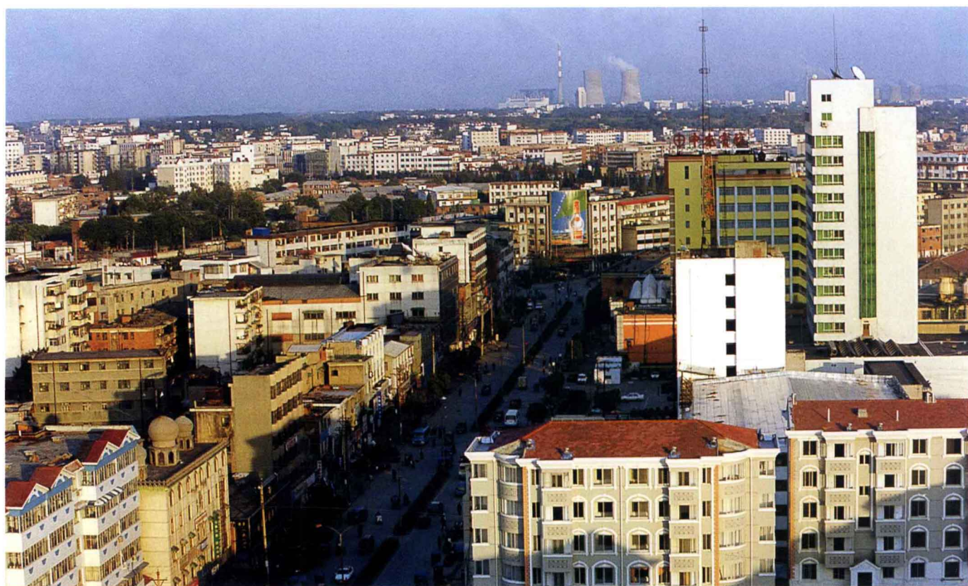
人民路商住楼群林立