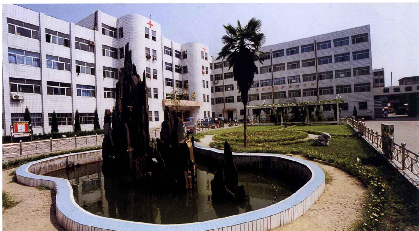
信阳卫校附属医院