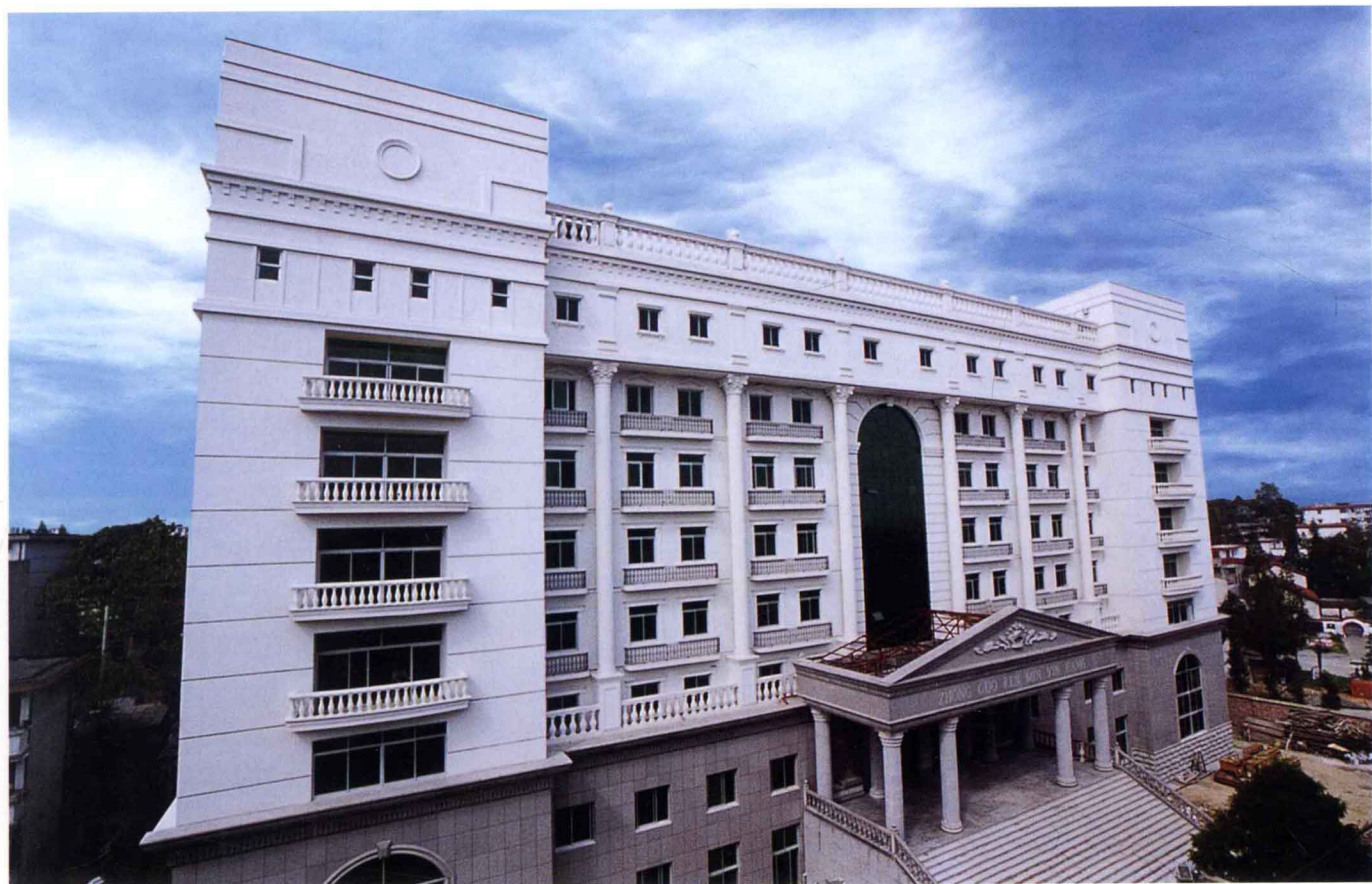
中国人民银行市支行大厦