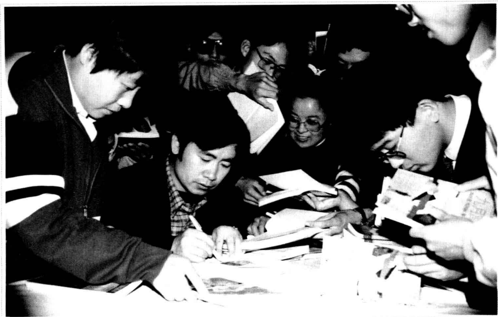
· 1993年，在烟台大学 ·