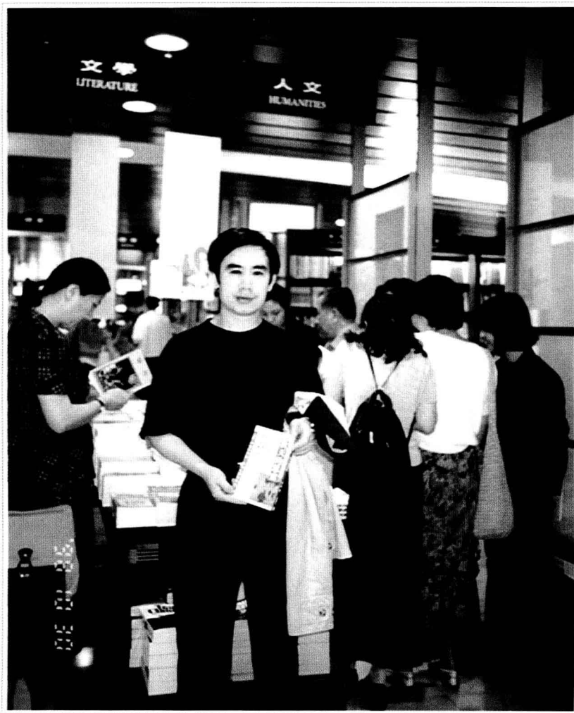
· 1998年，在台湾诚品书店 ·