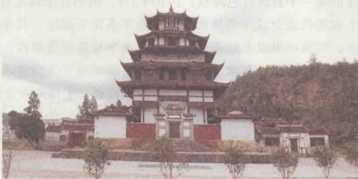
中共闽西“一大”旧址——上杭蛟洋文昌阁