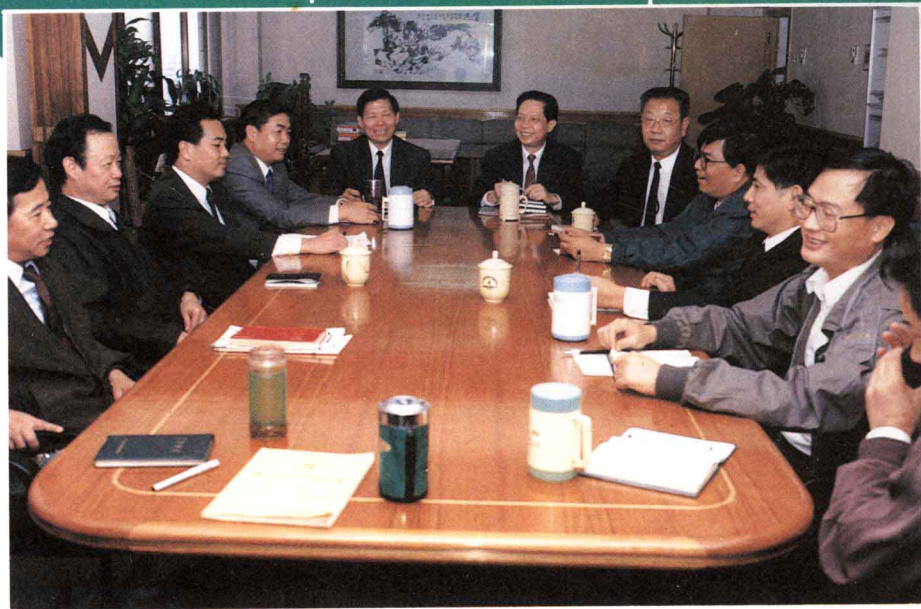
领导班子成员在研究、交流工作