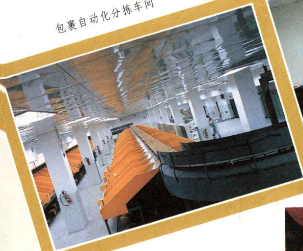
包裹自动化分拣车间