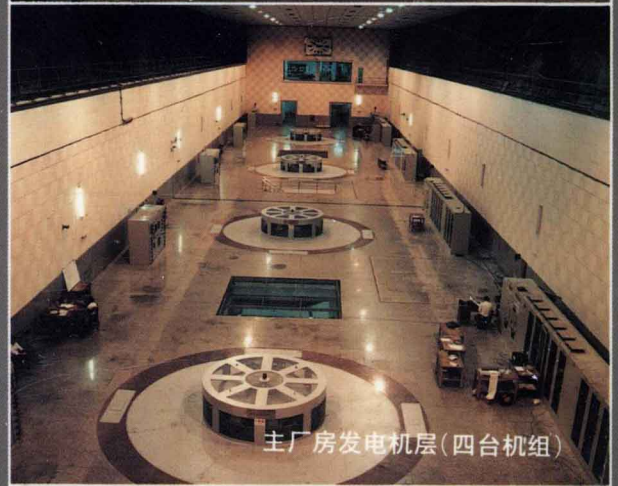
主厂房发电机层(四台机组)