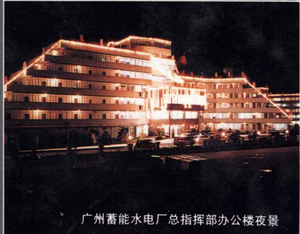
广州蓄能水电厂总指挥部办公楼夜景