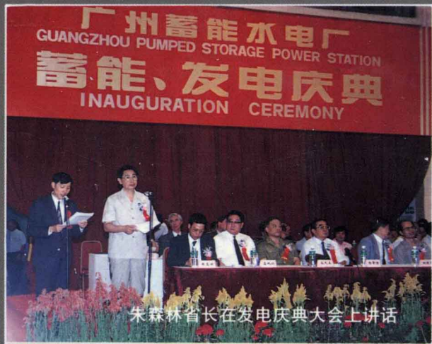
朱森林省长在发电庆典大会上讲话