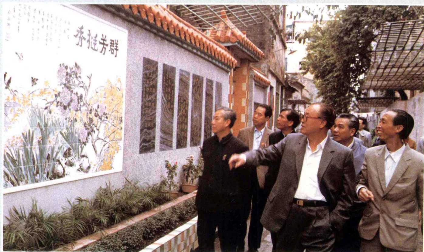
▲ 1986年春節期間，趙紫陽同志視察廣州市南華西街。