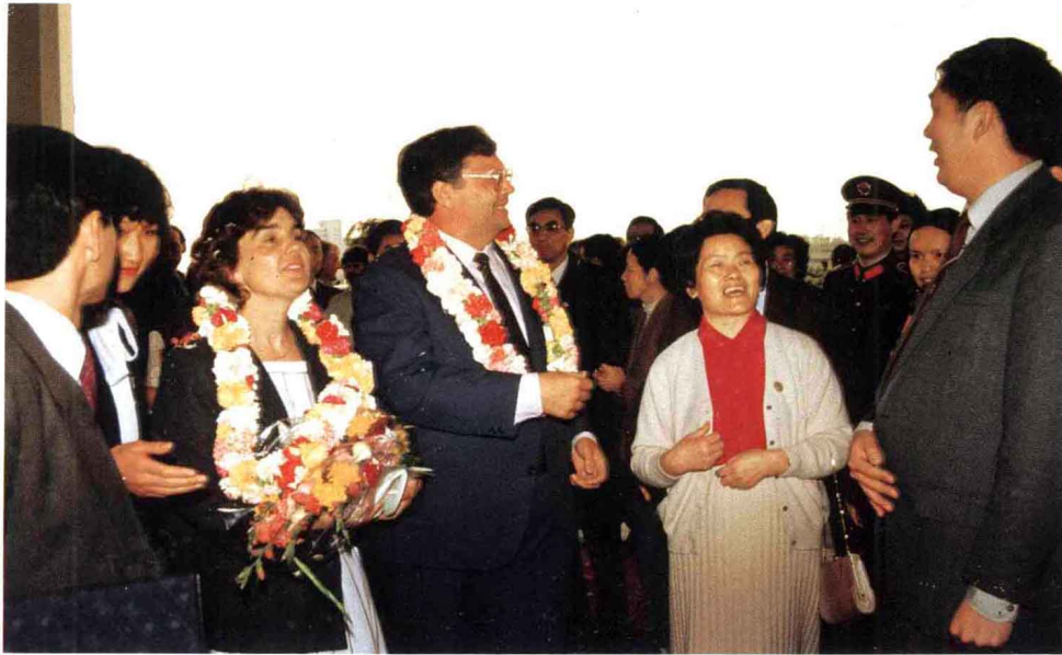
◀ 1986年3月23日，新西蘭總理戴維·朗伊和夫人訪問廣東省。