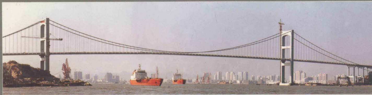
全国第一座现代大跨度悬索桥——汕头海湾大桥