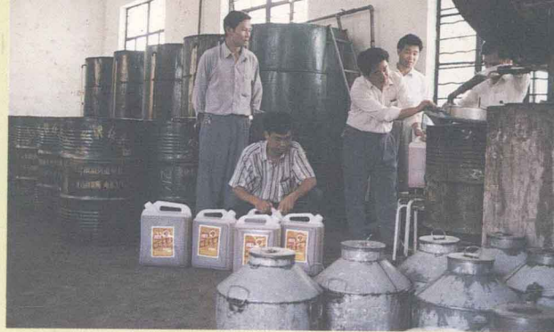
该所加工的“荔香牌”花生油，是茂名石油化工公司指定供应的生活用油。图为花生油厂的过滤设备