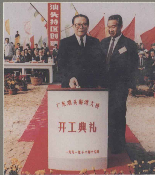
1991年12月17日，江泽民总书记参加汕头海湾大桥开工典礼