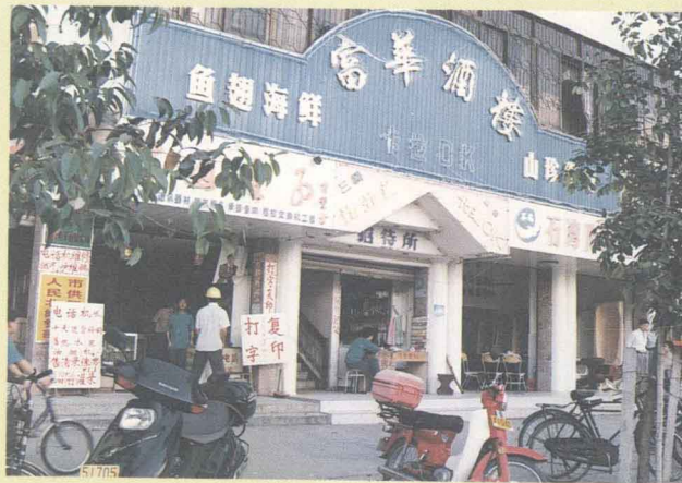
在市区兴办的实业之一——富华酒楼