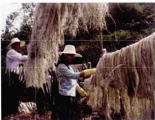
苎麻纤维