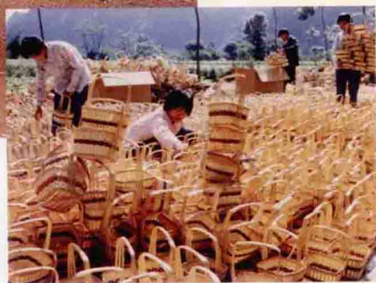
竹编工艺品