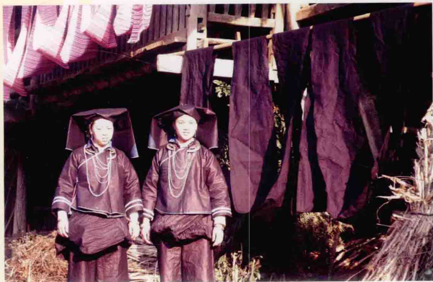
壮族妇女用蓝靛染布