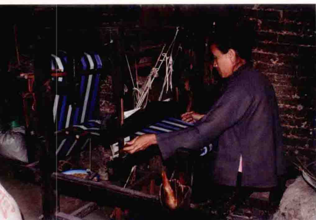
织布 (李桐 摄)