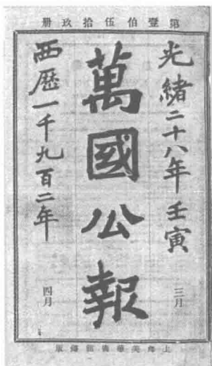
政论型报纸的代表——《万国公报》