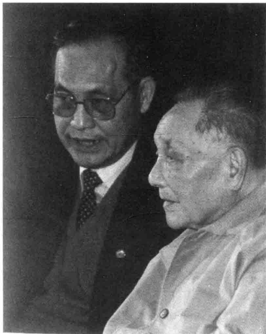
1992年，李灏陪同邓小平在深圳

1981年，广东、福建两省会议和经济特区工作会议在北京召开，中央各有关部委的负责同志出席，周建南、江泽民协助谷牧主持会议。这次会议制定了中央（81）27号文件，对经济特区的重大政策做了较全面的规