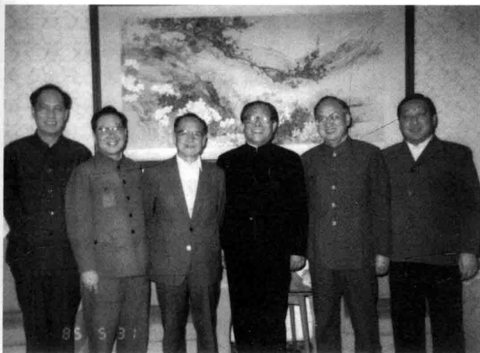
1985年5月31日，李灏与原进出口委领导班子部分成员合影。从左到右：李灏、魏玉明、谷牧、江泽民、周建南、李岚清