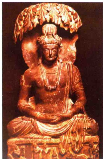
📍 《樹下觀耕》▪ 古犍陀羅 ▪ 西元二世紀

個人的風格 (Individual Style) 就是藝術家個人獨特的風格。同樣是二十世紀初期的西班牙畫家，畢卡索 (Pablo Picasso) 和達利 (Salvador Dalí) 的風格就截然不同。畢卡索是立體派 (Cubism) 的創始人之一，他的作品深受非洲原始藝術的影響，他把自然物形的輪廓打破，用線條結合成部分的畫面，然後再依照自己的意思構成立體圖形。達利是超寫實畫派 (Surrealism) 的健將，他擷取心理學家佛洛伊德 (Sigmund Freud) 有關