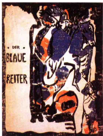
《藍騎士》年鑑封面 ■ 木版畫 ■ 康丁斯基 ■ 1911年

一件好的藝術作品，內容和形式是相輔相成的，創作者由選定的主題表現出內容的意涵，從內容思考出適切的表現形式，一個好的創作者，在作品的內容和形式之間，一定有著微妙的互動。