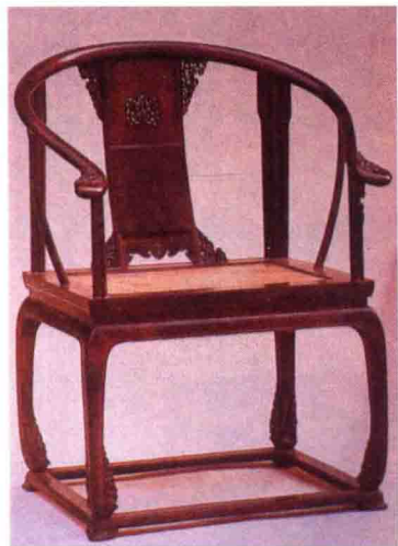
清 ■ 紫檀木圈椅

選定材質後，作者要決定表現內容的主題。如果想要畫一幅傳統的水墨畫，那麼想要創作的是山水畫、花鳥畫、還是人物畫？選定以花鳥為題材時，要畫那一種