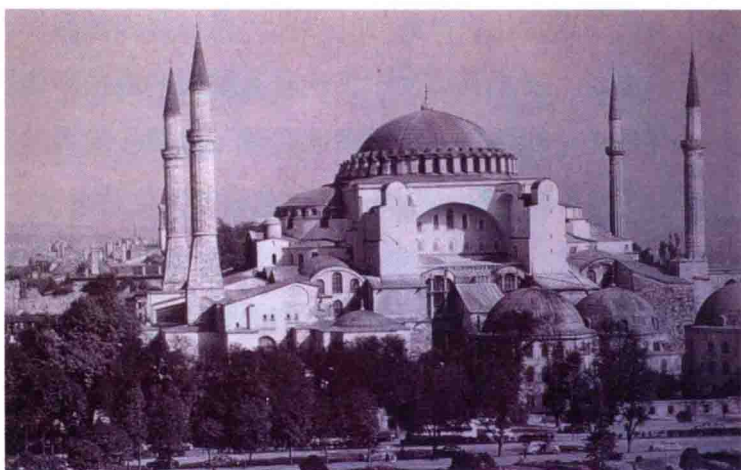
↑ 土耳其 ▪ 聖蘇菲亞教堂 ▪ 拜占庭式建築