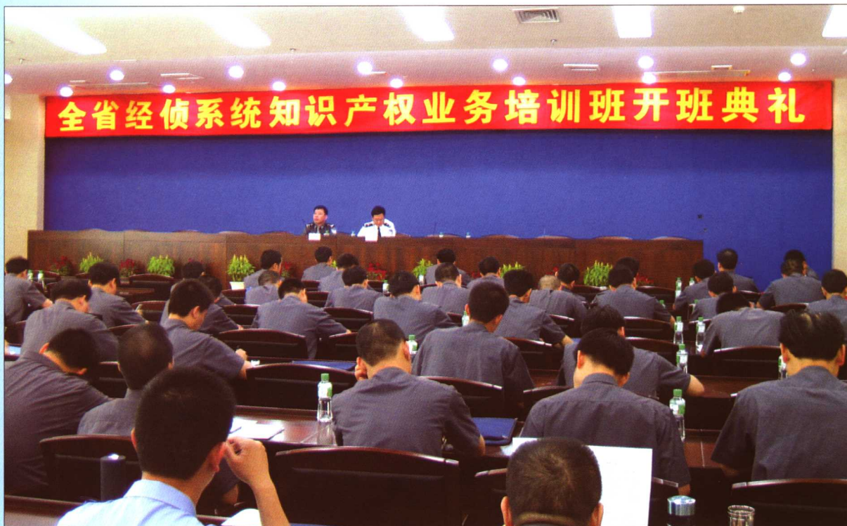
2005年7月5日,广东省公安机关举办知识产权业务培训