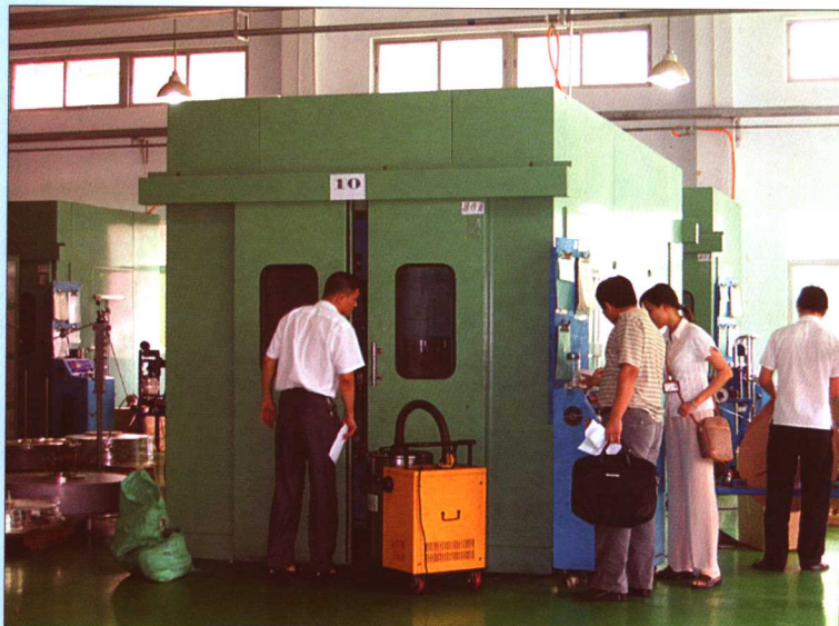
2005年9月2日，广东省知识产权局、东莞市知识产权局执法人员到东莞某企业进行专利行政执法勘验检查