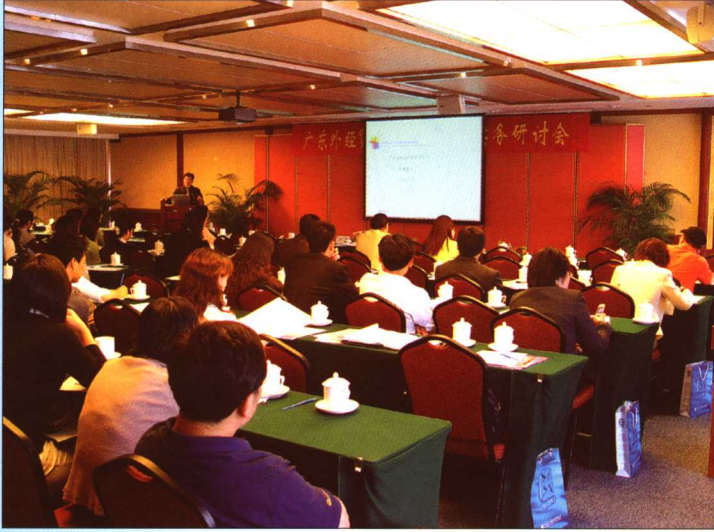
2005年4月20日，广东知识产权保护协会在白云宾馆举办“广东外经贸知识产权实务研讨会”