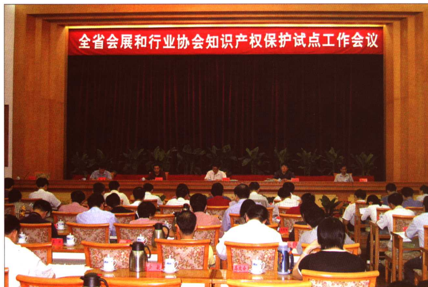
2005年9月27日,“全省会展和行业协会知识产权保护试点工作会议”在广州召开