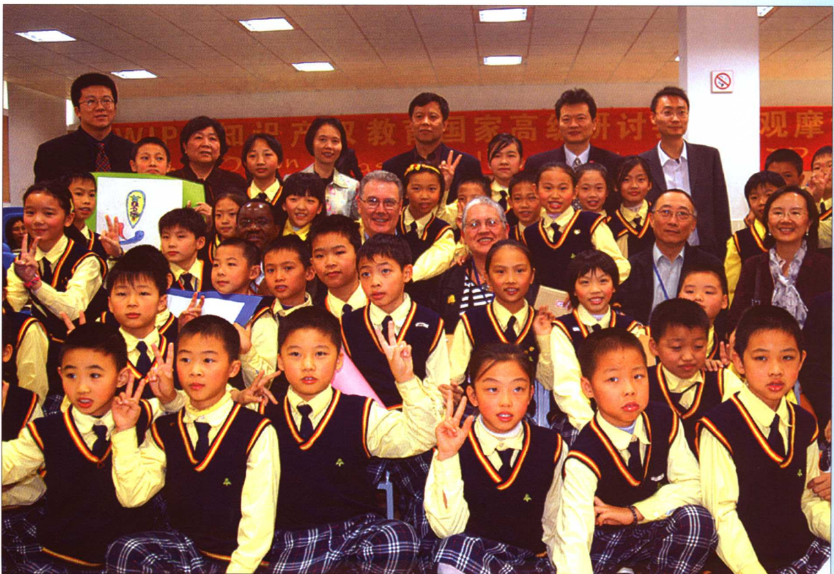
2005年11月22日,WIPO组织的专家现场观摩佛山市南海区小学知识产权课堂