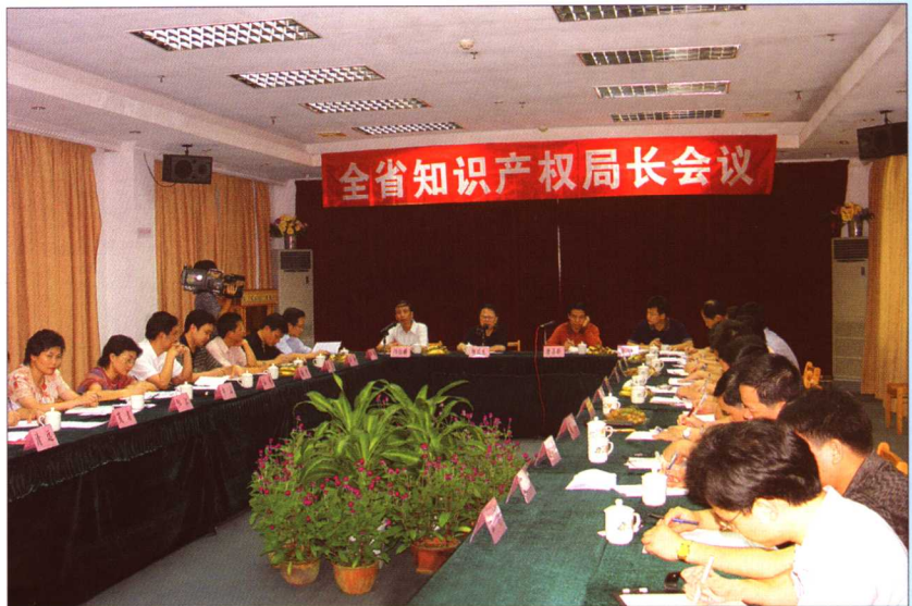
2005年6月15日,全省知识产权局长会议在湛江召开