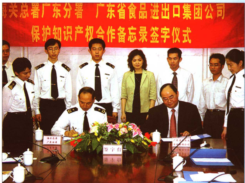
2005 年 4 月 26 日，海关总署广东分署与广东省食品进出口集团公司保护知识产权合作备忘录签字仪式现场