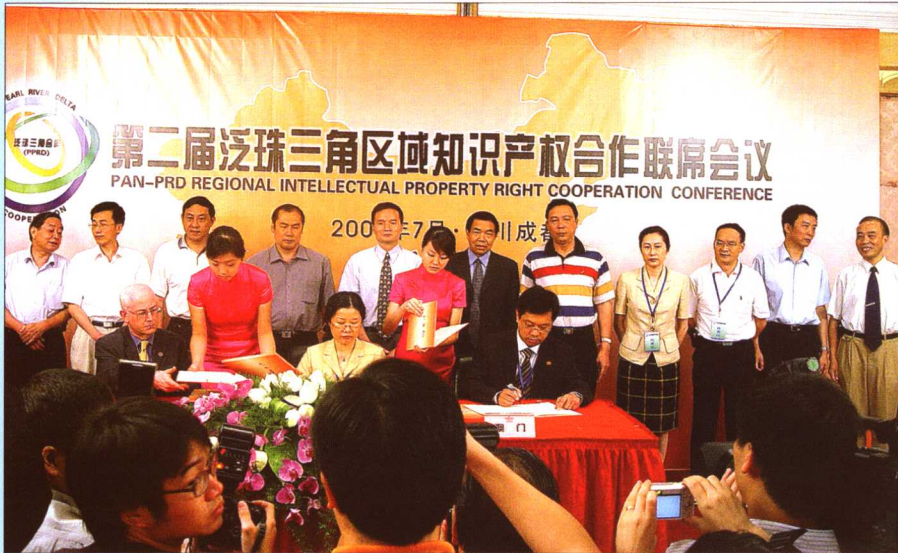
2005年7月26日，“第二届泛珠三角区域知识产权合作联席会议”在成都召开

2005年7月，泛珠三角区域各省、自治区工商行政管理局商标管理部门在广西南宁召开“泛珠三角区域商标保护工作会议”