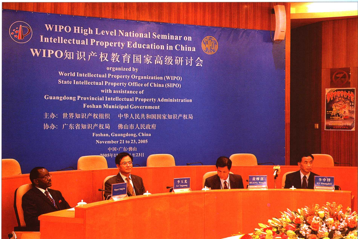
2005年11月21日，“WIPO 知识产权教育国家高级研讨会”现场