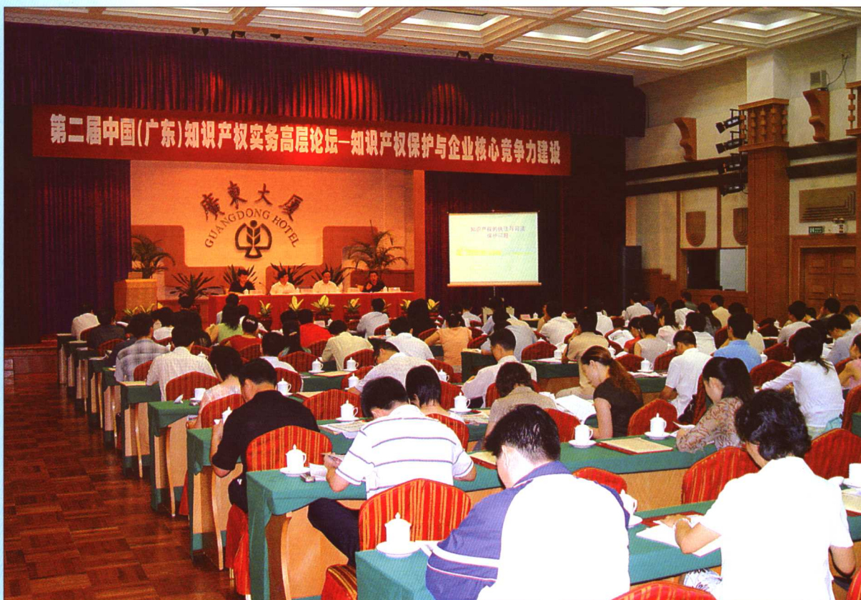
2005年9月16日,“第二届中国(广东)知识产权实务高层论坛——知识产权保护与企业核心竞争力建设”在广州举行,最高人民法院知识产权庭庭长蒋志培等应邀出席并作了演讲