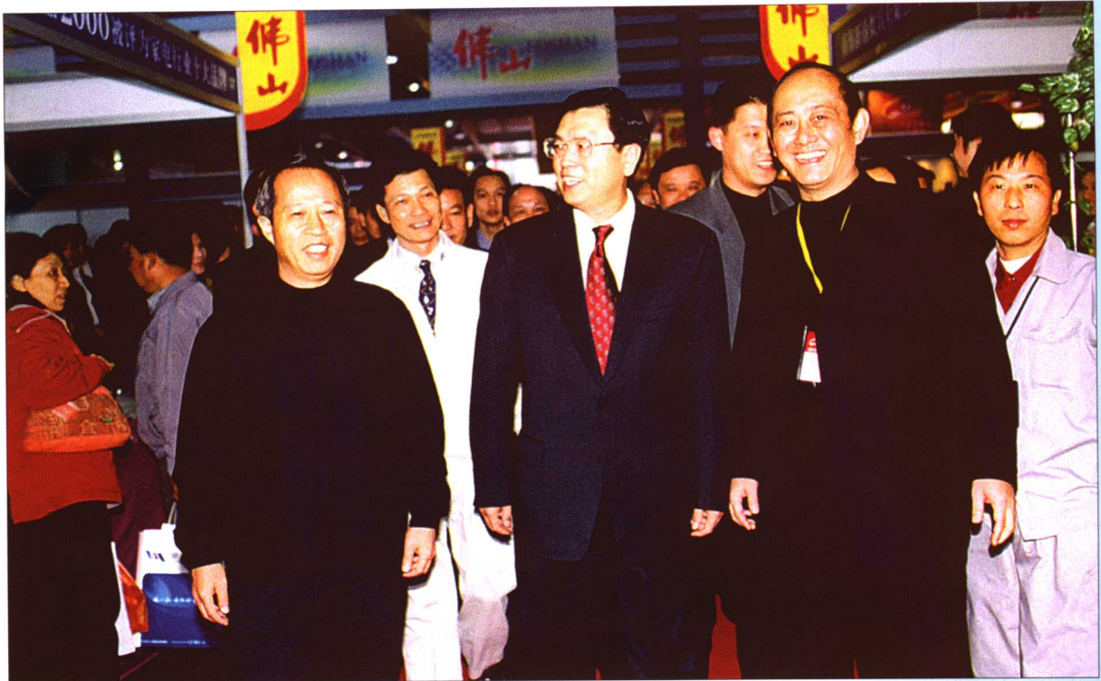
2005年9月14日,中共广东省委书记张德江(左二)在广东省工商行政管理局党组书记、局长吕成贤(左一)陪同下视察“第二届中国中小企业博览会”