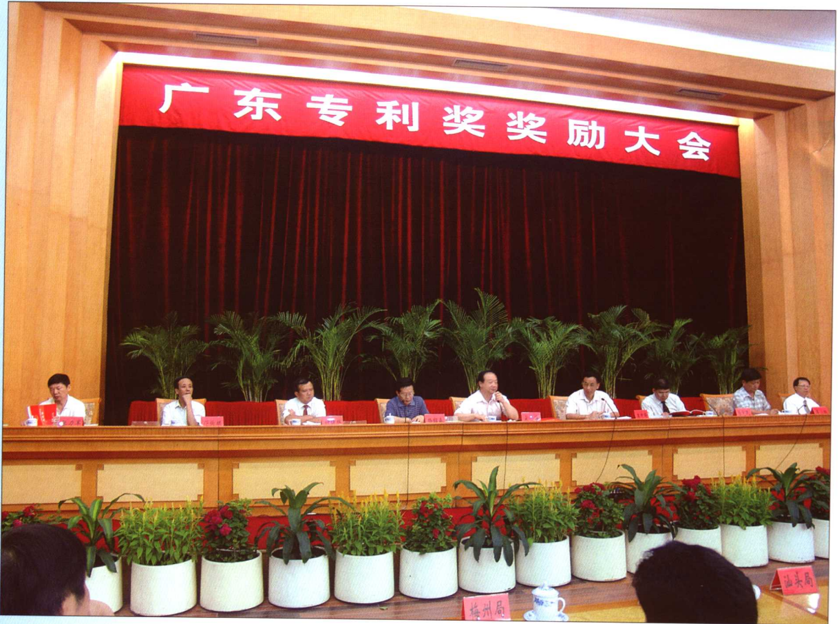
2005年7月5日，广东省副省长宋海（左五）出席2005年广东专利奖奖励大会并作重要讲话