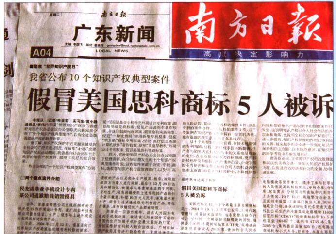
2005 年 4 月 26 日，广东各主要媒体发布广东省 10 个知识产权典型案例