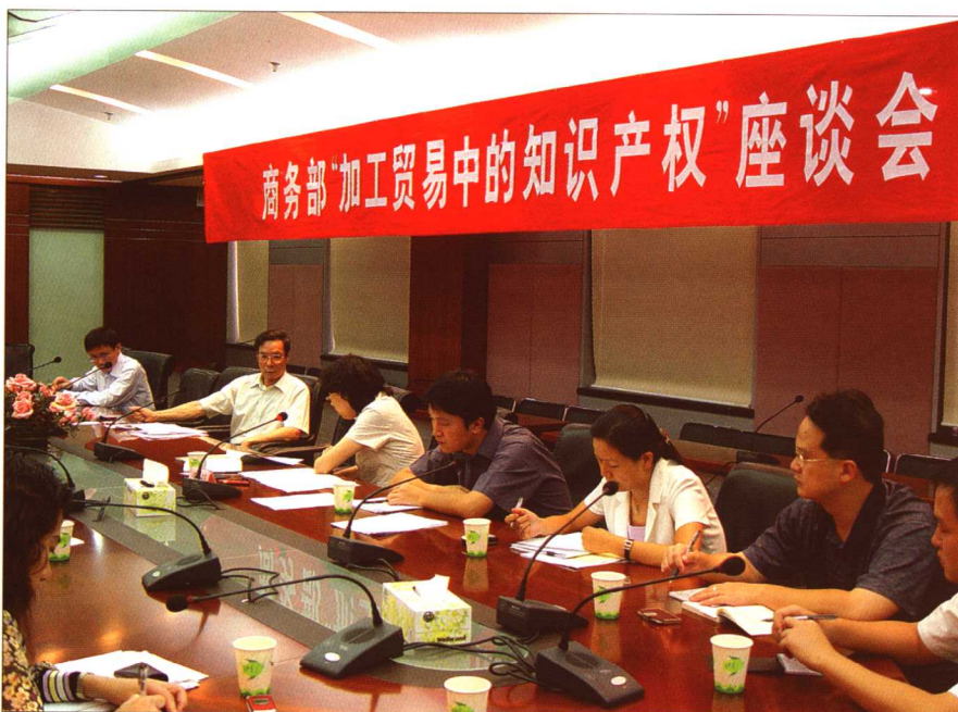
2005年9月26日，商务部“加工贸易中的知识产权”座谈会在广州召开