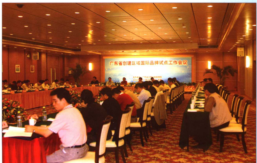
2005年11月3日,广东省工商行政管理局在东莞市召开“广东省创建区域国际品牌试点工作会议”