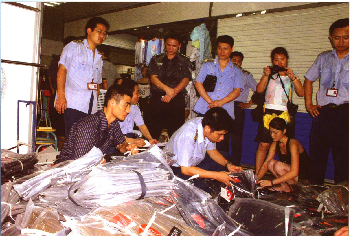
2005年,广东省开展了商标专用权专项保护行动。图为保护商标专用权执法现场