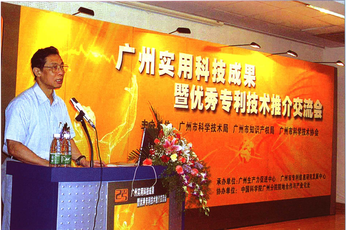
2005年5月25日,钟南山院士在“广州实用科技成果暨优秀专利技术推介交流会”上致辞