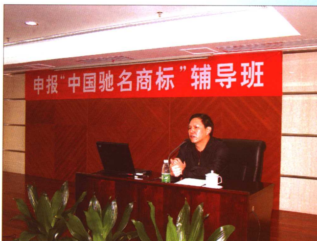
2005年4月14日，广东省工商行政管理局和广东省商标协会在广州举办申报“中国驰名商标”辅导班