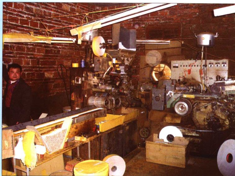
2005年11月22日，韶关市翁源县公安局经侦大队在打假行动中缴获制假烟机