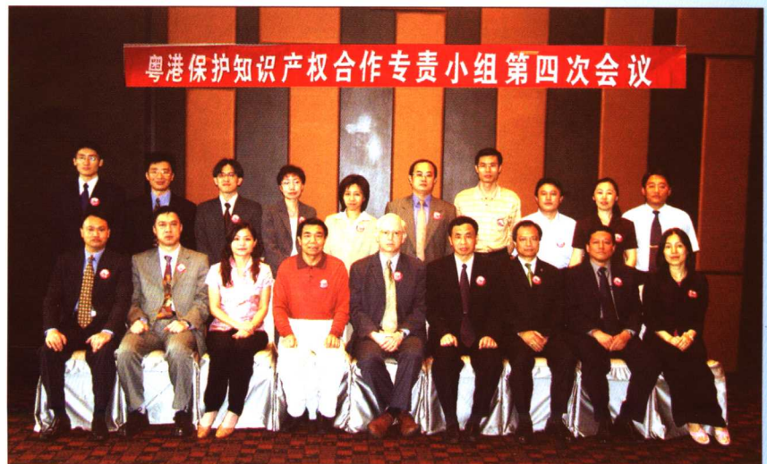
2005年6月24日,“粤港保护知识产权合作专责小组第四次会议”在广州召开