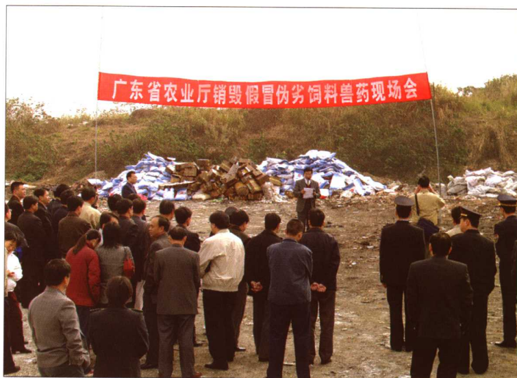
2005年11月，广东省农业厅组织了销毁假冒伪劣饲料兽药现场会