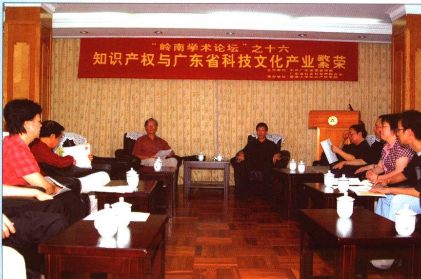
2005年8月23日，第十六期“岭南学术论坛”以“知识产权与广东省科技文化产业繁荣”为题在暨南大学知识产权学院举行研讨活动