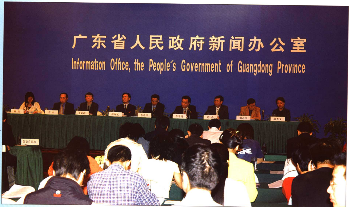
2005年4月20日，广东省人民政府新闻办公室召开“广东省知识产权保护状况发布会”