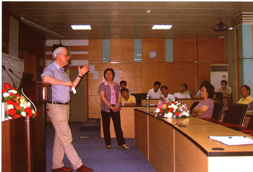
2005年6月9日,香港知识产权署署长谢肃方访问暨南大学知识产权学院并作了演讲