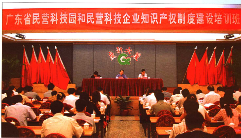
2005年9月25日，广东省民营科技园和民营科技企业知识产权制度建设培训班在广州开讲