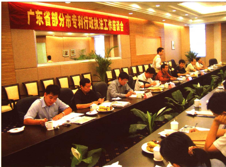
2005 年 5 月 24 日，“广东省部分市专利行政执法工作座谈会”在东莞市召开