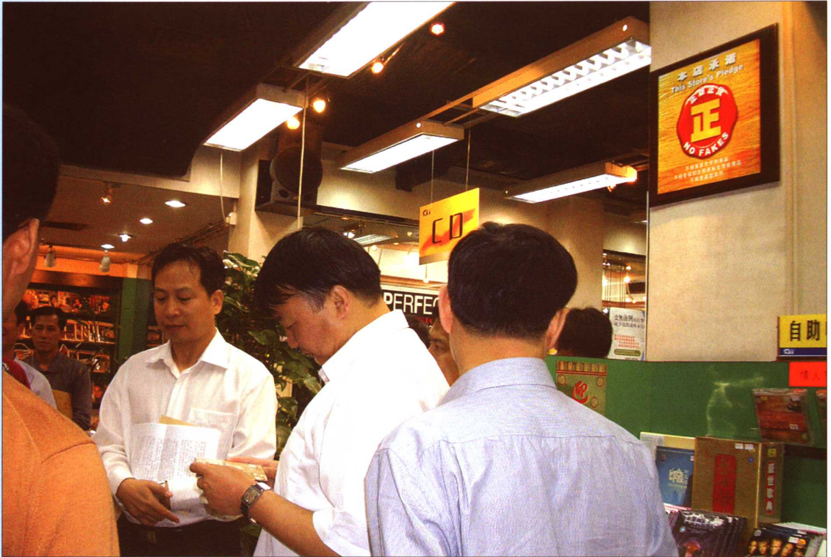
2005年11月29-30日,国务院保护知识产权专项行动督察组检查广东省的音像市场