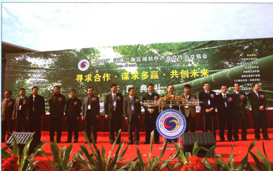
2005年12月8日，泛珠三角区域软件产业合作与交易会在珠海南方软件园开幕