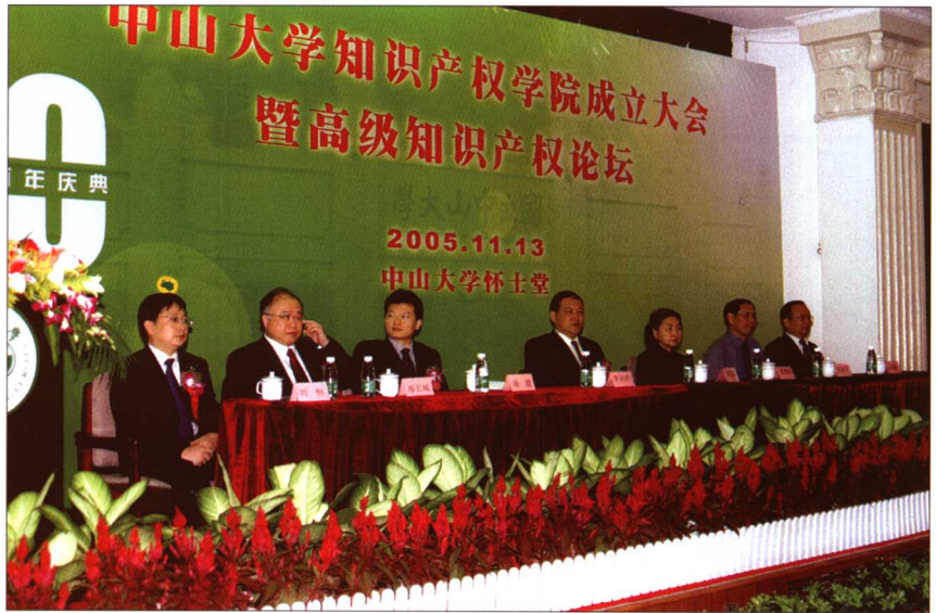
2005年11月13日，“中山大学知识产权学院成立大会暨高级知识产权论坛”在中山大学举行