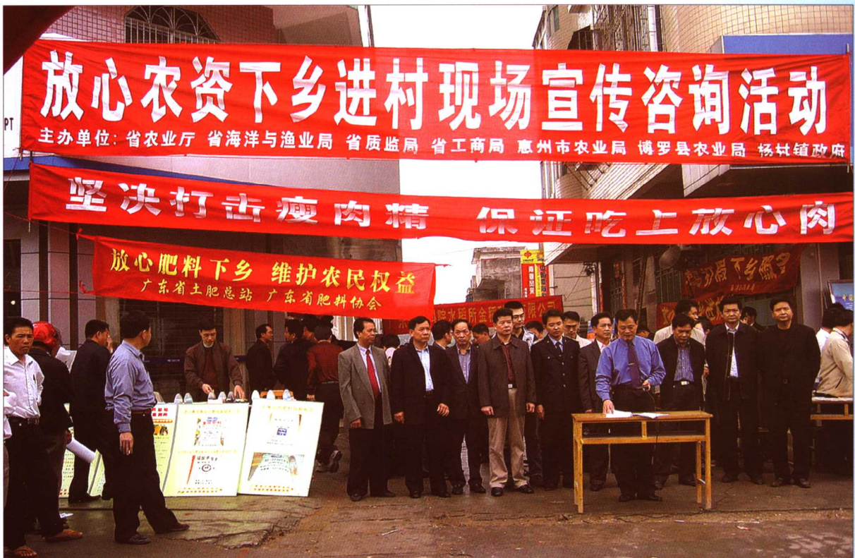
2005年3月11日,广东省农业厅、省海洋与渔业局、省质量技术监督局、省工商行政管理局等单位组织“放心农资下乡进村”现场宣传咨询活动