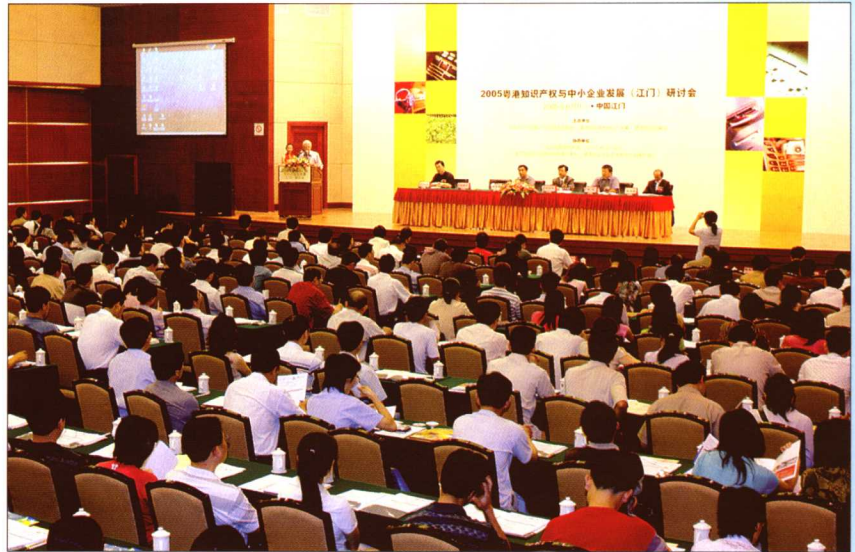
2005年6月9日,粤港两地的知识产权管理部门在江门市召开“2005 粤港知识产权与中小企业发展(江门)研讨会”