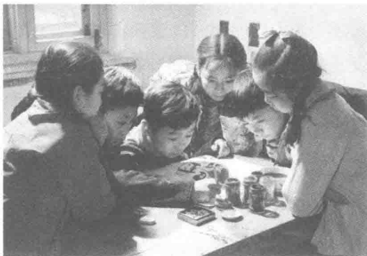
戏曲特色美育活动——画脸谱（1960年）

1982年《宪法》明确规定：“发展社会主义的教育事业，提高全国人民的科学文化水平。”“培养青年、少年、儿童在品德、智力、体质等方面全面发展。”“为社会主义服务的各种专业人才。”该培养目标是通过教育培养建立一定的社会道德准则，提高认识、理解客观事物并运用知识、经验等解决问题的能力和社会、对他人、对周围事物表现