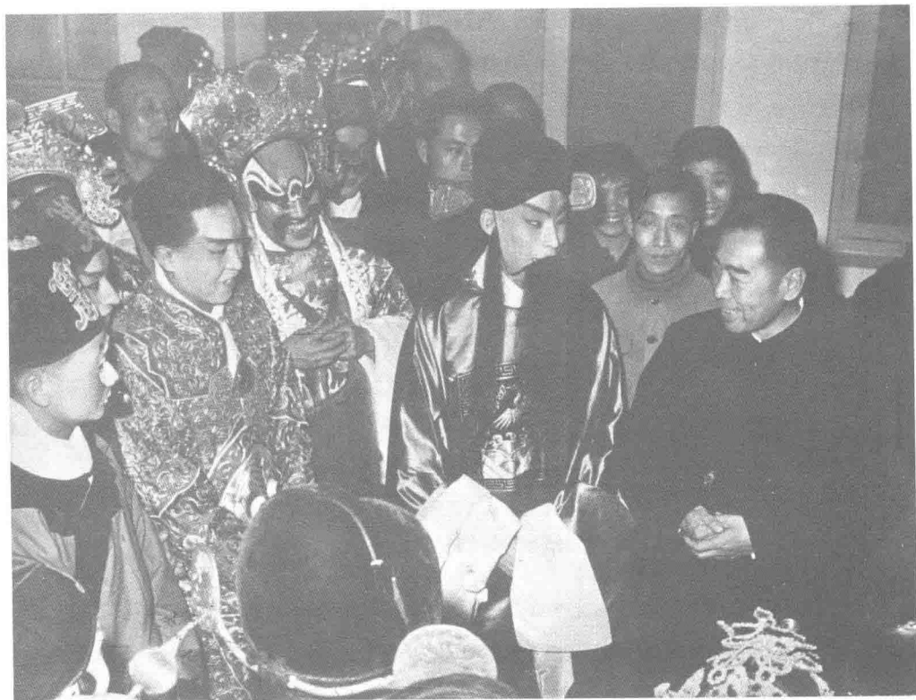
周恩来看望中国戏曲学校学生（1961年）

1958年9月，中共中央、国务院在《关于教育工作的指示》中提出：党的教育工作方针，是教育为无产阶级的政治服务，教育与生产劳动相结合。教育是改造旧社会和建设新社会的强有力的工具之一。所谓共产主义全面发展的新人，就是既有政治觉悟又有文化的、既能从事脑力劳动又能从事体力劳动的人。新中国教育的目的，就是培养有社会主义觉悟的有文化的劳动者。其所提出的教育目的和培养目标纠正了当时“为教育而教育”和“劳心与劳力分离”的一些观点，“正确地解释了‘全面发展’的含义”。“教育与生产劳动相结合”对于戏曲教育而言是可行的，因为艺术教育 with 艺术创作生产相结合的“前店后厂”的教育模式，是戏曲传统教育的一大特点，进一步强调教育与生产劳动相结合的培养目标，所推动的则是专业教育、艺术创作生产和一般性社会劳动相结合，一方面加强戏曲教育和戏曲艺术生产劳动相结合，定期对外、下乡、下工厂演出为工农兵服务，从某种意义上讲既是对过度强调学生知识的全面性，从而忽视专业训练实践的一种调整，也是在一定程度上为学生的艺术创作直面社会，增加舞台与社会文化形象素材的积累，对提升人才培养品质起到了积极的作用；另一方面，在校办工厂参