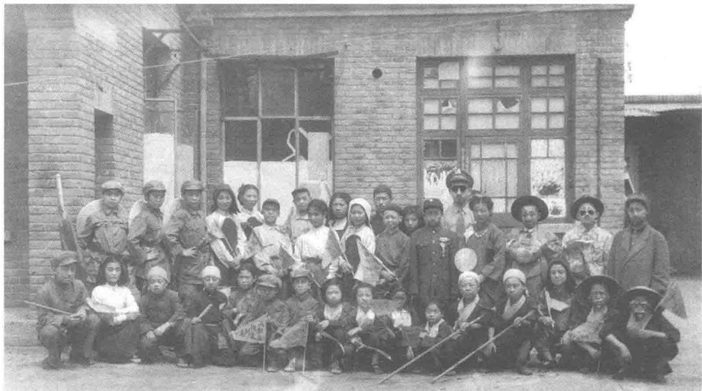
1950年文化部改进局戏曲实验学校第一批学员演出合影

于人民利益人民要求的部分，比如宣传封建思想和其他反革命思想的东西”，而“一些合理的、可以发展的东西就会慢慢地提高、进步，逐渐变成新文艺的组成部分，这一部分就是有前途的，而不是被消灭的了”。也正是基于这样一种指导思想，在《共同纲领》颁布之前，解放区内的戏曲教育就已经开始举办各种戏曲讲习班活动了。如1949年7月22日，上海举办了以京剧和地方戏曲剧种演员、编导等人员227人参加的研究班；8月8日，在北京民主剧院举行开学典礼的戏曲界讲习班，这是一个规模宏大的讲习班，包括京剧和地方戏曲剧种的演员和编导共有450人 1 参加，无论是北京、上海，还是其他地区开展的戏曲教育活动，无一不是围绕着提高政治修养、建立革命的人生观、加强西方艺术理论的学习以及戏曲改革等等，其核心是转变旧有观念，理解和适应新社会的社会制度和为人民服务、为社会建设需要服务的要求。除此之外，新中国之前的戏曲艺人多年从事艺术技术训练和艺术创作工作，大多缺少识字能力的训练，虽然在社会上闯荡多年，拥有丰富的社会文化和艺术文化知识，但是，有相当一部分戏曲艺人不识字，缺少一般意义上国民教育的语文、数学、外语、物理、化学等文化知识。就一个社会人而言，是不全面的。因此，戏曲教育还肩负着普及一般性文化知识，特别是提高戏曲艺