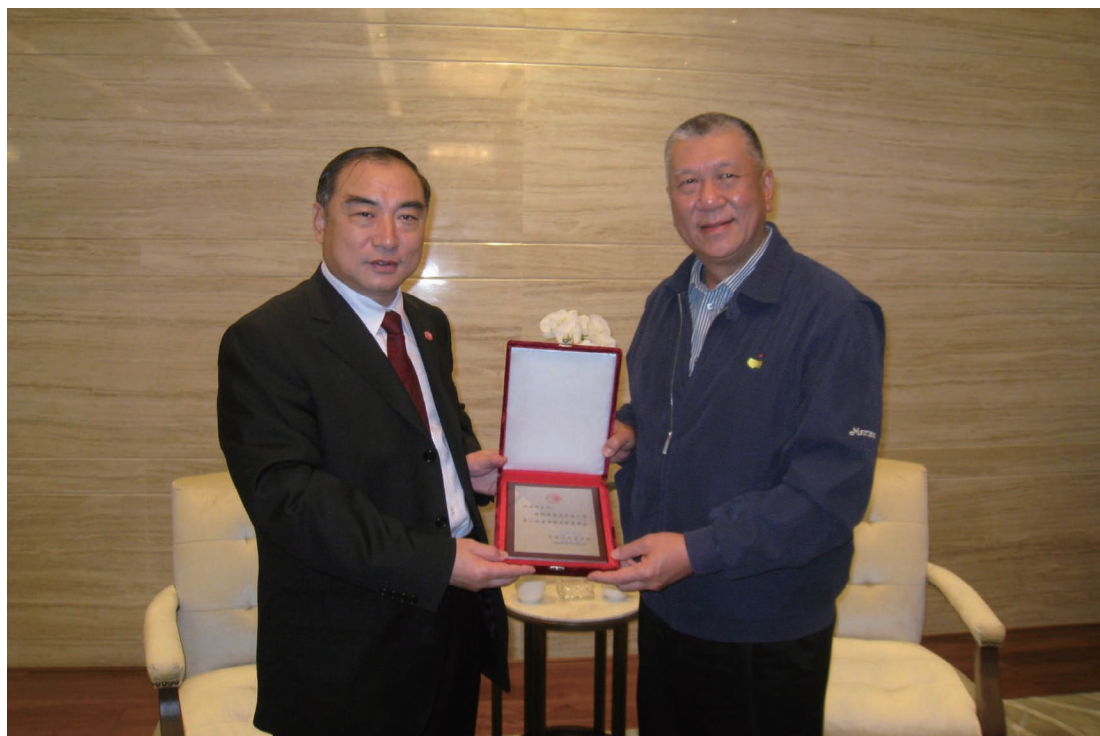
2月1日，全国政协副主席、华侨大学名誉董事长何厚铨在澳门会见了华侨大学校长贾益民一行。