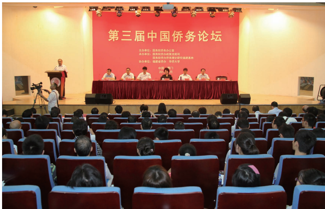
8月23日，以“加强侨务理论研究，助力实现‘中国梦’”为主题的第三届“中国侨务论坛”在华侨大学厦门校区开幕。