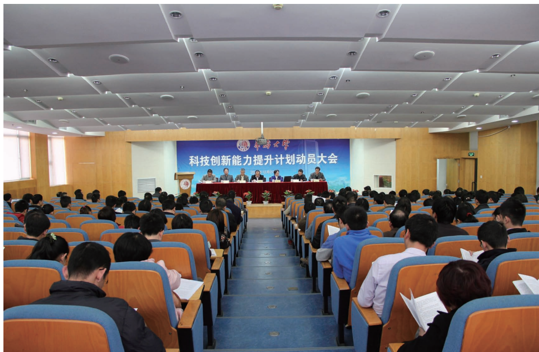
12月27日，华侨大学在厦门校区王源兴国际会议中心召开科技创新能力提升计划动员大会。