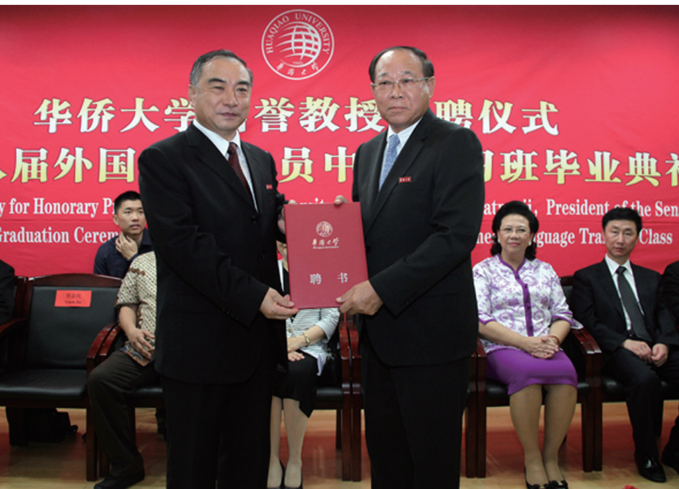
7月12日，泰国国上议院议长尼空率领泰国上议院代表团访问华侨大学。