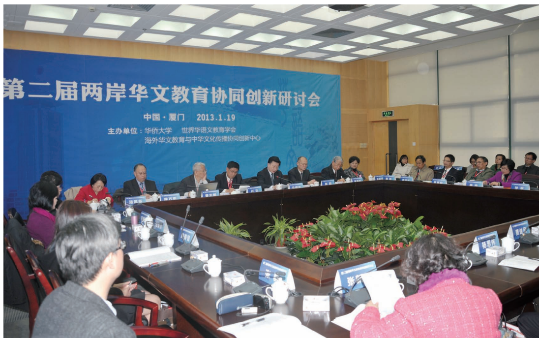
1月19日，第二届两岸华文教育协同创新研讨会在华侨大学厦门校区举行。