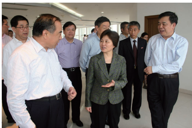
5月9日，福建省省委常委、教育工委书记陈桦莅临华侨大学厦门校区视察。