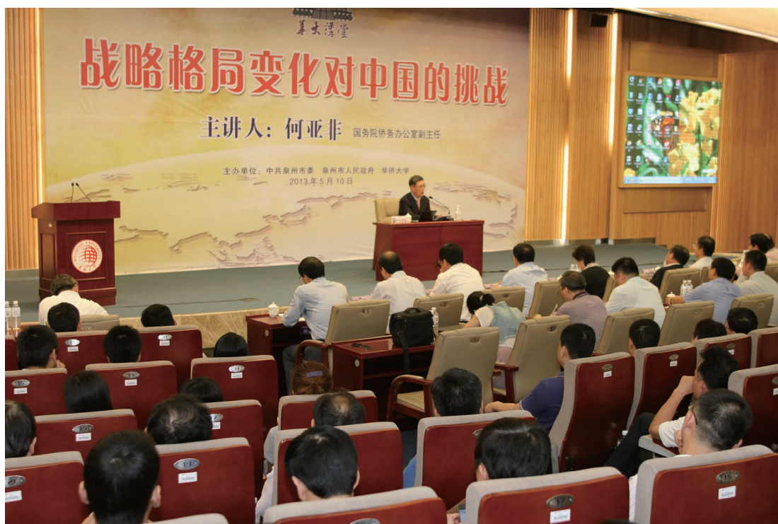
5月10日，国侨办副主任何亚非做客“华大讲堂”第三十六讲，解读战略格局变化对中国的挑战。