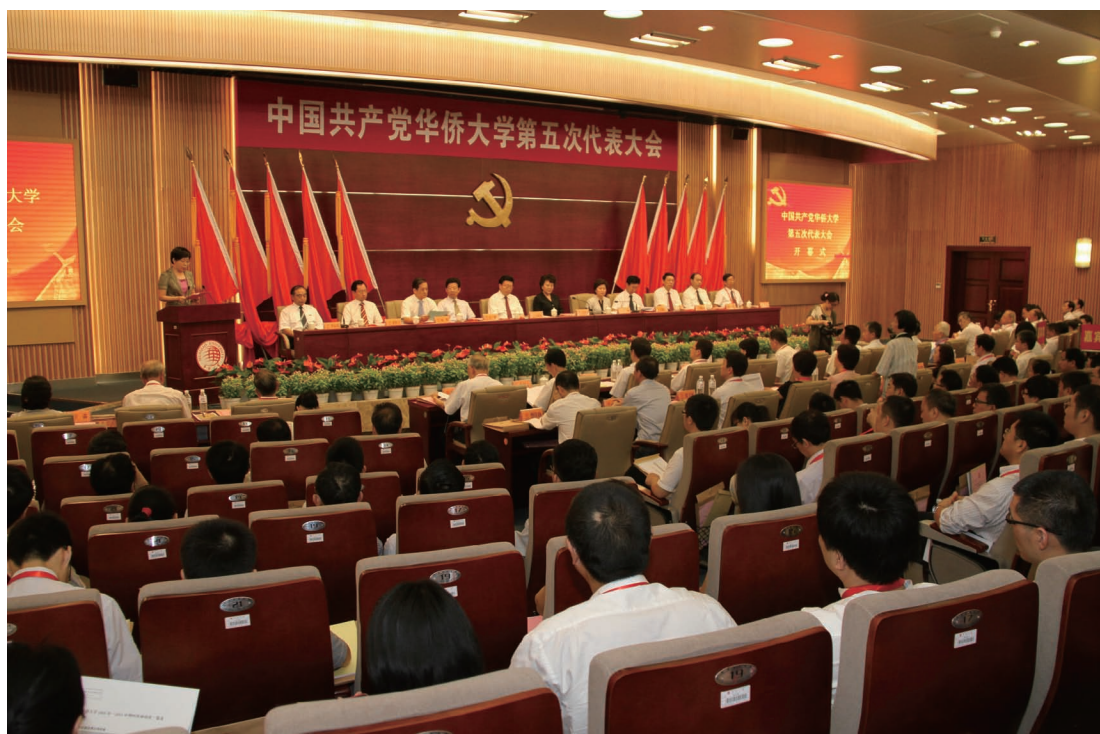
6月22日，中国共产党华侨大学第五次代表大会在陈嘉庚纪念堂科学厅隆重开幕。