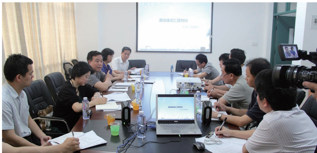
6月5~6日，中纪委驻国务院侨办纪检组组长、国务院侨办党组成员王杰等一行4人莅临华侨大学，就落实中央八项规定、侨捐资金管理使用和廉政风险防控等问题展开调研。