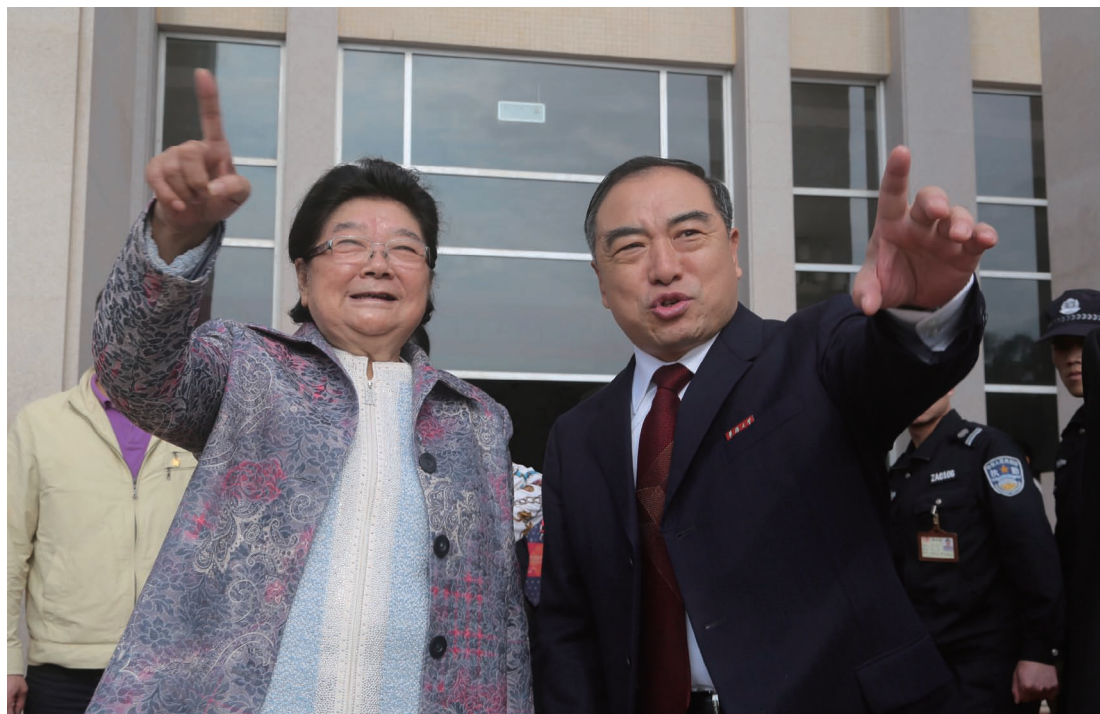
3月27日，十届全国人大常委会副委员长顾秀莲视察华侨大学。