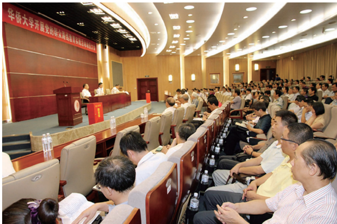
7月18日，中共华侨大学委员会在陈嘉庚纪念堂科学厅召开党的群众路线教育实践活动动员大会。