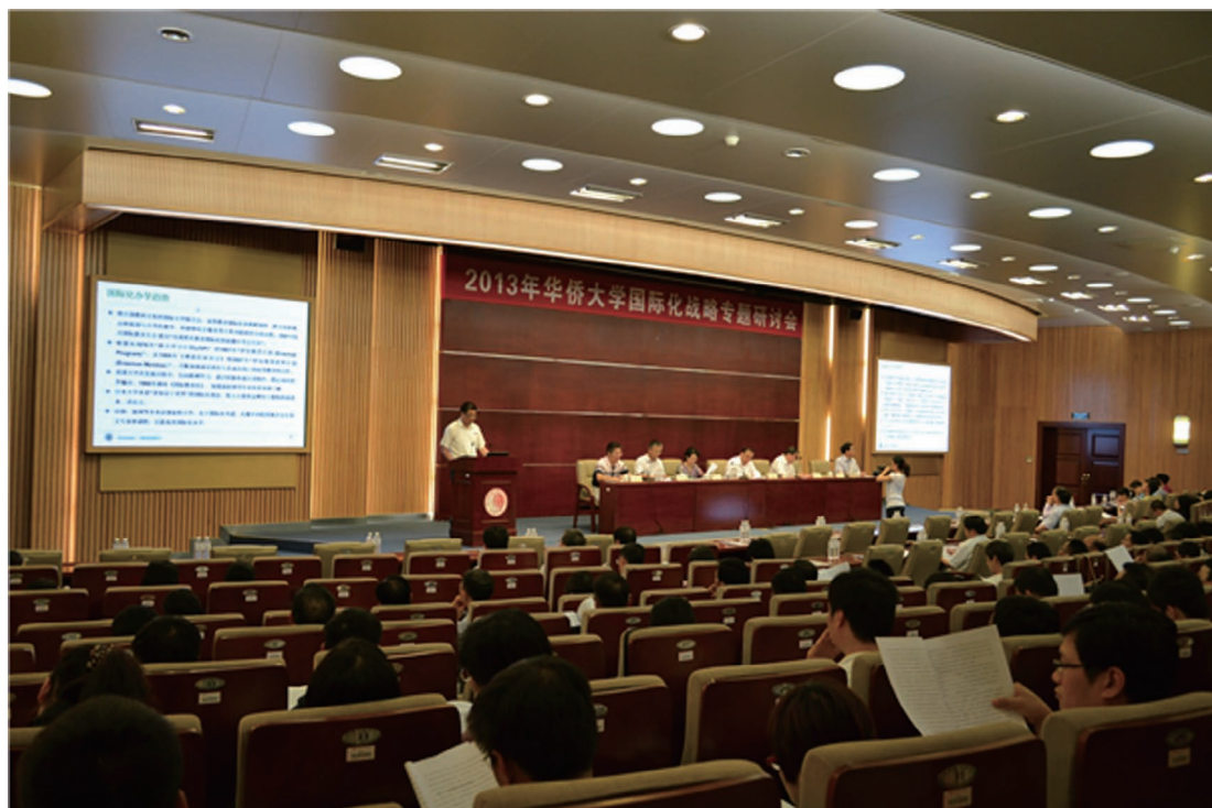
10月8日，2013年华侨大学国际化战略专题研讨会在陈嘉庚纪念堂科学厅召开。