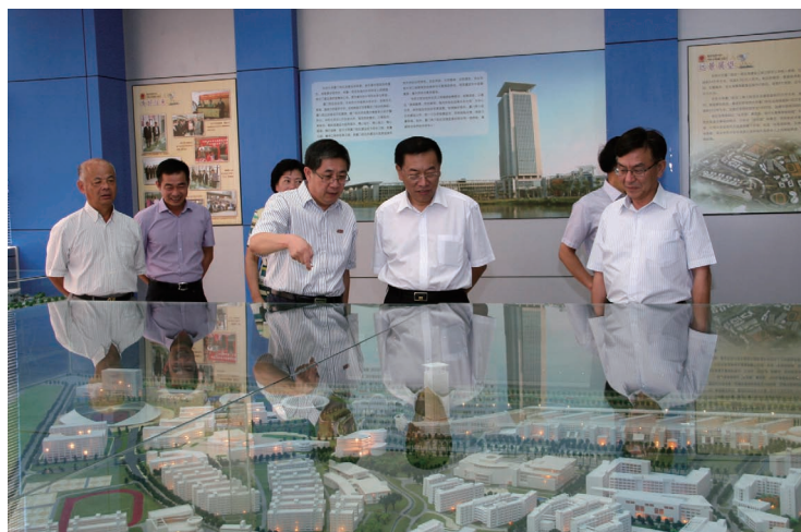
9月8日，中国侨联主席林军、副主席王永乐莅临华侨大学厦门校区视察。