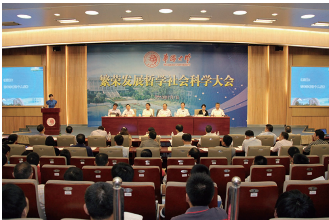
7月7日，华侨大学在陈嘉庚纪念堂科学厅召开繁荣发展哲学社会科学大会。