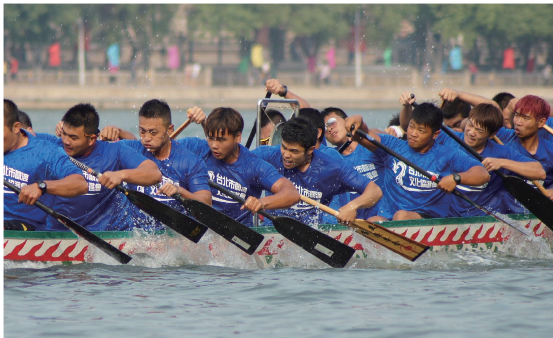
10月22日，国务院侨办、国家体育总局、厦门市人民政府合办的第四届“文化中国·2013全球华人中华才艺（龙舟）大赛”在华侨大学“中华才艺（龙舟）基地”举行，有来自马来西亚、印尼、缅甸等13个国家及港澳台地区的16支队伍参与角逐。