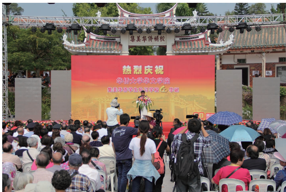
10月22日，华侨大学华文学院举行60周年庆典大会。