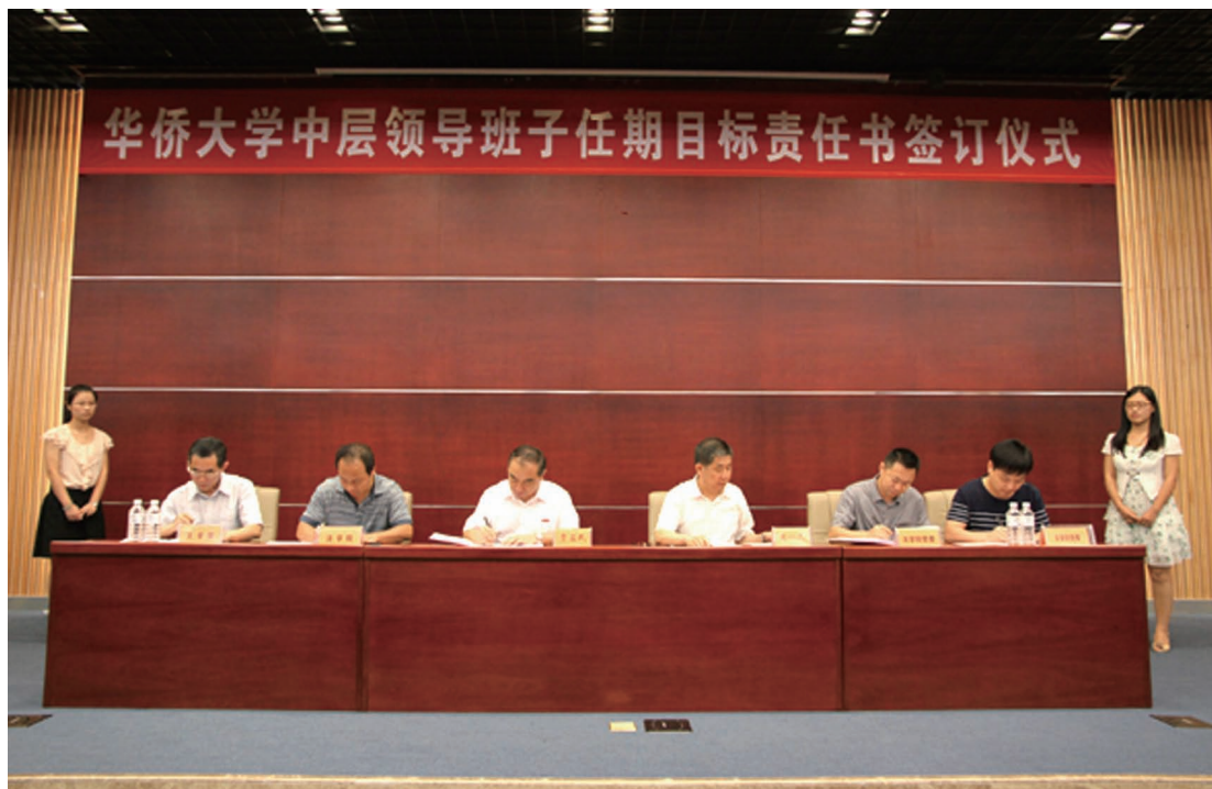
7月18日，华侨大学在陈嘉庚纪念堂科学厅举行中层领导班子任期目标责任书签订仪式。