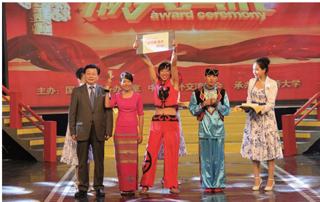
12月26日，由国务院侨办主办、华侨大学承办的第二届海外华裔青少年中华文化大赛总决赛在厦门广电集团演播厅上演。国务院侨办副主任马儒沛莅临大赛现场并为状元缅甸队颁奖。