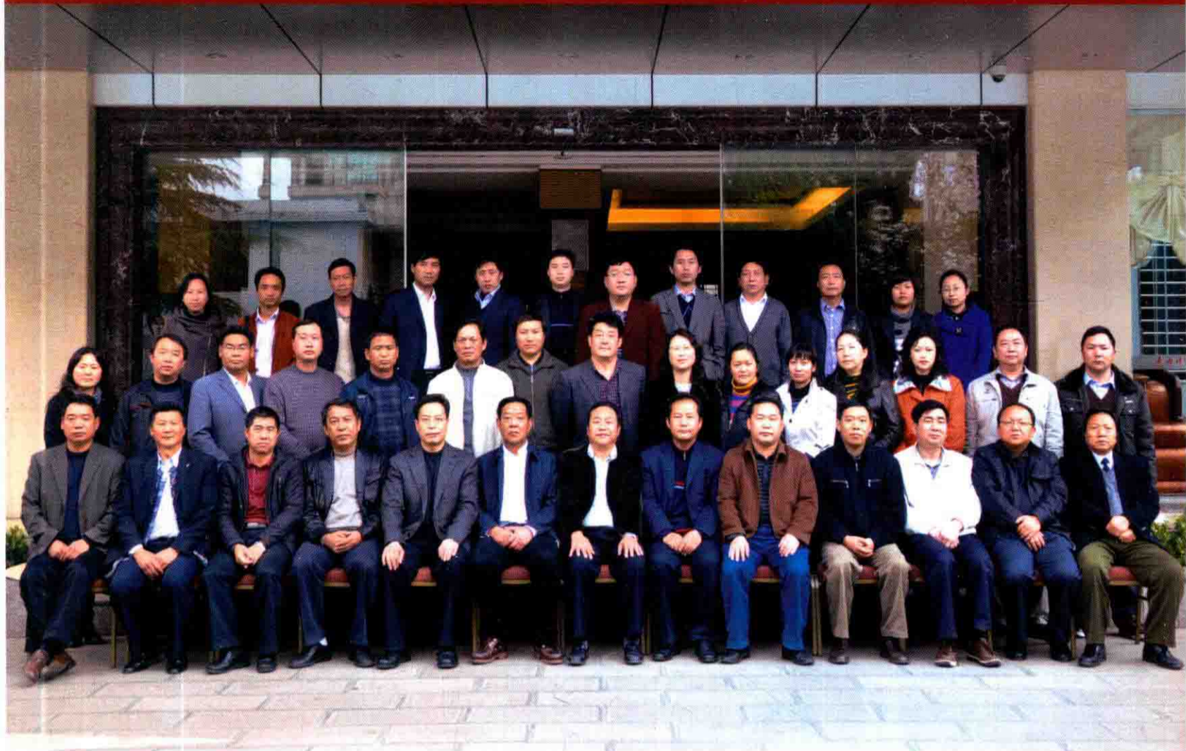
2011年3月11日《曲靖彝文古籍提要》编撰工作会议在曲靖召开时的合影