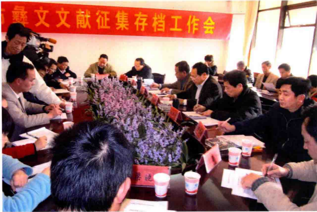
曲靖市彝文文献征集存档会场之一