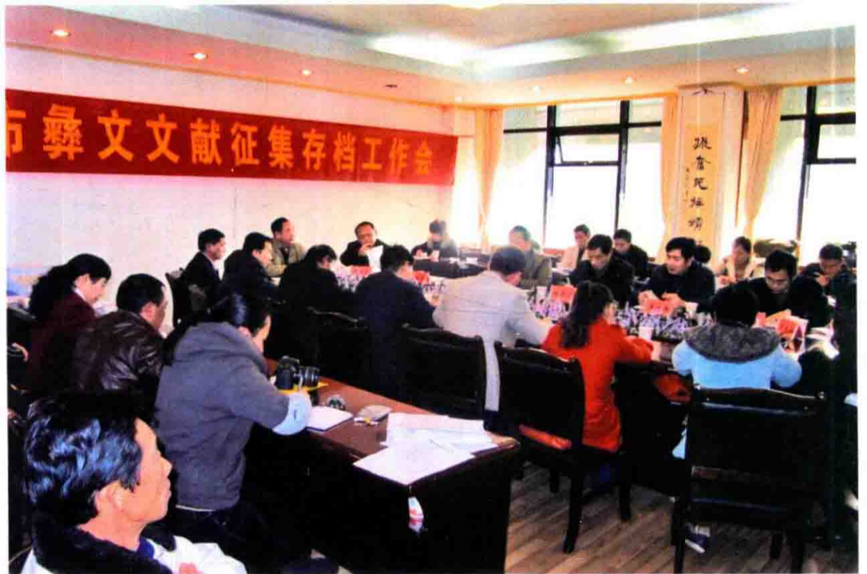
曲靖市彝文文献征集存档会场之二