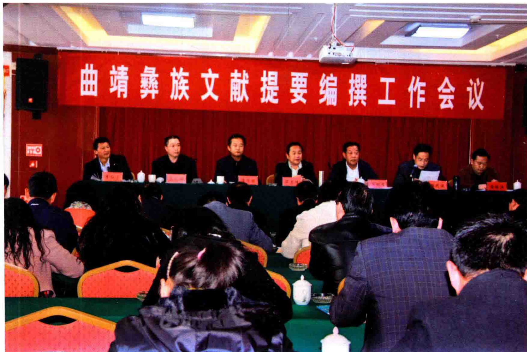
《曲靖彝文古籍提要》编撰工作会议会场