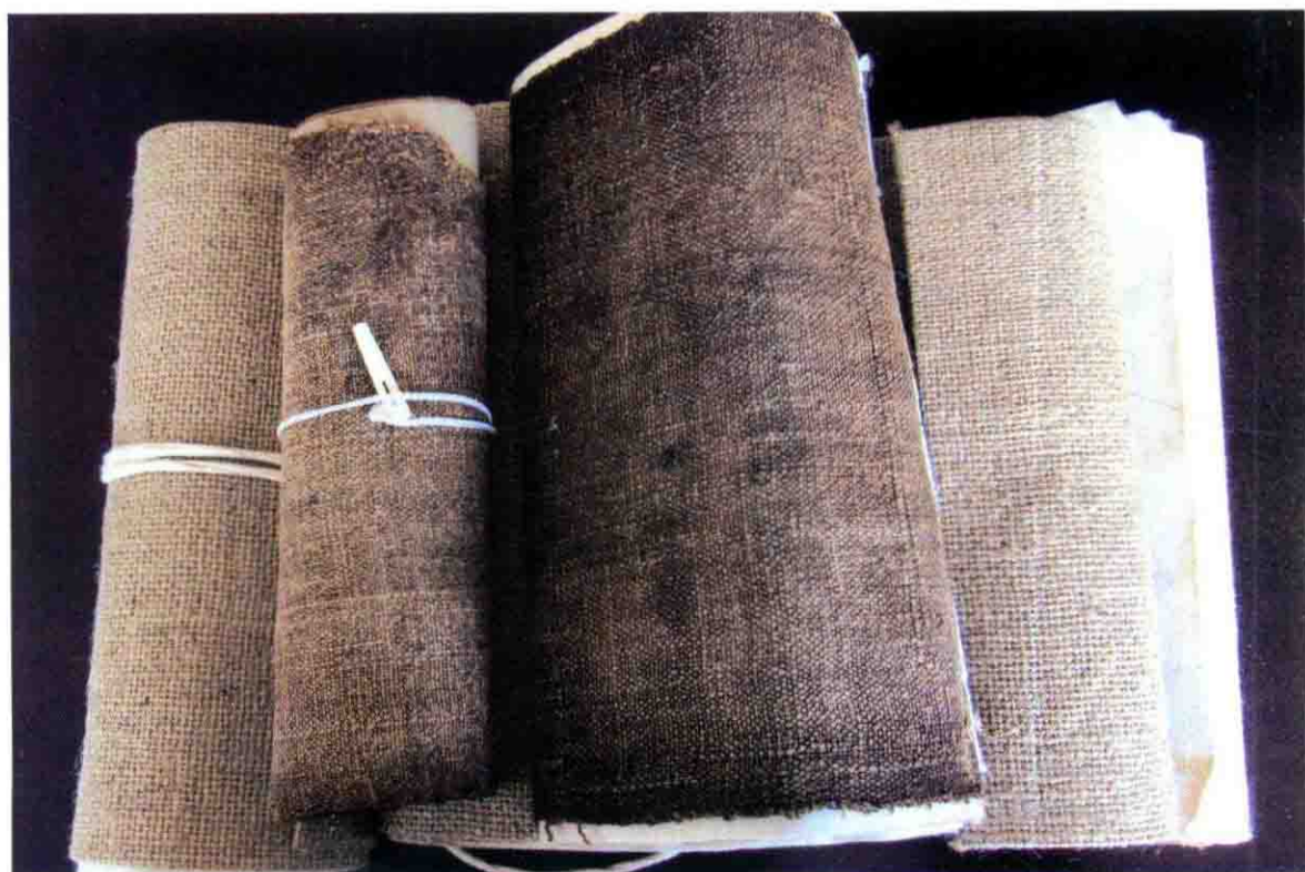
麻布封面的彝文古籍