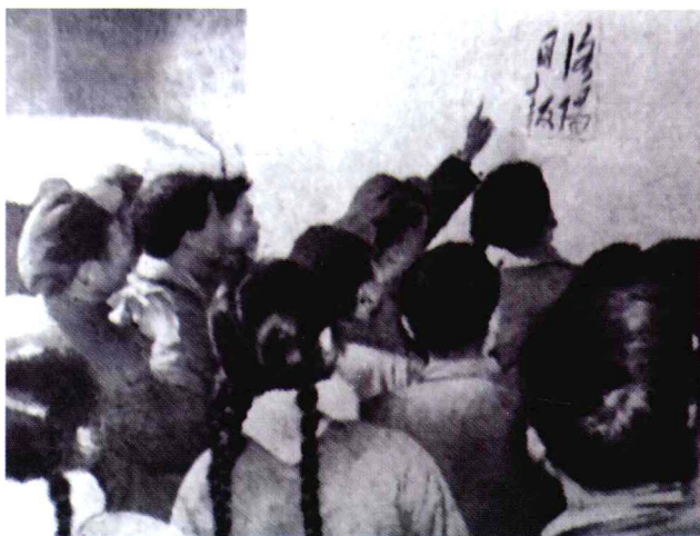
1964年12月31日员工看着次日将启用的报头兴奋不已