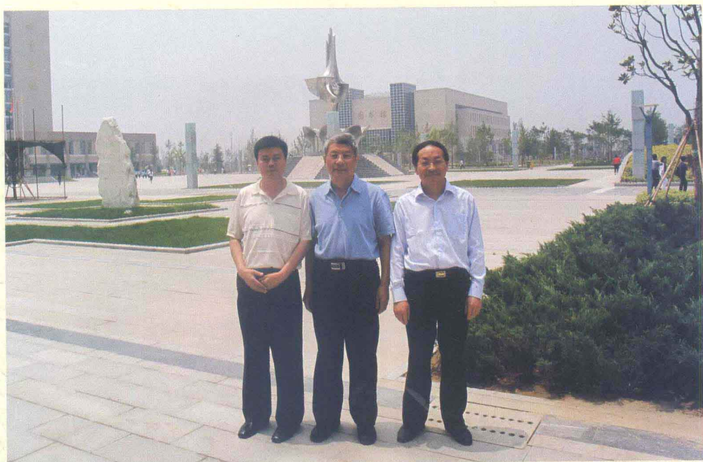
作者与国家新闻出版总署原副署长、人民日报社原副总编辑、中国人民大学新闻学院博士生导师、人教版中小学教材总顾问梁衡（中）及咸阳职业技术学院院长刘聪博（右）合影