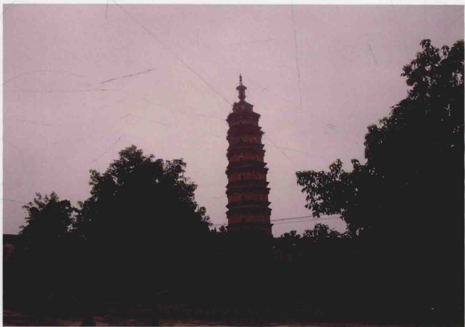
江西第一塔——浮梁北宋红塔