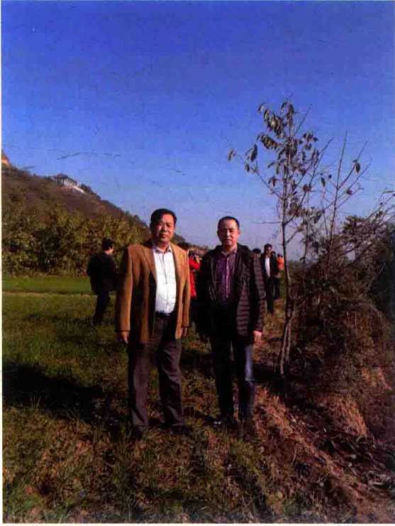
作者在杨家村单氏青铜器窖藏地考察