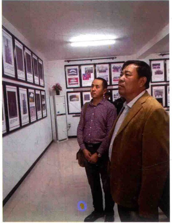
作者参观杨家村青铜器展览馆