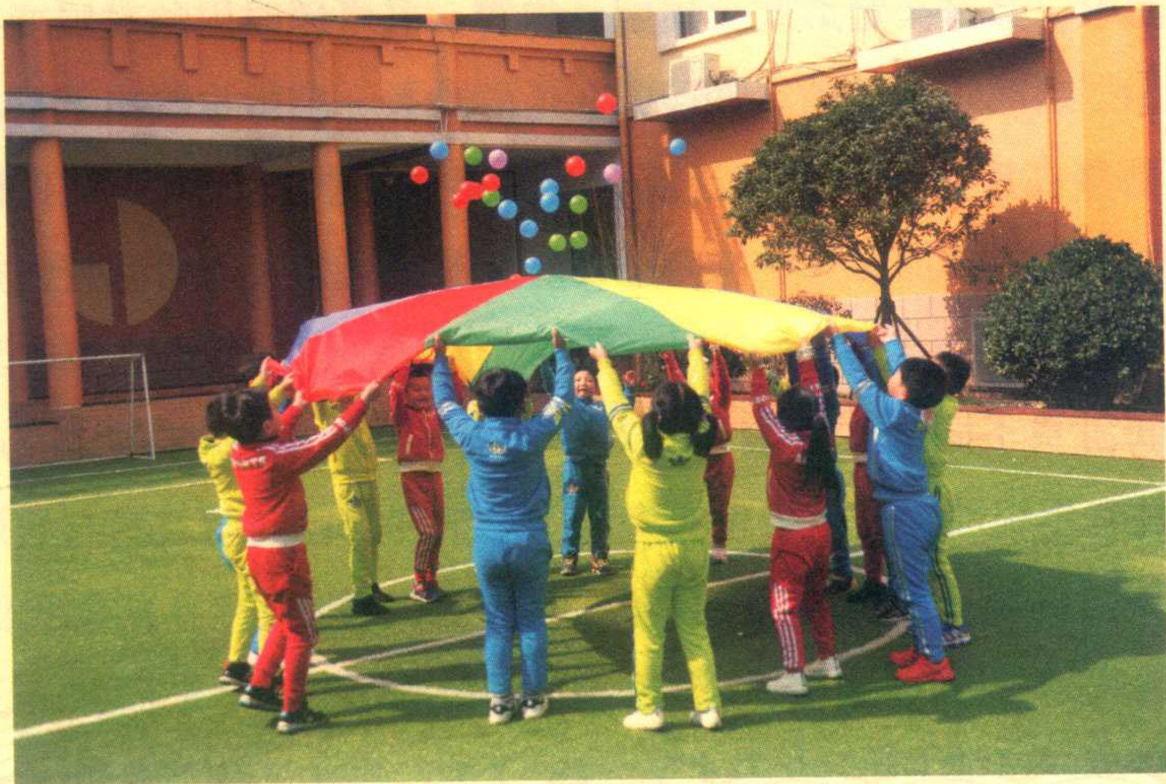
图 1-1 彩虹伞

对于童年时代，印象最深刻的就是一有时间便和邻居小伙伴们在空气新鲜、阳光充足的空地上、院子里玩踢毽子、跳房子、捡棋子的游戏，这些风格迥异的游戏具有浓厚的生活气息，流行于少年儿童中间，也是节日里成年人的娱乐节目。有些游戏项目在发展中逐渐完备，最后成为竞技项目或杂技艺术。