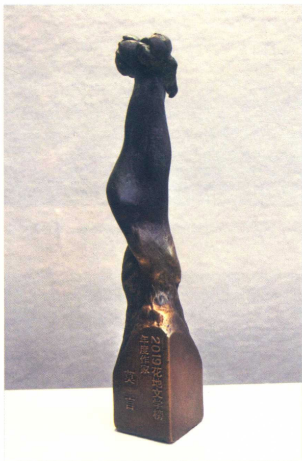
2019年花地文学榜年度作家奖杯