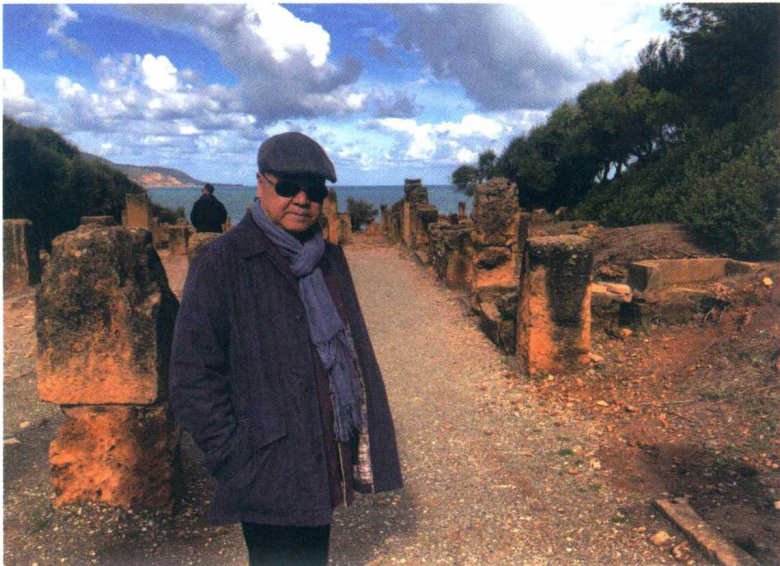
2018年11月，参观阿尔及利亚古代建筑遗迹