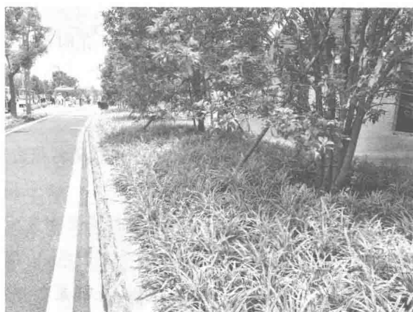
图2 金边阔叶麦冬地被

可观叶也可观花,既能地栽也可上盆,是新优彩叶类地被植物,广泛应用于现代景观园林中林缘、草坪、水景、假山、台地修饰等处(如图2所示)。