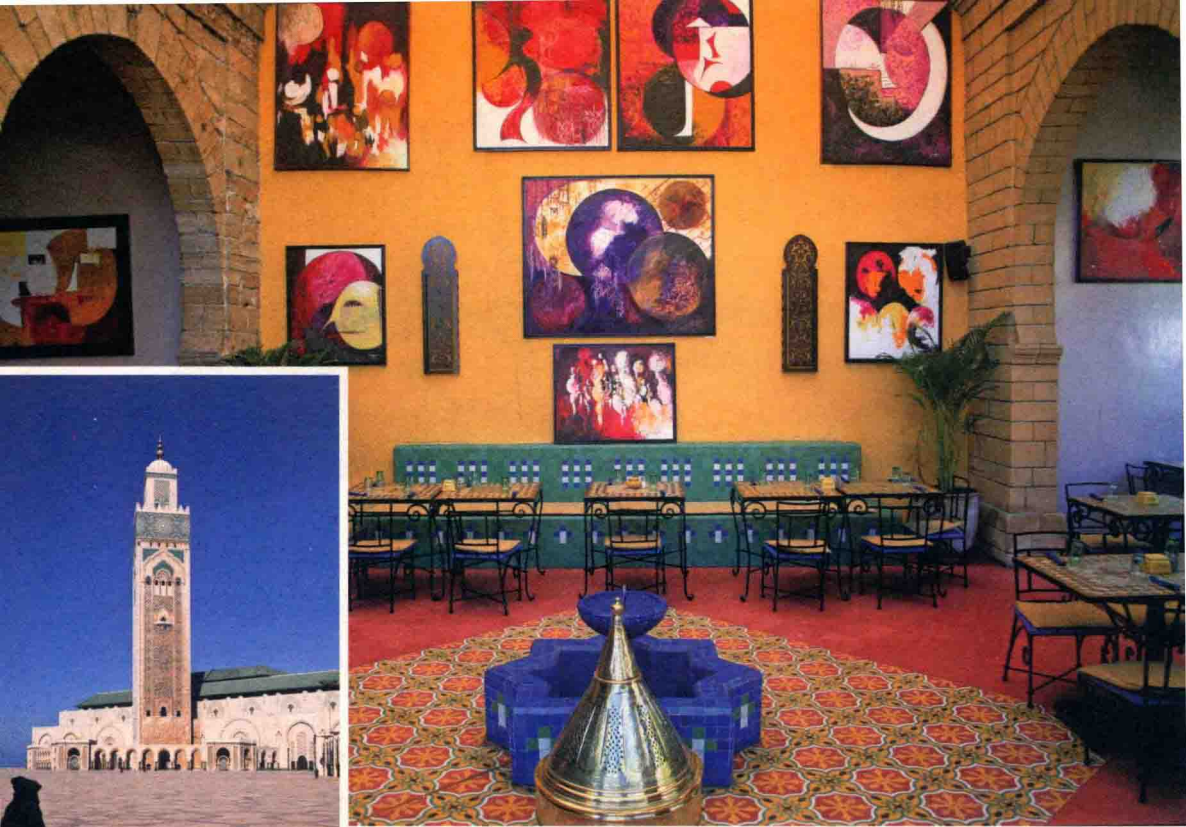
▲ 卡萨布兰卡的酒吧