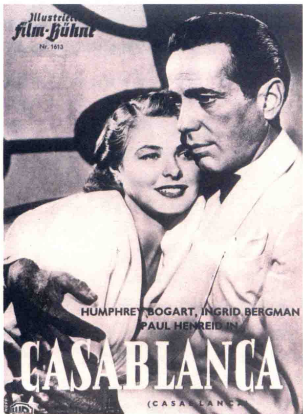
◀ 电影《卡萨布兰卡》海报