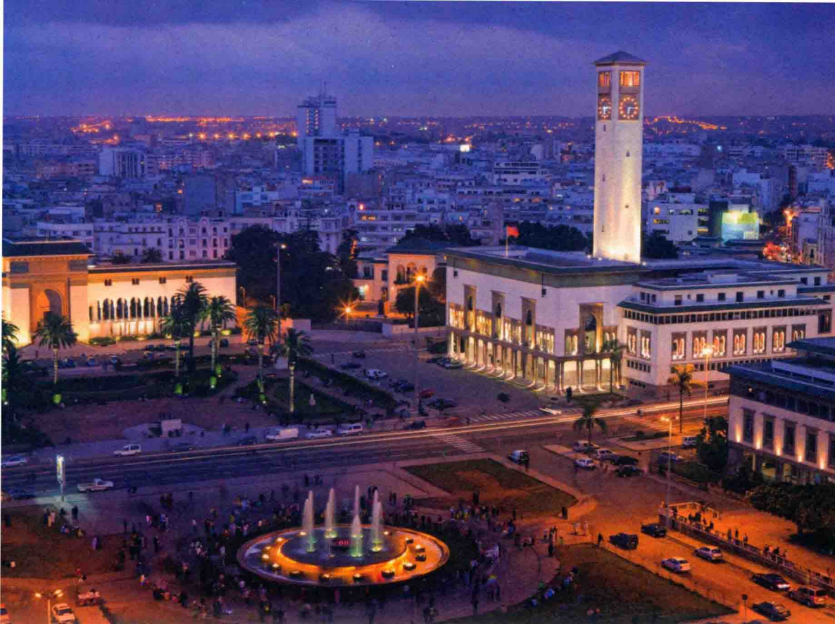
▲ 俯瞰穆罕默德五世广场和整个城市

市自诞生之时，洁白就成了它的主色调。在辽阔蔚蓝的海洋辉映下，达尔贝达成了大西洋岸边一抹淡雅多姿的景象。