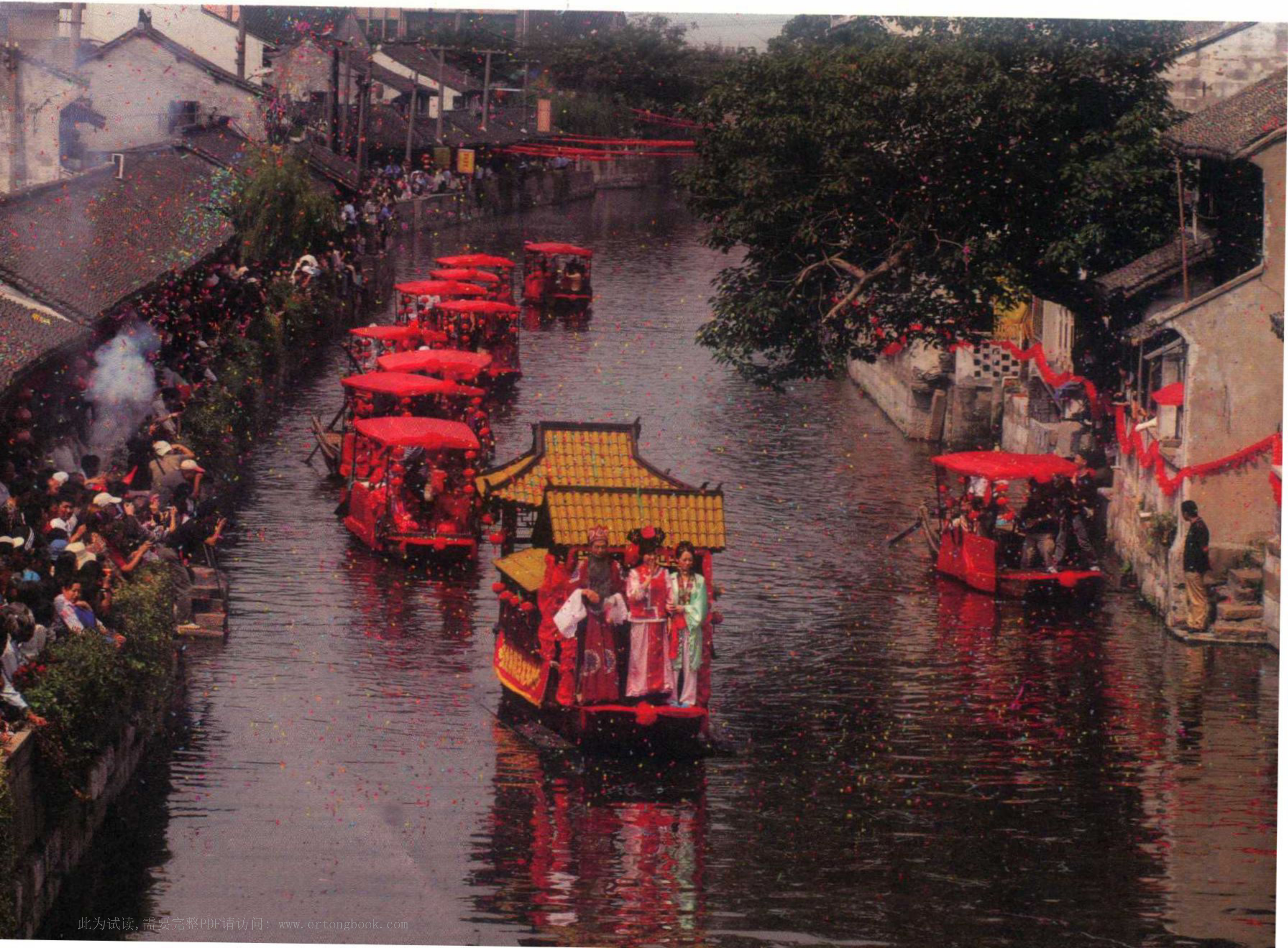
枫泾古镇中的表演