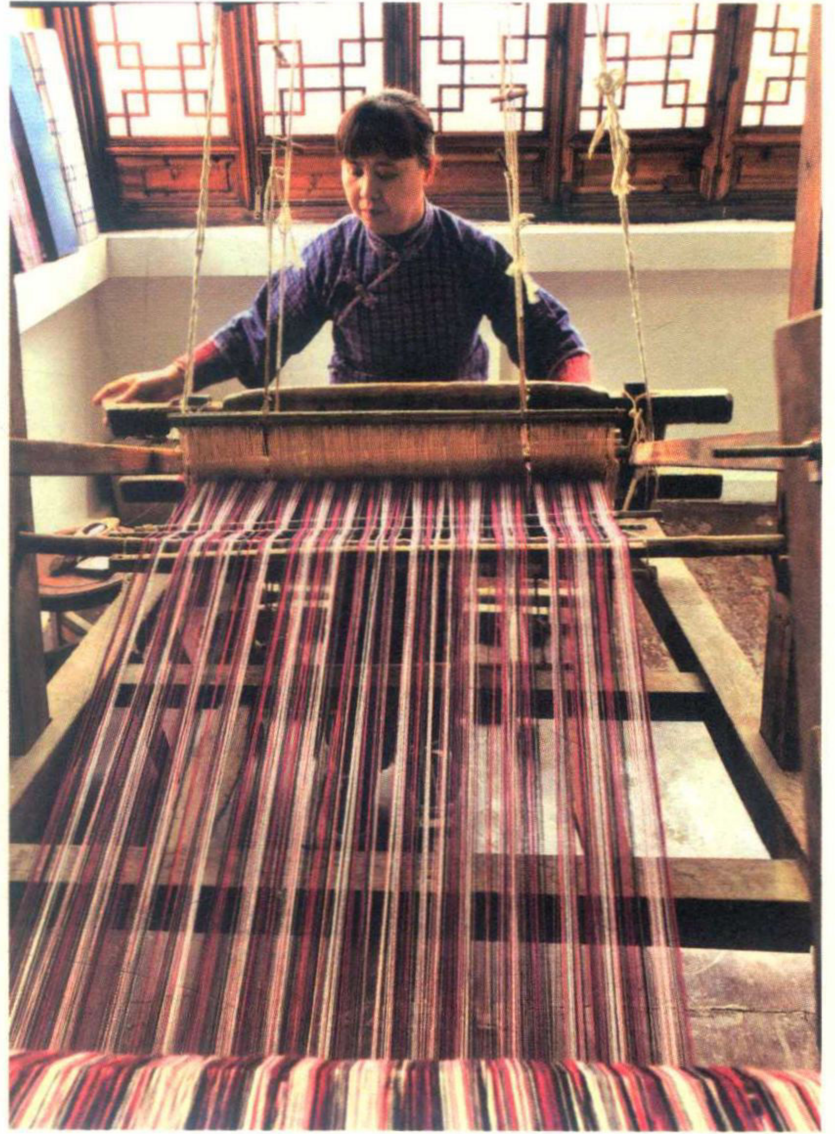
三林标布传承人在织布