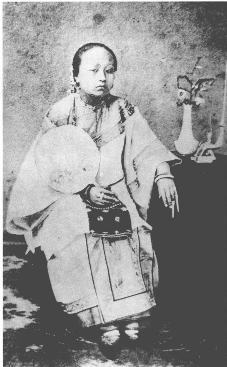
五、上海婦女坐像 一八五四年 攝