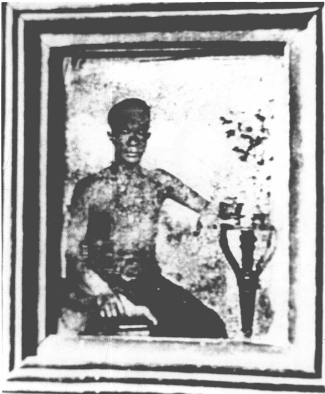
四、廣東攝影師羅以禮(1802—1852)像