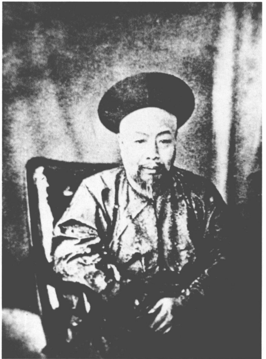
八、兩廣總督葉名琛(1807—1859)像