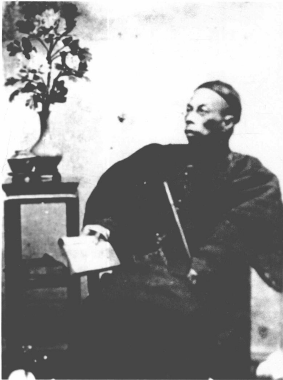
七、近代科學家鄒伯奇(1819—1869)像