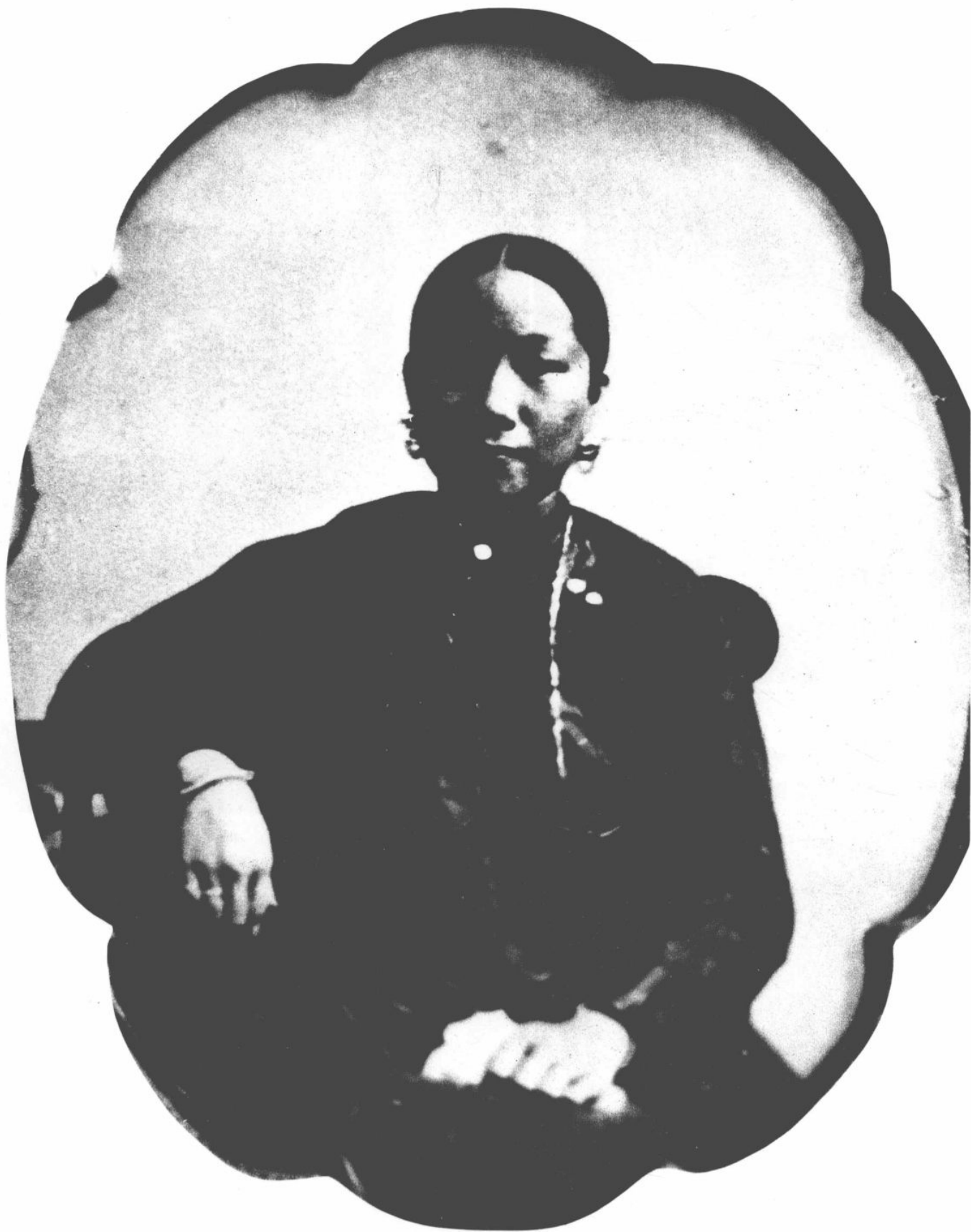
六、廣東婦女坐像 一八五四年 攝