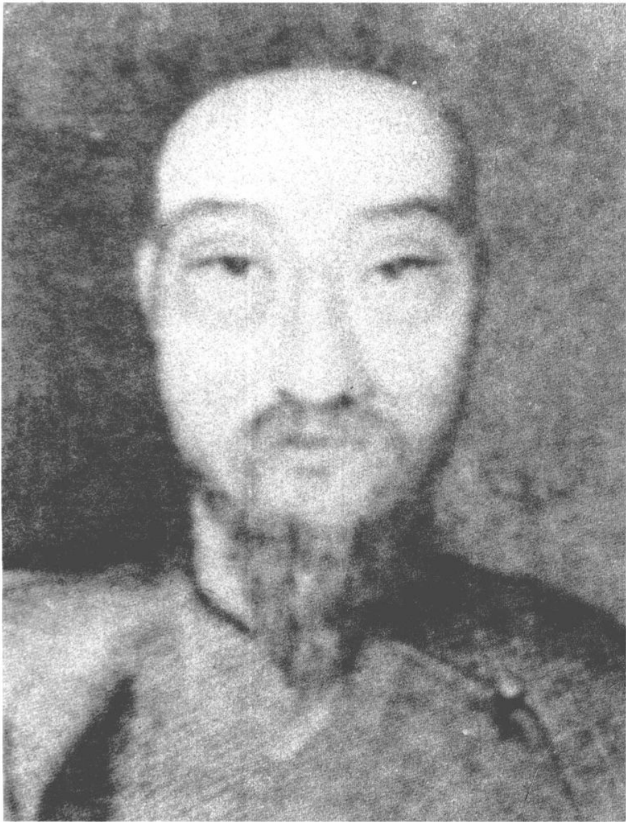
一、兩廣總督耆英像(1780—1858)