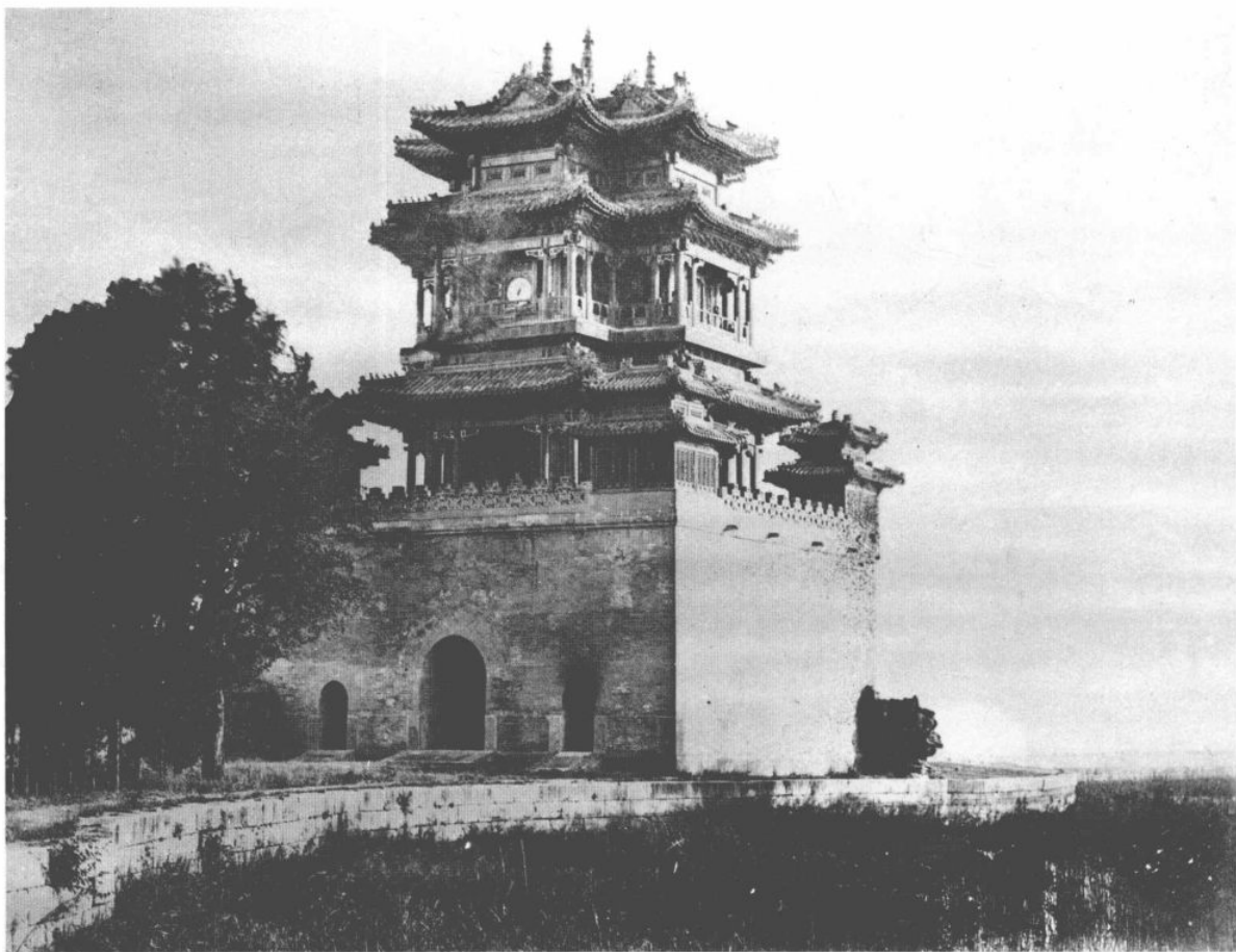
十、頤和園被燒毀前(之一)