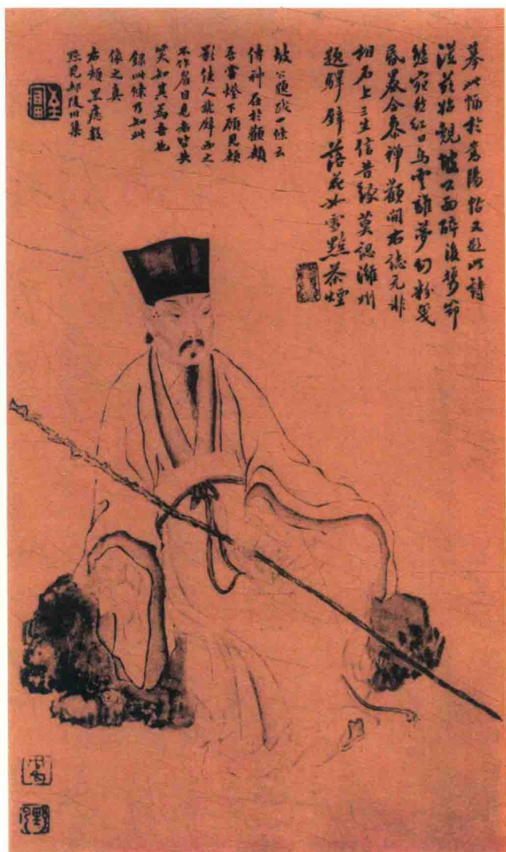
东坡画像（宋李公麟原画，清朱野云临摹，清翁方纲题款）