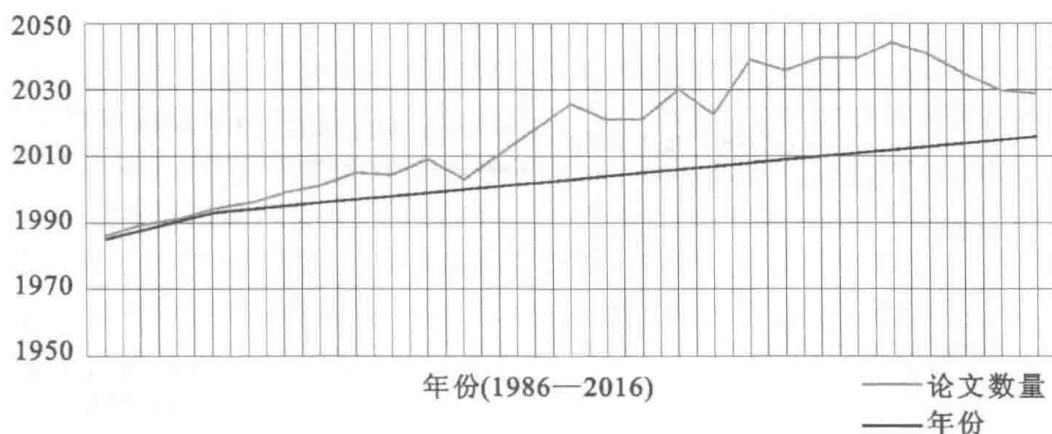
图1 “教学决策”教育理论与教育管理学科领域期刊文献数量年分布图

在中国知网 CNKI 基础科学→哲学与人文科学→社会科学Ⅱ辑→中等教育学科领域进行“教学决策”的全文精确搜索,期刊文献有 73 篇,其年分布图如下: