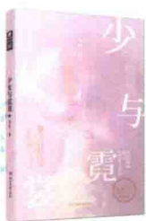
《少女与霓裳》 简洁/著