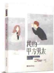
《我的甲方男友》 若怀特/著