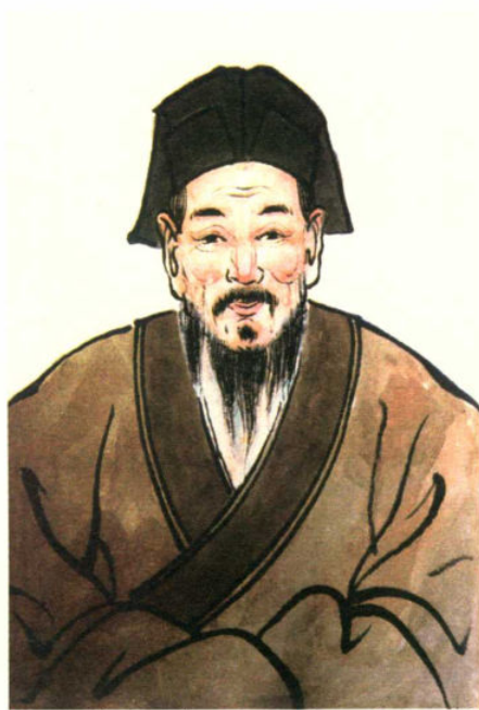
黄琬 (891—950)，字世重，五代十国，于浦江迁江西分宁，后又迁嵎州定居，唐五代处士，江夏黄氏第廿七世。