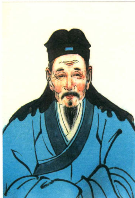
黄惠 (915—967)，字承远，北宋，江夏黄氏第廿八世，约于963年迁诸，为诸暨孝义始祖。