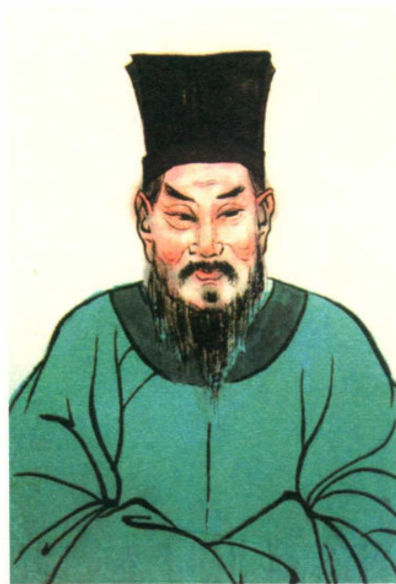
黄褒 (940—995)，字廷美，北宋，江夏黄氏第廿九世，葬“啸天龙”。