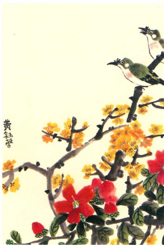
黄钰馨 (11岁) 画