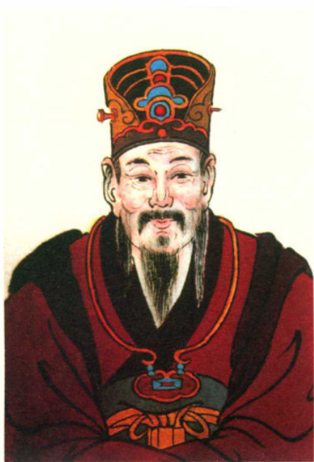
黄香 (68—122)，东汉，黄氏江夏始祖，字文强，江夏安陆人。东汉尚书令，魏军太守，“扇枕温衾”二十四孝之一。