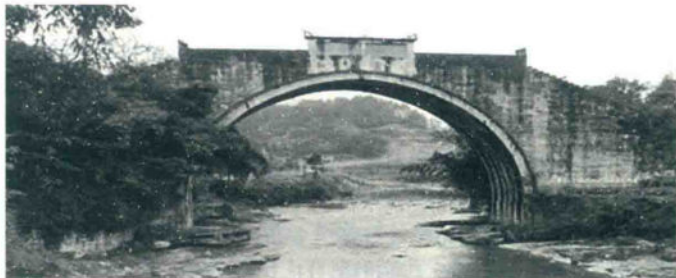
位于正安、绥阳两县边界赤尾河上的公馆桥

正安州（含今道真自治县） 《遵义府志》载有 21 座：来青桥、凤仪桥、永安桥、鸿济桥、濯婴桥、白杨桥、联水桥、步虚桥、甘溪桥、平桥、淮溪桥、进履桥、小水寺桥、丁家桥、桥溪桥、瓮溪桥、浒溪桥、太平桥、天生桥、牛渡河桥、永济桥。《续遵义府志》载有 20 座：乐安桥、接龙桥、杨柳坝桥、大屋沟桥、佛缘桥、碧阴桥、第一桥、乐