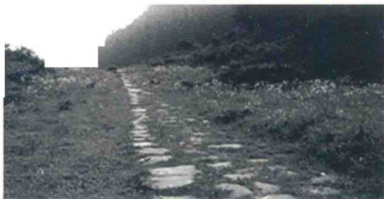
筑渝大道——桐梓夜郎古道

筑渝大道 遵义南北方向驿道。南通贵阳，北至重庆。出城路段20千米为石板路面。唐乾符三年（876年），杨端开通渝州至播州道路，并与矩州（今贵阳）道路连接。南宋淳熙三年（1176年），播州第十二世首领杨轸将其治所迁至穆家川时，筑渝道路已比较宽阔。路线经马坎关、官渡头、桃溪寺、土地撞，穿老城向北经洗马滩、普济桥、纯阳阁、会川桥，沿高坪河右岸至九节滩。杨轸为保障城池安全，将此道路改从城外谷地经过，形成新路线。端平二年（1235年），为抗击南下蒙古军，播州土司杨价派兵5000人由筑渝道路入蜀，解青野原之围。嘉熙年间，杨文又遣兵3000援蜀。这两次大规模军事行动，将播州至重庆路段拓宽。元至元二十一年（1284年），播州至重庆道路辟为驿道。天历二年（1329年），四川平章政事囊嘉特反元，元廷调湖广兵镇压，上万元军沿此路经贵州、播州前往，筑渝道路已颇具规模。此后，筑渝道路全部辟为驿道，成为连接湖广和四川的主要通道。明代，筑渝道路开始成为綦岸盐运干道，是川盐入黔的主要路线之一。