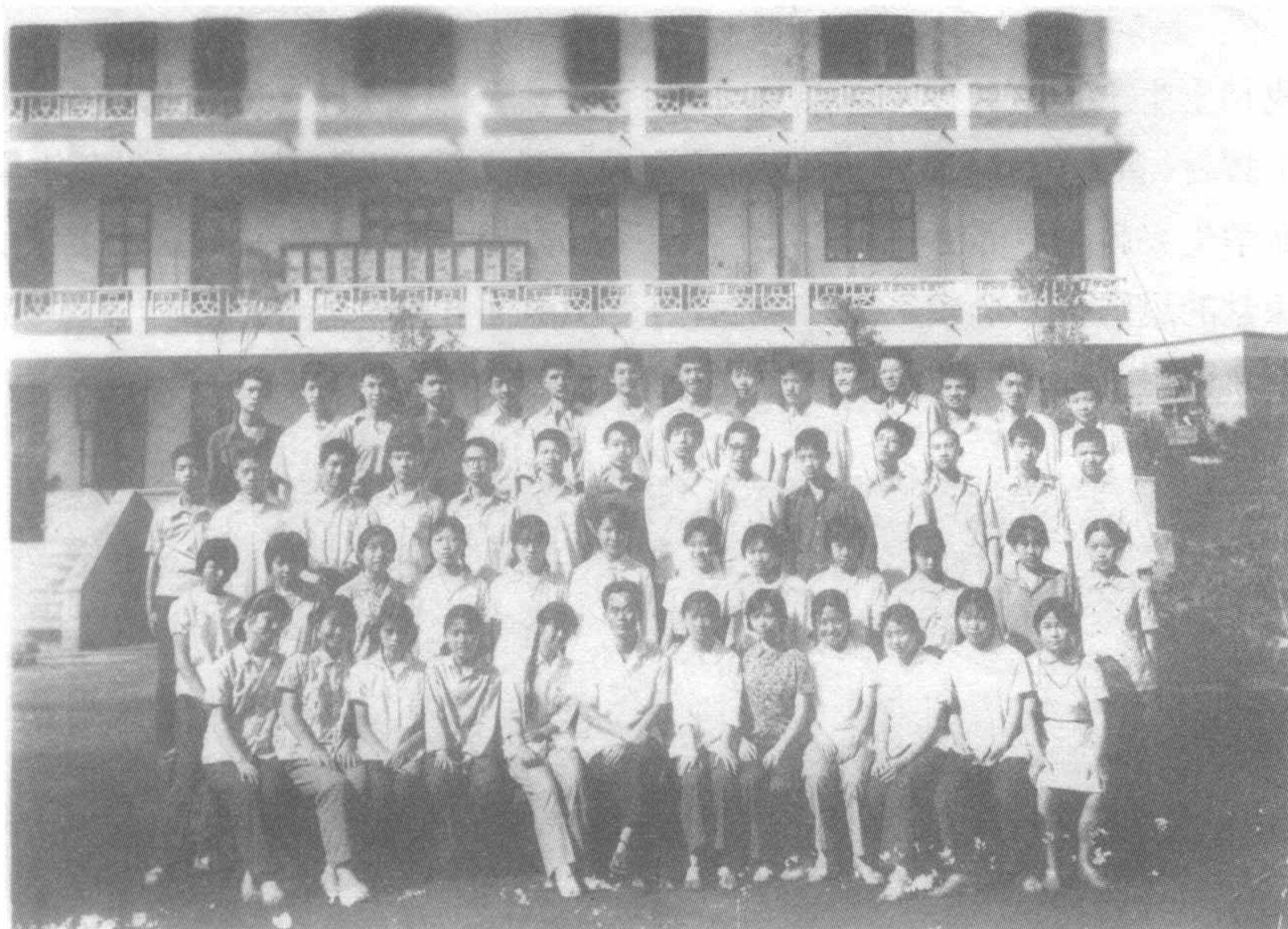
图2 黄石八中1981届初三(1)班毕业照