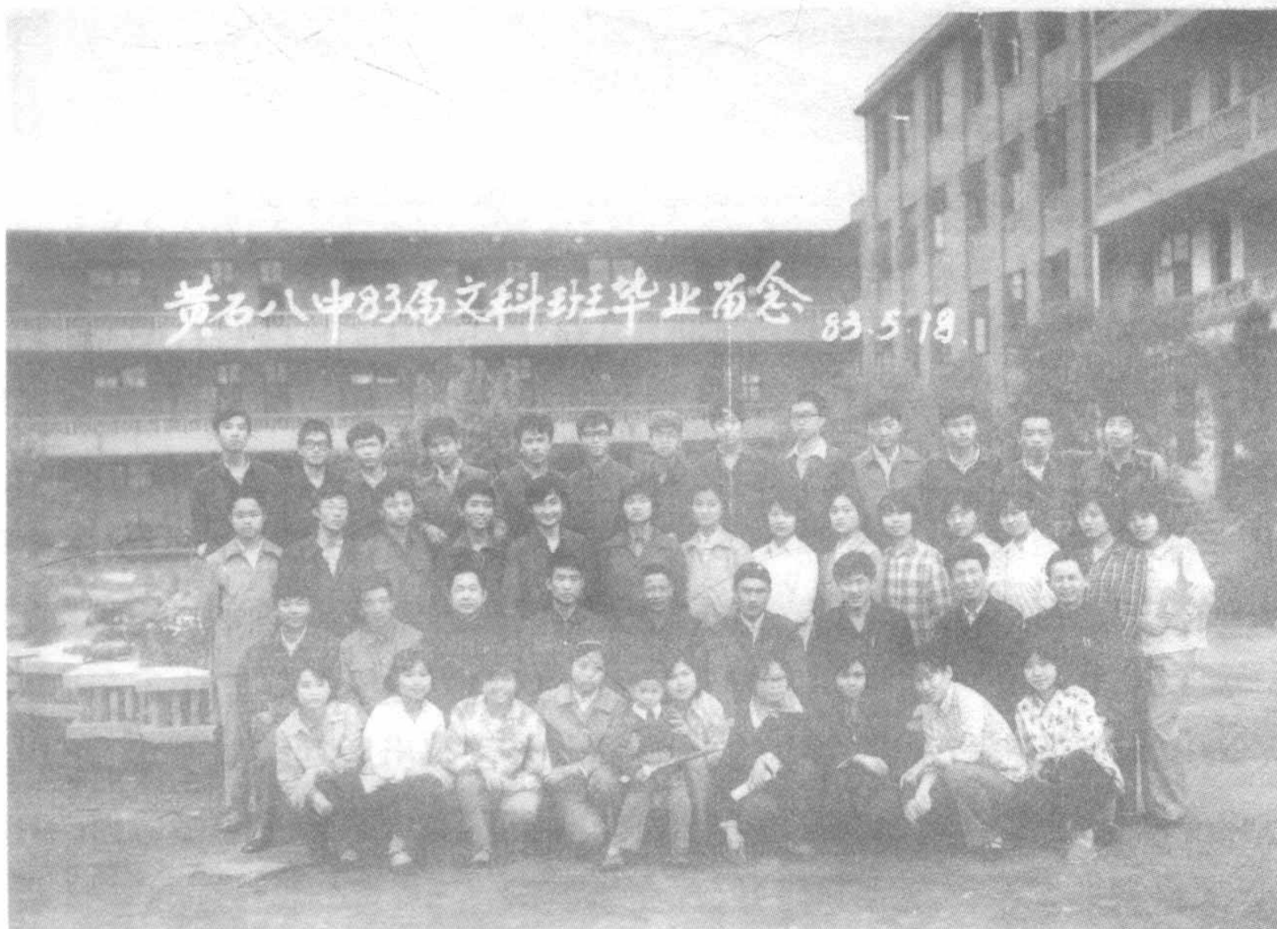
图3 黄石八中1983届高二文科班毕业照