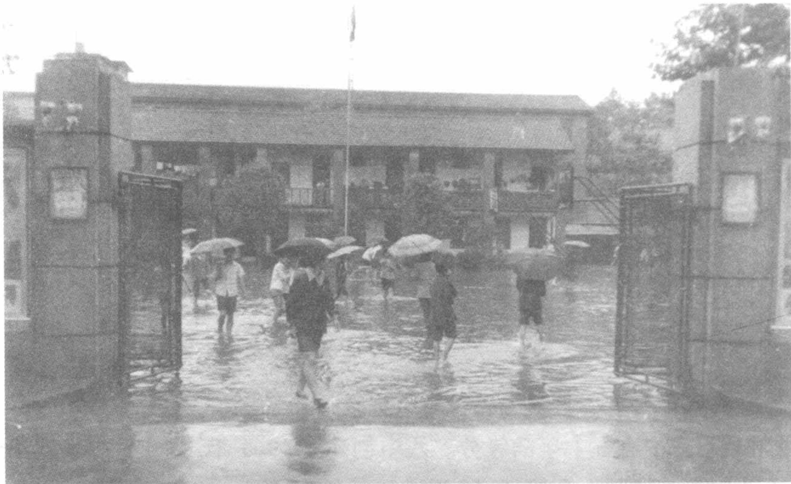
图1 70年代末大雨过后的黄石八中校门