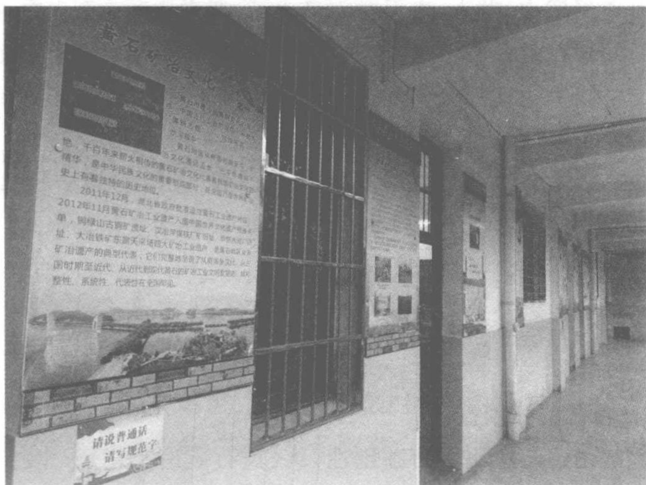
图6 黄石八中矿冶文化墙