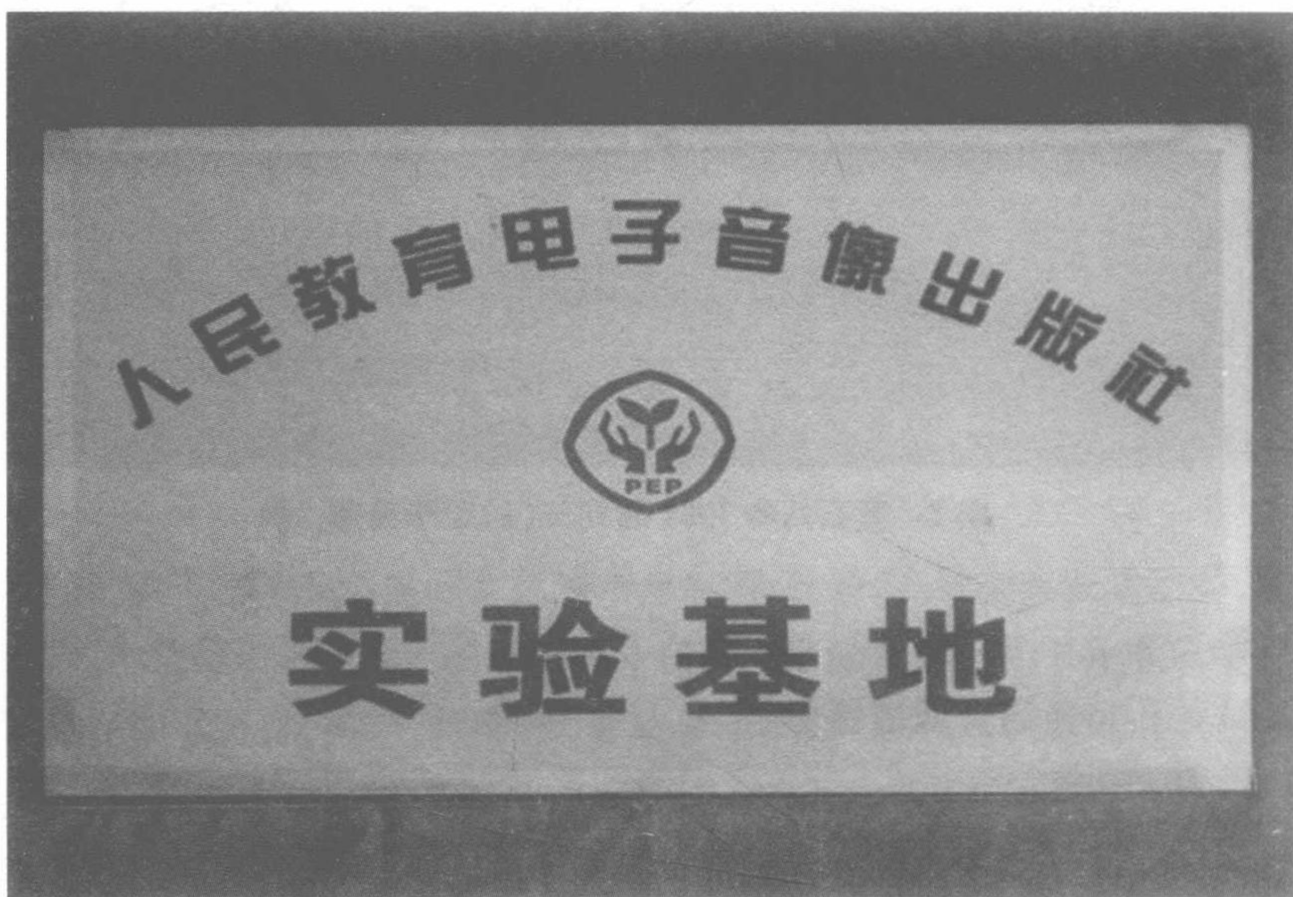
图4 黄石八中成为人民教育电子音像出版社实验基地

我是土生土长的黄石人,对家乡有深厚的感情。1997年被黄石市教研室聘请为乡土教材《黄石历史》主编,普及与研究黄石地方文化成为我又一个奋斗目标。一手抓学生兴趣的培养,一手抓地方历史文化的普及与研究,构建黄石特色历史开心课堂的思路初步形成。2001年,黄石八中全面开展信息化多媒体教学实验以及国家新课程改革的全面推进成为黄石特色历史健康课堂形成的突破口。