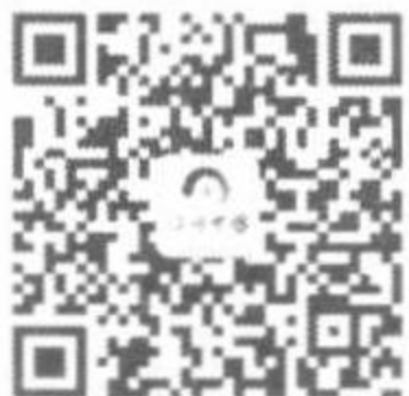
诗词中国微信公众号