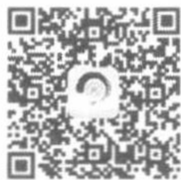
诗词中国客户端 安卓版