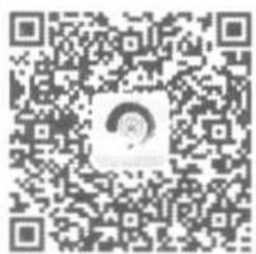
诗词中国客户端 苹果版