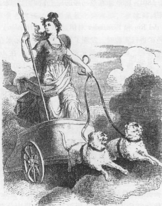
图 1-1 北欧神话中的女神凡娜迪丝 (Vanadis) [别名芙蕾雅 (Freya)]

了他的样本 (来自基马潘的矿石) 与 Sefström 发现的新金属 vanadin (来自条形铁及其炉渣) 是相同的, 这使得 G. Rose 将柏林博物馆展出的 Humboldt 的原始标记为基马潘矿石的标签上加上了 Vanadinbleierz (含钒铅矿; 实际上它是钒铅矿, \text{Pb}_5[\text{VO}_4]_3\text{Cl} , 与羟磷灰石同晶型, 见图 1-2) [3] 。