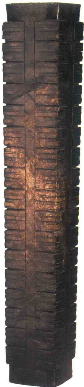
玉琮，高 47.2cm，上端宽约 7.7cm，下端宽 6.8cm，孔径约 4.2cm，良渚文化晚期（约公元前 2500—公元前 2200 年），台北“故宫博物院”