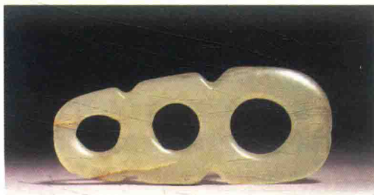
三连璧，长 8.62cm，松黑地区出土，约公元前 5000—公元前 3500 年，台北“故宫博物院”