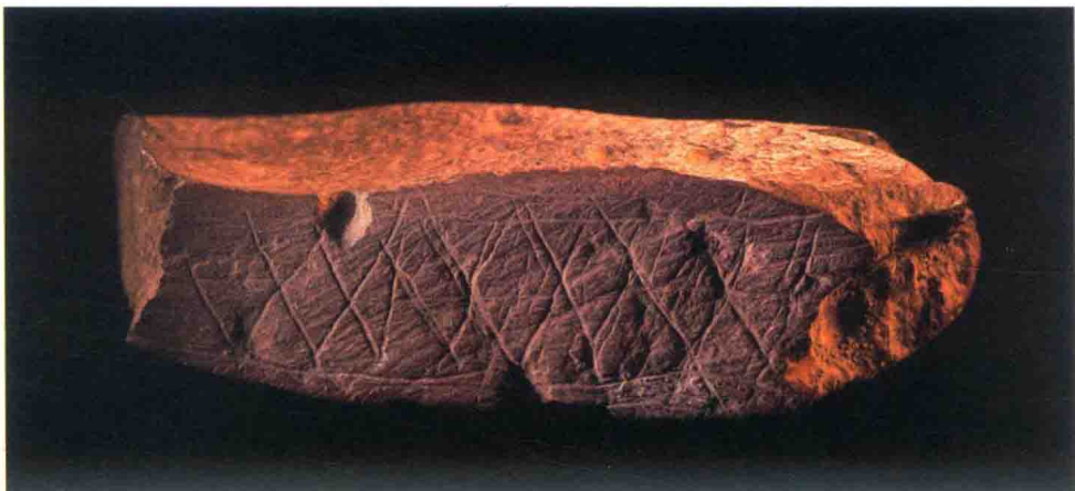
南非布隆波斯洞穴出土的 75000 年前的岩画和岩刻

作、收集和保存镂空的贝壳、岩刻石块是人类文化的独有特征，可以说是“收藏行为”产生的源头。人们为什么要佩戴海螺壳这样的装饰品？或许可以借用达尔文研究动物进化的理论来进行类比，他认为动物的鸣叫、跳舞、色彩、羽毛都有吸引异性的功能，这些能力与特征越是突出，与异性交配的机会就越多，能繁衍的子女也就越多，而其雄性后代又必然继承到父亲的行为特征，于是，“性选择”导致了雄孔雀有修长、绚丽的尾巴 3 。有余力收集、制作、佩戴这些贝壳珠饰的人，或许也是以此炫耀他的强壮、智慧或者美丽，吸引异性的关注或者标志自身在部落中是巫师或者长老。佩戴、使用各种饰品或许是巫师等部落首领与神灵沟通、塑造权威形象的“手段”，并在之后演变出一系列等级制的礼仪规范和制度。