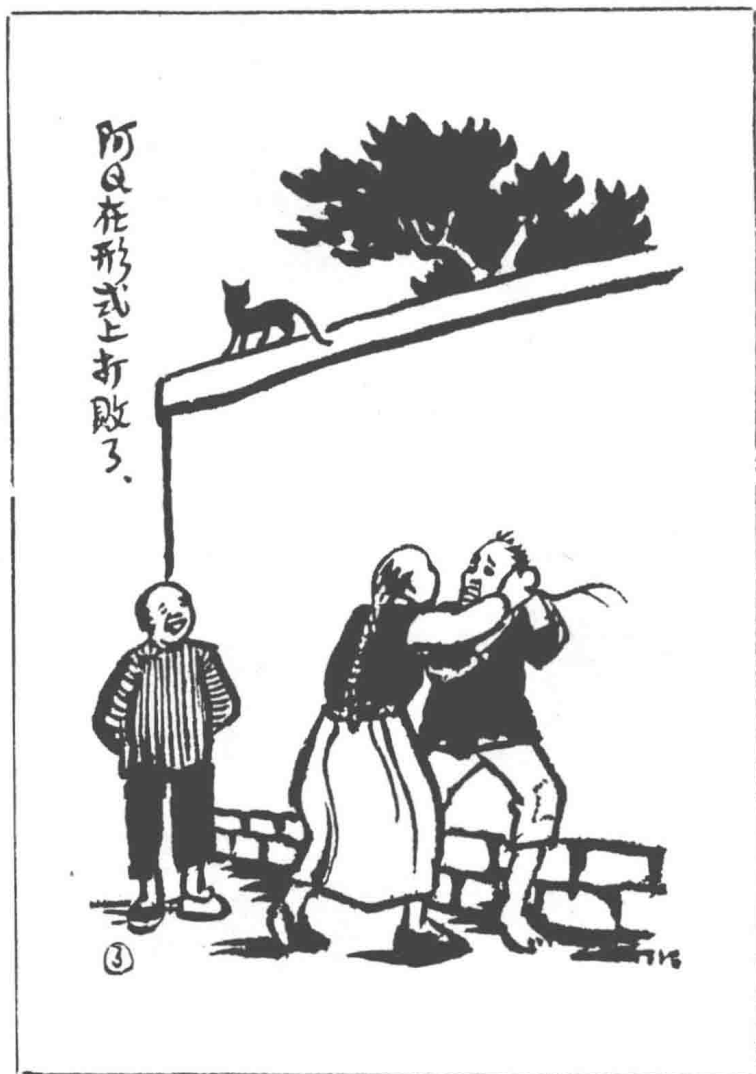
阿Q在形式上打败了