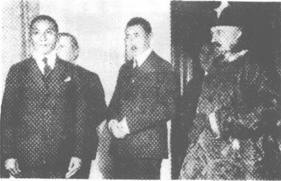
蘇聯外交委員衣蒙古服裝接見西裝代表