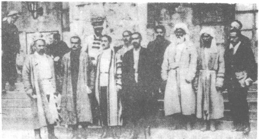
蘇聯蘇維埃大會中之土耳其斯坦代表