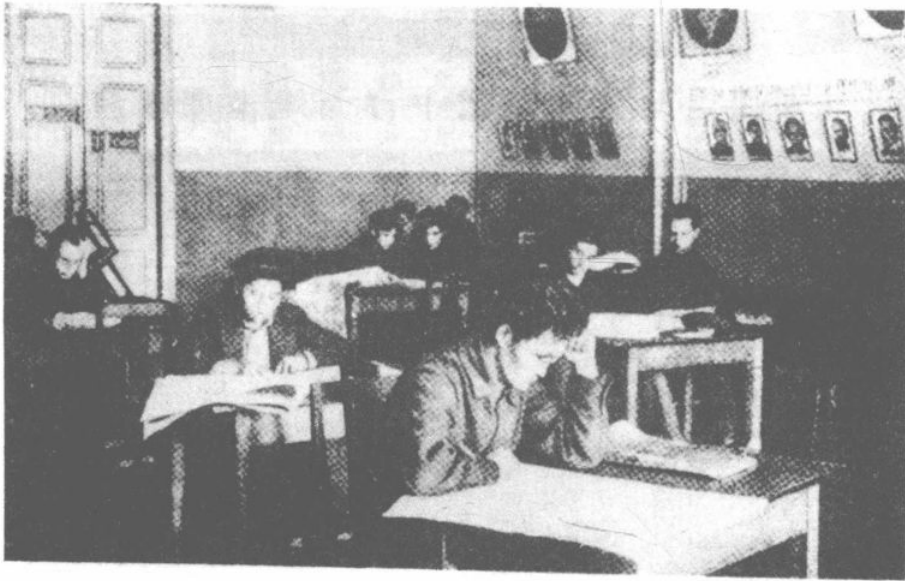
莫斯科東方大學之休業室內(有東方各國之學生)