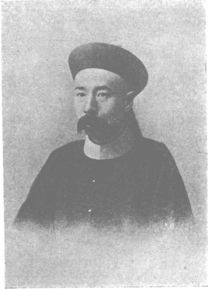
英紹郎侍左部支度