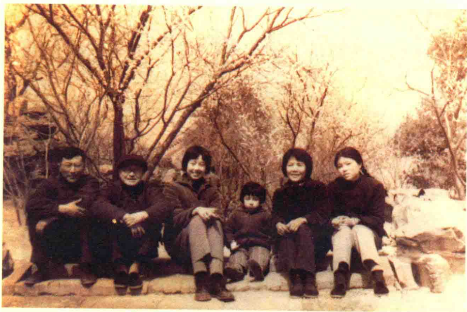
沈龙朱、沈从文与家人在北京留影。