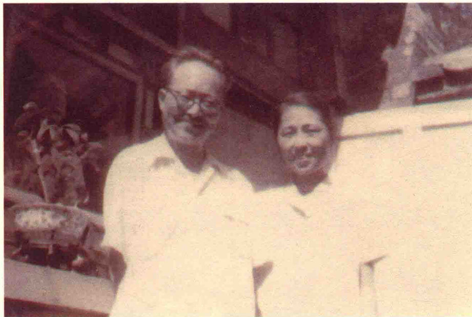
1959年，沈从文与张兆和在北京家中合影。