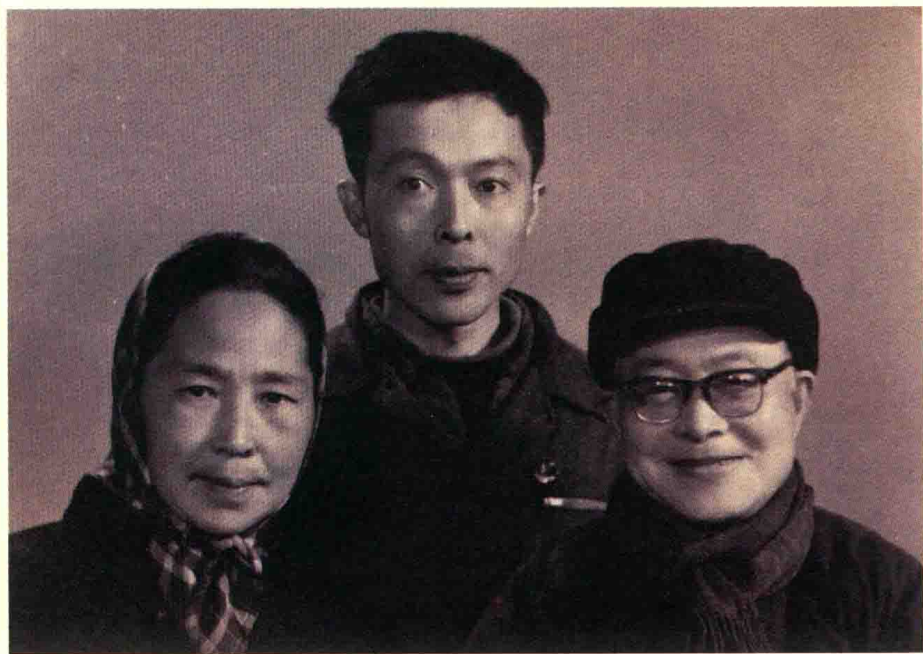
张兆和、沈从文夫妇与儿子沈虎雏。