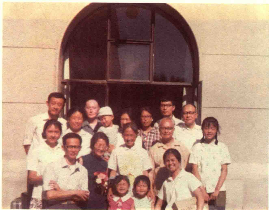
张充和第一次回国时，在北京的亲友前往机场迎接，图中二排可见周晓平、张充和、张兆和、沈从文、沈红等。