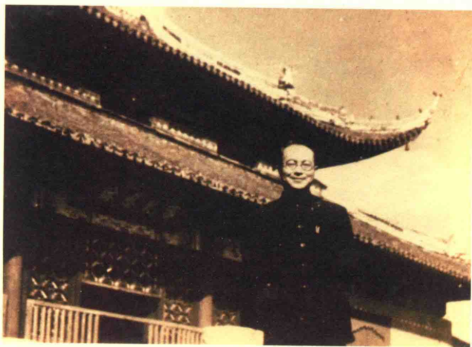
20世纪70年代，沈从文在苏州留影。