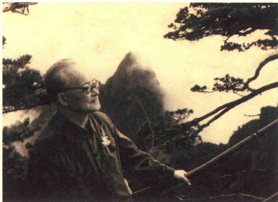
1973年6月，沈从文登上黄山始信峰留影。