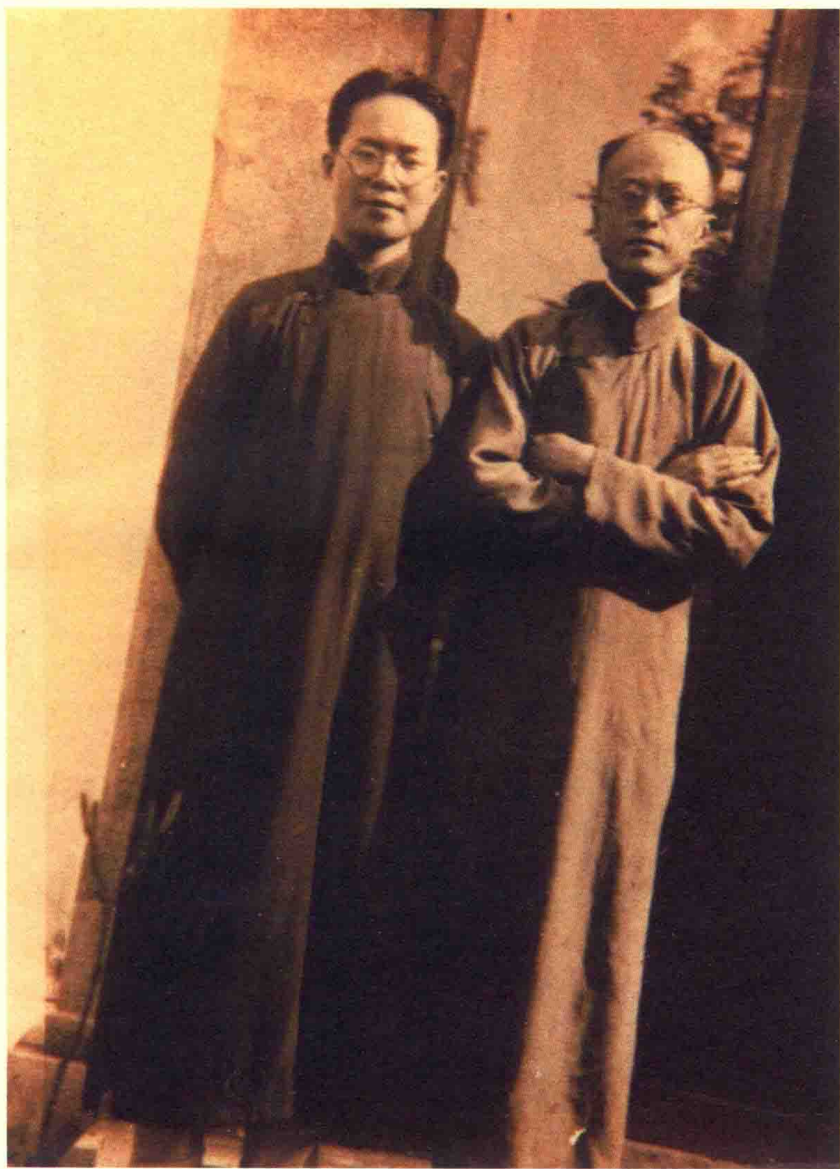
1936年，沈从文在苏州九如巷与岳父张冀牖合影。