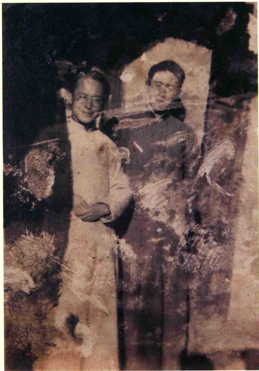
20 世纪 40 年代，沈从文与友人合影。