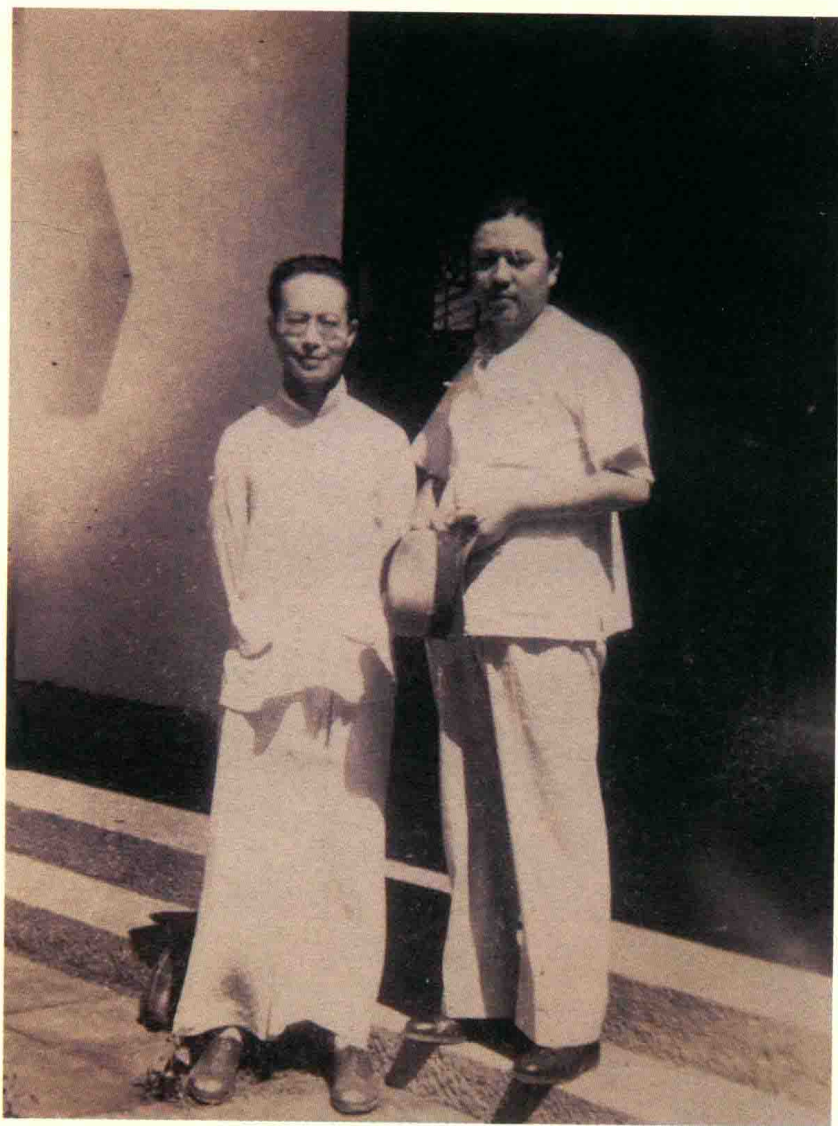
1946年，沈从文先生与张宗和先生合影。据沈从文之子龙朱先生介绍，“宗和大舅与沈从文的照片是1946年夏天在上海（或苏州）所拍摄。沈从文只有那年一直穿着白大褂。那时的亲友，男士中只有他穿大褂，对他来说，那件夏装已经是非常时髦的了！”