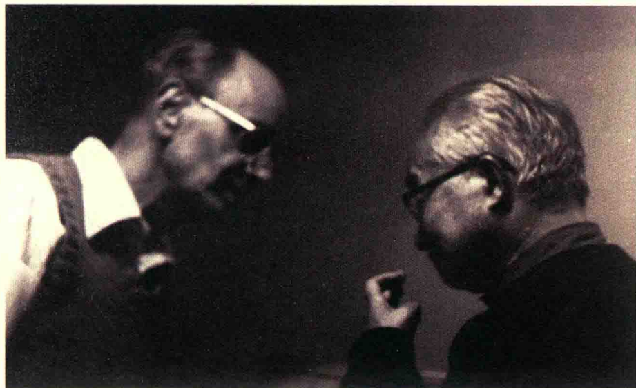
傅汉思与沈从文的合影，大约摄于20世纪80年代。