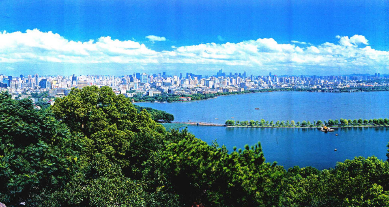
▲ البحيرة الغربية بهانغتسو