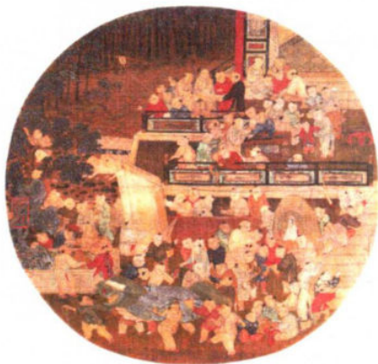
图 1-1-4 南宋苏汉臣《百子嬉春图》，该图下方为儿童狮舞