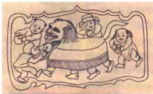
图 1-1-5 金代砖雕摹本《儿童舞狮子》

“刻木为头丝作尾，金镀眼睛银贴齿”描述过这种包衣头尾的制作工艺。当时所舞狮子的头部用木头雕刻而成，为求逼真还在眼部镀金、齿部镀银，尾部则用丝线制成。北宋陈旸《乐书·乐图论》所呈现的舞狮造型也基本沿袭了这个特点。