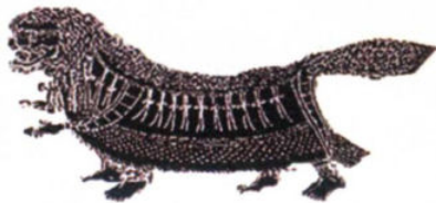
图 1-1-3 北宋陈旸《乐书·狮子舞》附图