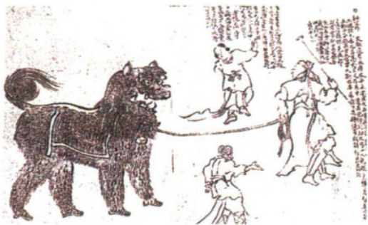
图 1-1-1 信西古乐图·狮子舞

隋朝建立后，由于隋文帝提倡节俭，不好声乐，狮舞曾于太建初年（公元560年）的元会表演中被中止，至天嘉六年（公元565年）才得以恢复。这一废立过程也使狮舞获得了独立表演的机会。在汉魏六朝数百年的历史长河中，狮舞被广泛用于中原大地的节日庆典和宗教活动当中，成为体现中国人思想观念、宗教崇拜的一种艺术表演形式。唐前期，随着西域乐舞的大规模输入，原本流行于中原地区的传统狮子舞被注入了新鲜血液，呈现出一种新的演出形态，这就是《太平乐》。《太平乐》又称“五方师子舞”，在唐王朝专用于