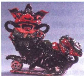
图 1-1-6 明代石湾窑三彩狮子，广州博物馆藏

明朝时期，南海地区已兴起舞狮。清乾隆版《佛山忠义乡志》载：“（八月）望日，谕祭灵应祠北帝，仪同春仲……灵应祠前，纪纲里口，行者如海，立者如山，柚灯纱笼，沿途交映，直尽三鼓乃罢。相传黄萧养寇佛山时，守者令各里杂扮故事，彻夜金鼓震天，贼疑不敢急攻，俄竟遁去，盖兵智也。后因踵之为美事，不可复禁云。”明代正统十四年（1449年）九月，黄萧养率众在南海县造反时