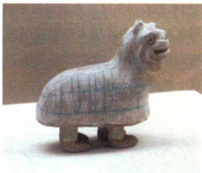
图 1-1-2 吐鲁番市阿斯塔那墓出土的唐代彩绘泥塑舞狮俑

狮身是用掺有毛绒的细泥塑成，狮子躯体外表及腿周均用篦状物压划出弯曲的条纹，象征通体披皮，即所谓“缀毛为衣”。狮身中脊饰彩带1条，两侧有下垂的彩带各4条，互相对称，且与中脊彩带相垂直。唐代大诗人白居易曾以