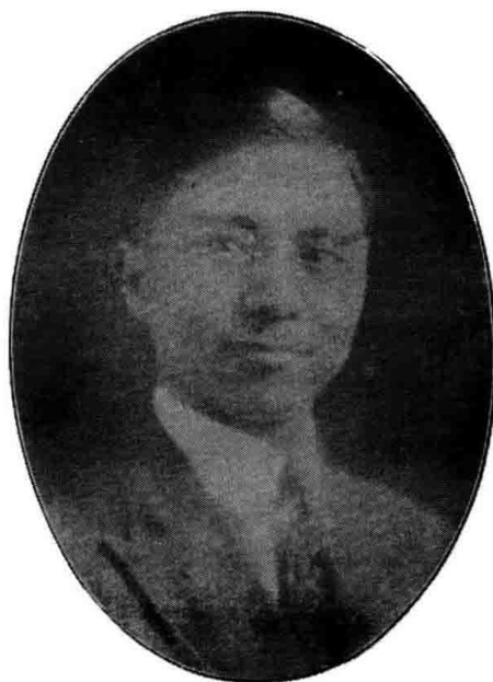
助產教育委員會 孫文本文員委員