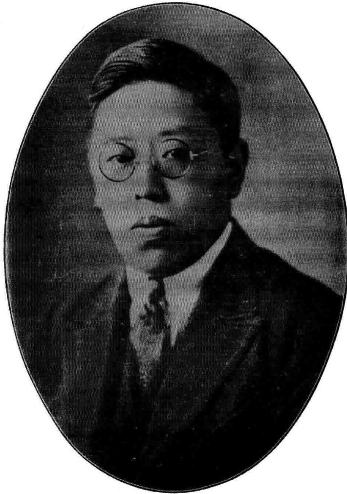
內政衛生署署長 助產教育委員會委員 劉瑞恒先生