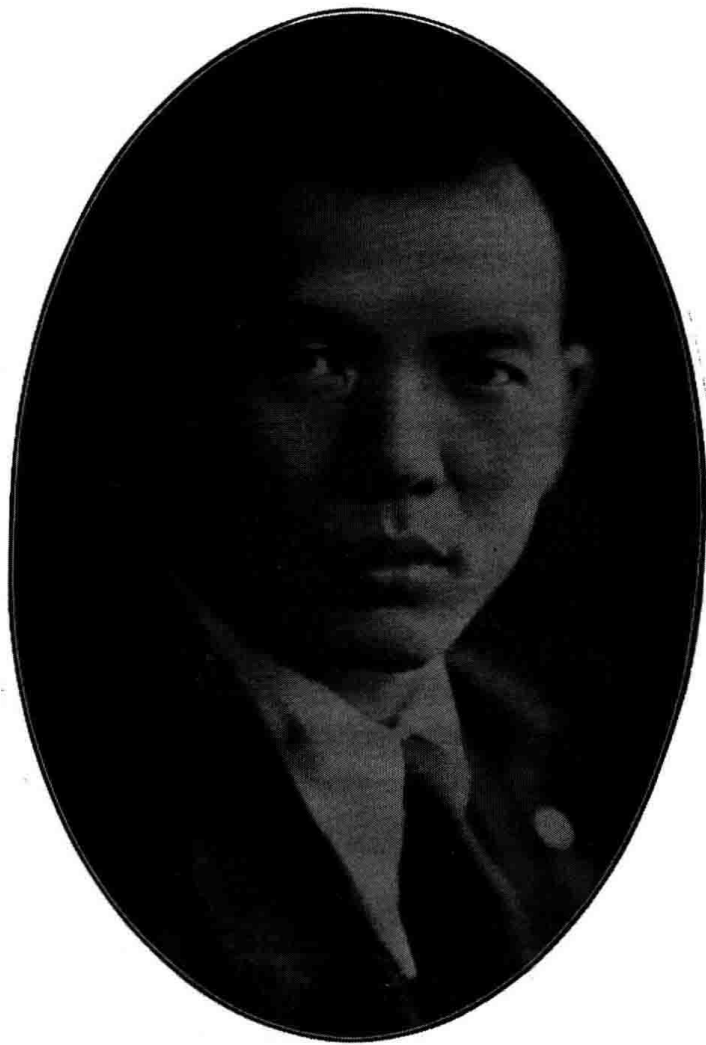
雄紹長部黃部政内