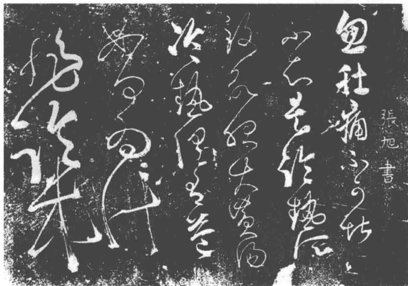
图 1-5 张旭《肚痛帖》(局部)

第三,唐朝的皇帝和公卿大臣大都善书,并多有书迹传世。唐太宗李世民就酷爱书法,且造诣颇深。开国初期,由于唐太宗李世民爱好和重视书法艺术,陆续在翰林院设侍书学士,国子监设书学博士,科举也设“书科”,学书成为入仕的门径。贞观年间,五品以上在京的文武官员子弟,只要爱好书法,都可以到弘文馆内学书,由虞世南、欧阳询等教授笔法。唐太宗尤笃好右军书,锐意临摹,拓《兰亭序》以赐朝臣,故于时士大夫皆宗法右军。唐太宗的行草书,据说深