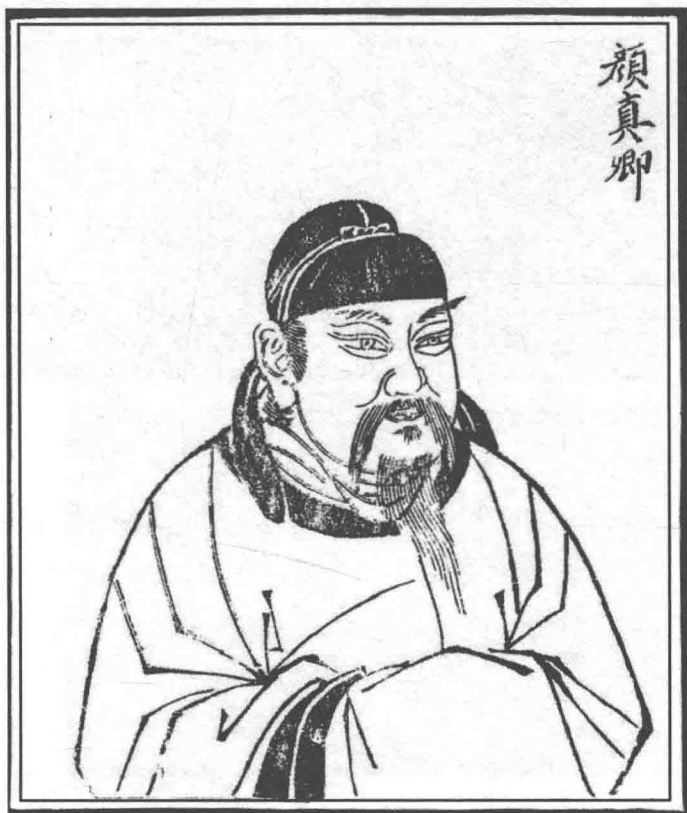
图 2-1 颜真卿像

颜盛于灵帝中平年间出任青州刺史，后在魏文帝年间，又改任徐州刺史，定居琅琊国华县城西孝悌里。颜氏在孝悌里历四世，至西晋时，已成为琅琊望族。西晋永嘉元年（307），晋室南渡。颜真卿十三世祖、颜盛曾孙颜含时任琅琊王司马睿幕府参军，率家族随司马睿南迁，侨居于上元（今江苏南京）长干里颜家巷。颜氏家族在江南共历九世，成为江南的士家大族。北周建德年间，颜真卿五世祖颜之推应周武帝征召，举家随驾入关，定居京城长安；隋