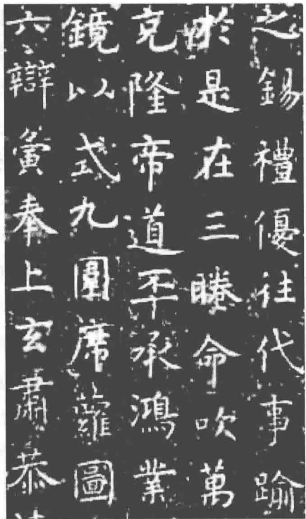
图 1-4 虞世南《孔子庙堂碑》(局部)

的个性和激情开始借助书法这一载体得到充分地展现和张扬。孙过庭在《书谱》中就提出“质以代兴,妍因俗易”“驰骛沿革,物理常然”。他以历史变化观点,强调“达其性情,形其哀乐”“随其性欲,便以为姿”,强调书法作为表情艺术的特性,并将这一点提到与诗歌并行,与自然同美的理论高度:“情动形言,取会风骚之意;阳舒阴惨,本乎天地之心。”孙过庭这一抒情哲理的提出,预示着盛中唐书法浪漫主义高峰的到来。盛中唐书法走向兴盛的重要标志是张旭和颜真卿的崛起以及以张旭、怀素为代表的草书的出现,尤其是草书,运笔流走快速,连字连笔,一派飞动,“迅疾骇人”,把悲欢情感极为痛快淋漓地倾注在笔墨之间,如同李白的诗一样无所拘束。这一时期,李邕的行书,颜真卿、柳公权的楷书,张旭和怀素的草书,李阳冰的篆书各领风骚、卓然不群,表现出强烈的时代气息和鲜明的艺术个性。以张旭等人为代表的“盛唐草书风”,是对旧的社会规范和美学标准的冲击和突破,其艺术特征是内容溢出形式,不受形式的任何束缚拘囿,是一种没有确定形式无可仿效的天才抒发。以颜真卿为