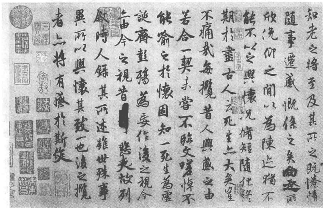
图 1-2 王羲之《兰亭序》(局部)

初唐书法基本上是魏晋南北朝及隋朝书法的延续,其总体风格趋于轻盈华美、婀娜多姿,或娟娟春媚、云雾轻笔,或高谢风尘、精神洒落。这种书风的形成,主要是唐太宗李