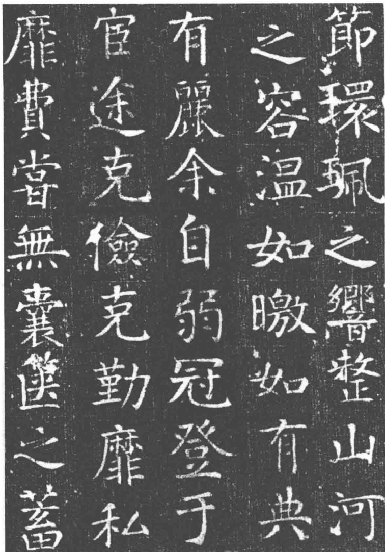
图 2-2 顏真卿《唐王琳墓志》(局部)

初，颜之推之子颜思鲁居万年县敦化坊；唐初，思鲁之子颜师古居长安县通化坊。至唐代中叶，颜氏家族在京兆共历六世，成为京兆名门巨族。