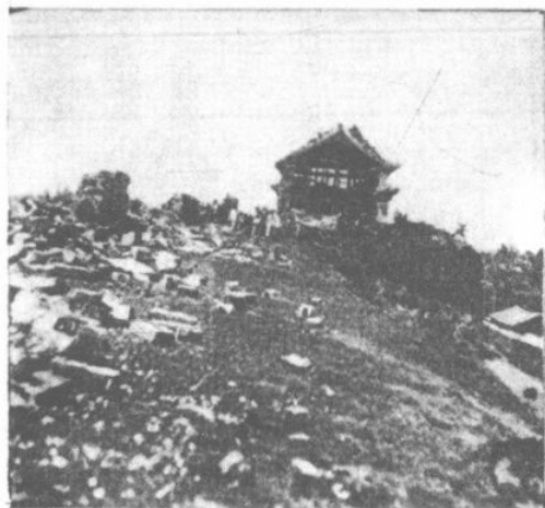
上圖坍塌後之北門城樓。中 圖坍塌後之西門城樓。下為 大理縣之鹽務稽核支所。