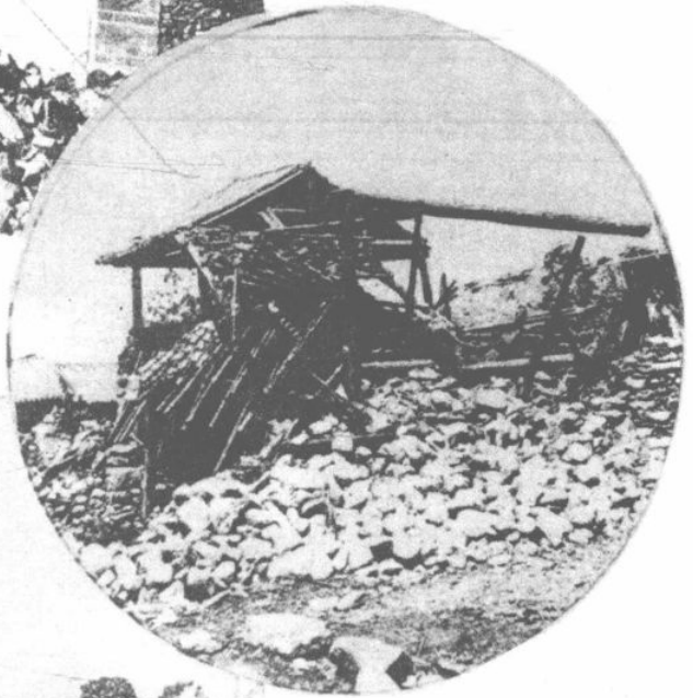
壞 坍 之 屋 民