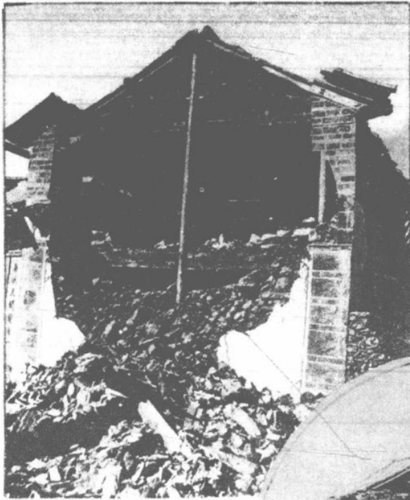
房 | 英 屋 | 美 之 | 烟 燬 | 公 壞 | 司