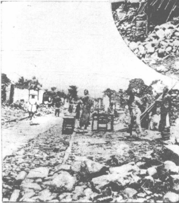
震 災 後 之 文 廟 其 地 本 為 熱 鬧 市 場