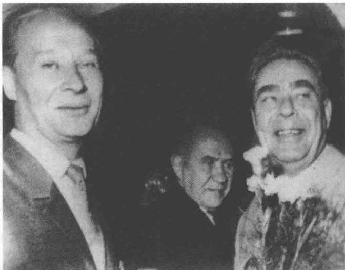
1968年春，捷共温和派领导人杜布切克(左1)推行一系列改革措施，受到人民的欢迎。