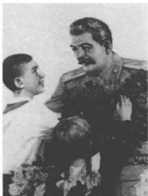
在俄罗斯各地随处可见的斯大林个人崇拜的招贴画

平共处、和平过渡、和平竞赛”的对外方针,这必然引起中苏两国在社会主义国家关系、战争与和平、和平过渡、对外政策等问题上的严重分歧;此外,赫鲁晓夫在《秘密报告》中对斯大林作了全盘否定,也引起了中苏两国和两党的分歧,预示着国际共运分裂的开始和危机的产生与发展。