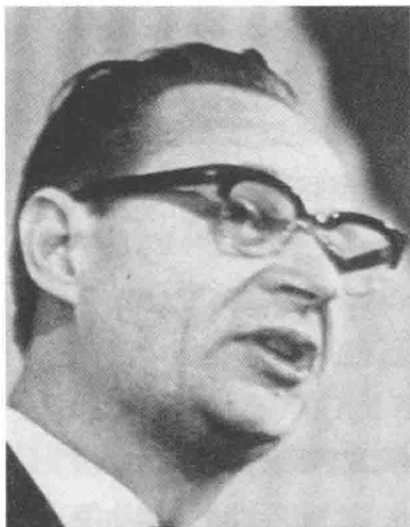
捷共中央第一书记亚历山大·杜布切克

人民群众与政府的对立。群众成立了工人委员会、革命委员会等组织，政府无法控制局势，出现了无政府状态。一些反革命分子乘机杀人、放火，使局势更加混乱。从30日起，匈牙利事件完全向错误的方向发展。在3个星期中，被杀害者达1700多人，2万多人被打伤，工农业生产遭到严重破坏。匈牙利很快落入反革命分子手中。于是，苏联不得不出兵控制局势，维护了匈牙利政权。