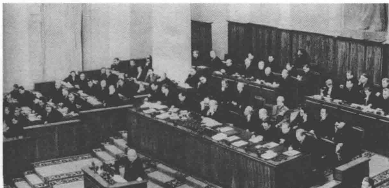
1956年2月,苏共第二十次代表大会在莫斯科召开。

波匈事件的发生更预示着国际共产主义运动和社会主义阵营内部分裂和矛盾的加剧。1956年6月28日,波兰工业城市波兹南的工人为要求提高工资、减低所得税举行罢工,上街游行,并很快发展成为要求增加民主权利、反对苏联大国沙文主义的行动。但是,苏联出动武装部队进行镇压,造成了死54人、伤200余人的流血事件。这本来是波兰工人与政府之间的矛盾和斗争,是国家内部问题,苏联不应干预,但苏联的出兵以及流血事件的发生使矛盾变得更为复杂和尖锐化。不久,波兰共产党召开八中全会,违背苏共的意志,决定改组政治局,选举哥穆尔卡为第一书记。这一行动标志着波兰人民反对苏联大国沙文主义的斗争取得了一定的胜利。在波兰事件的影响下,同年10月22日,匈牙利布达佩斯的大学生开会,决定第二天游行,声援波兰人民,同时也向政府提出改革要求。23日,学生在上街游行中喊出了“要民主”、“要纳吉上台”、“要苏联滚出去”等口号。游行结束后,一部分人要推倒斯大林塑像,这无疑是过激行为。此时,匈牙利政府采取了错误的行动,命军警开枪镇压,并请求苏联援助,这就进一步加剧了