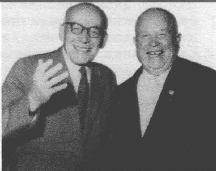
赫鲁晓夫与波兰总哥穆尔卡在一起。