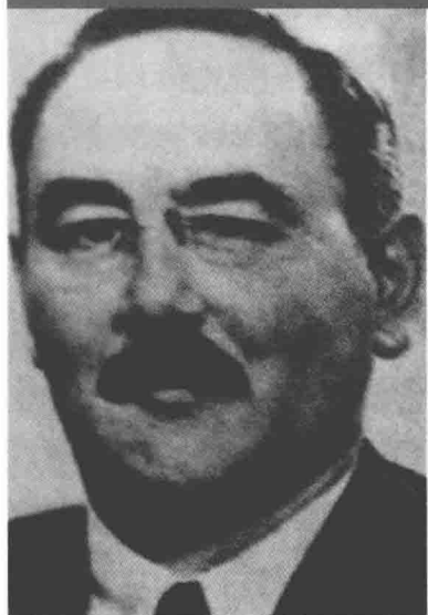
匈牙利政府总理纳吉·伊姆雷