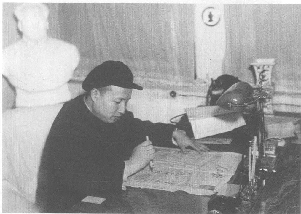
20 世纪 50 年代范长江在人民日报社工作照