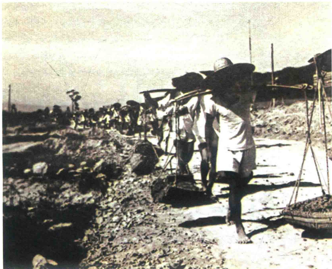
三明工业城建设工地上的劳动景象

连、烟囱林立的壮观景观，一个以钢铁、化工和机器制造业为中心的重型工业城市雏形已经形成。