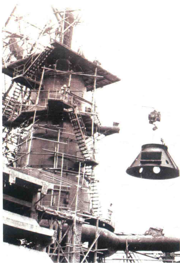
三明钢铁厂高炉在吊装

三明工业城地处梅列盆地沙溪河西岸，属低缓的丘陵地带。要把丘陵夷为平地，单移山填谷的土方就有600多万立方米。当时整个建设工地上现代化的施工机械等于零，但拓荒者们没有被